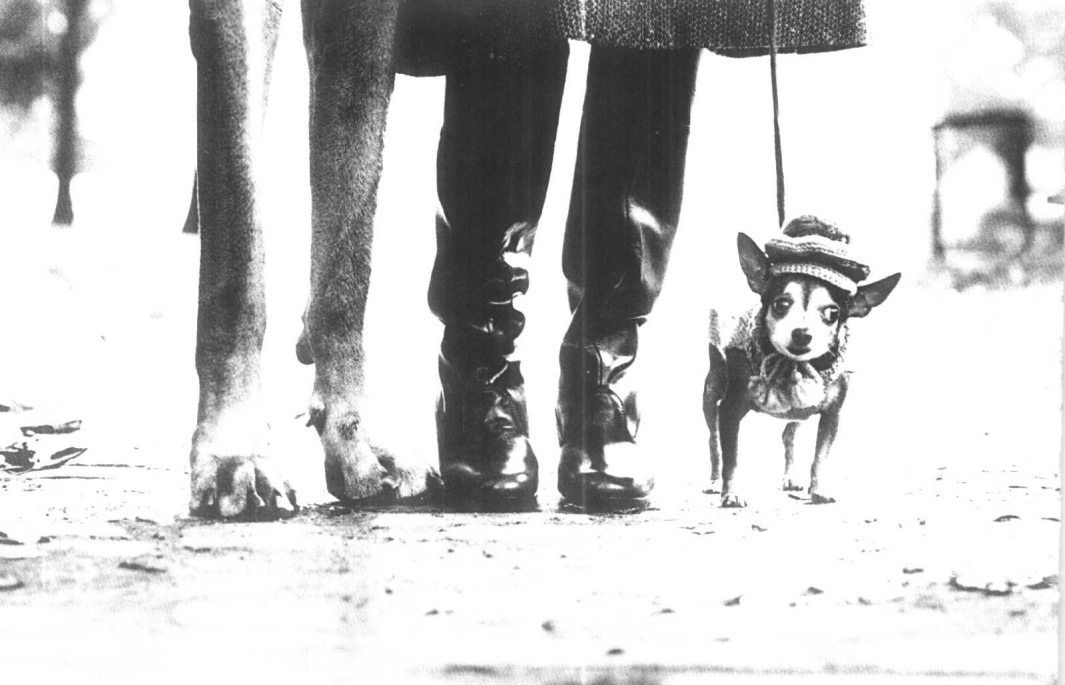
绝不会在时尚中落伍的狗 1974 纽约