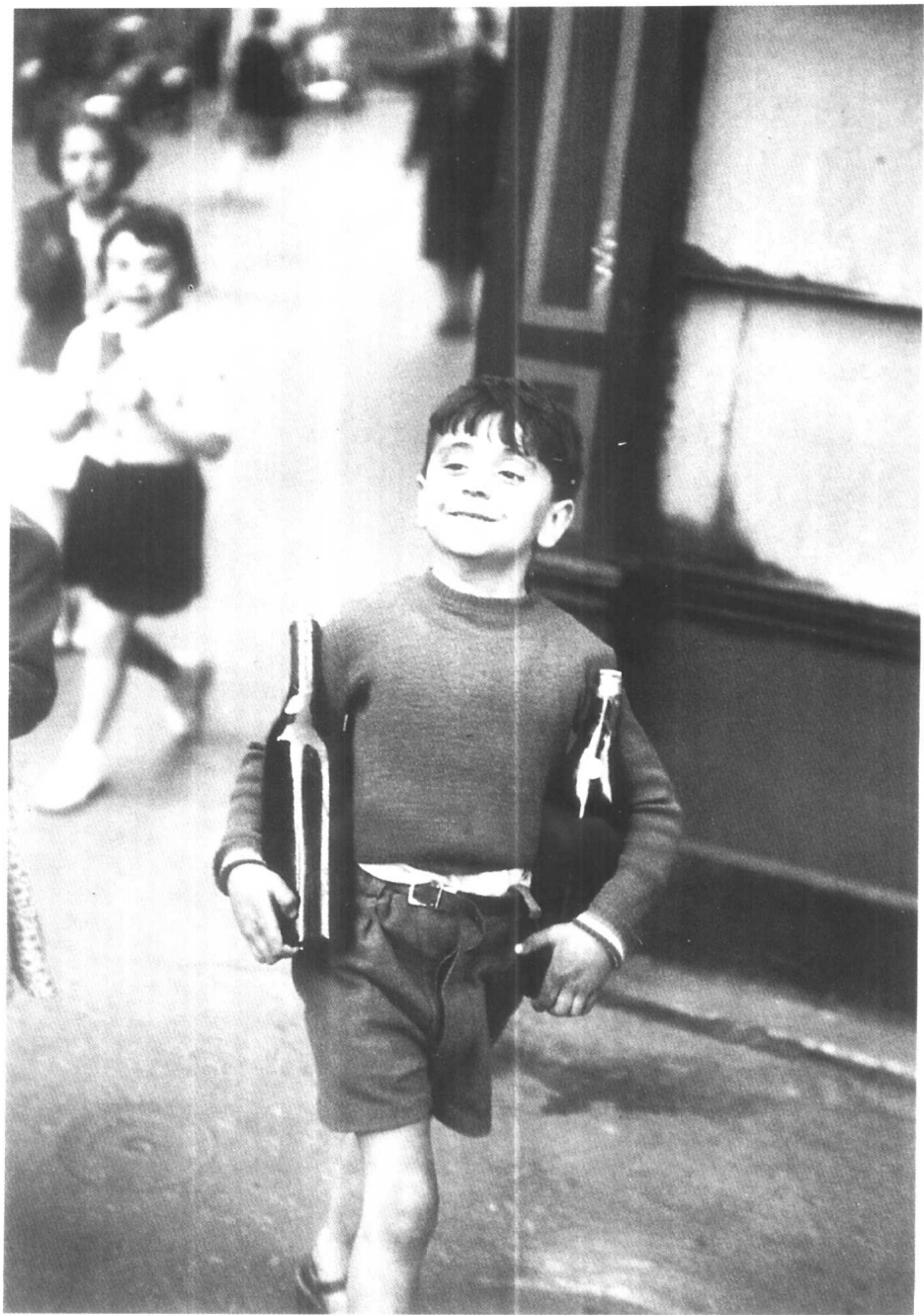
巴黎莫费塔街 布列松摄 1954