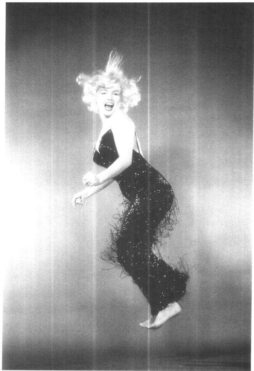
1959 年的玛丽莲·梦露