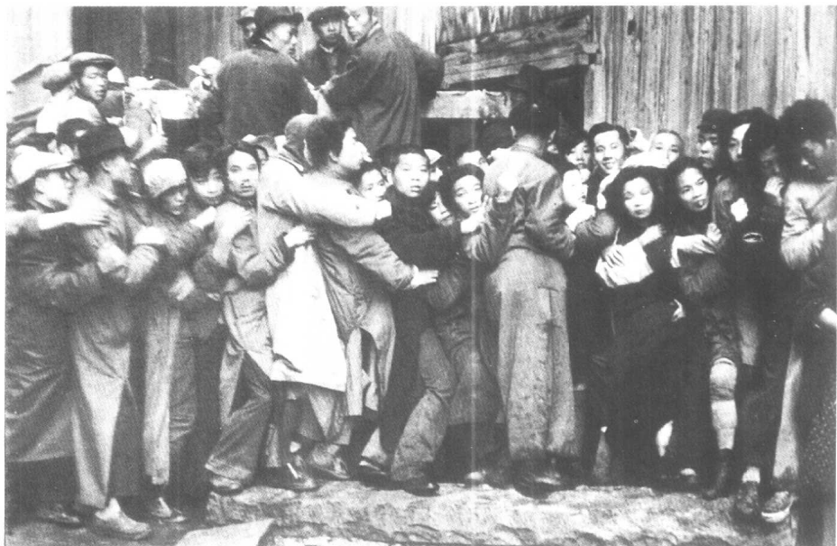
布列松摄 1949 上海

此照摄于四十年代末的上海。剧烈的通货膨胀使百姓手中的纸币几乎成为废纸。为此人们疯狂地挤在银行门口，企图兑换一点比较可靠的黄金。