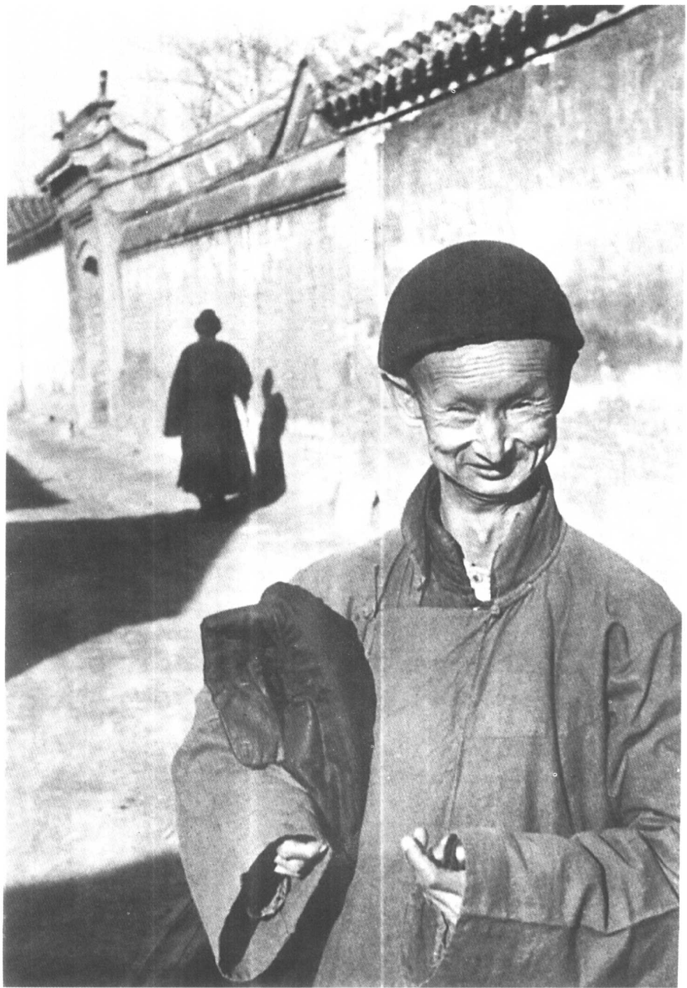
末代皇宮太監 1949 北京