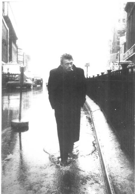
60年代的好莱坞偶像詹姆斯·迪安在 纽约时代广场 1955