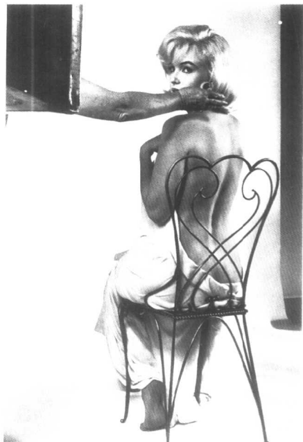
梦露的抗议 伊芙·阿诺德摄 1962