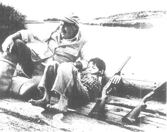
打猎归来的海明威及幼子 1931 美国