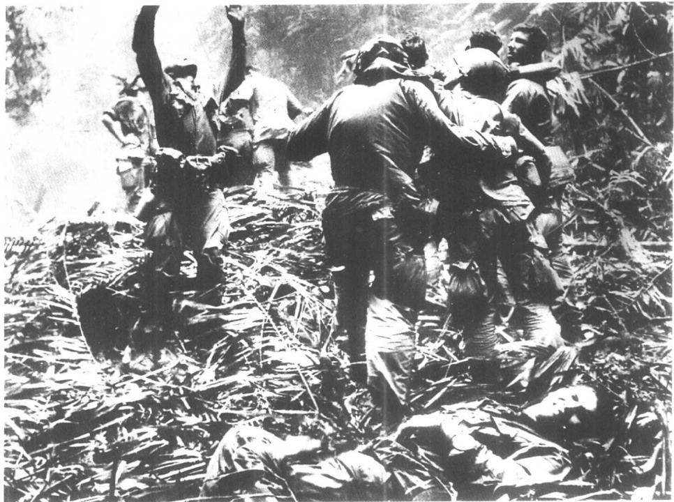
美军在越战丛林中,一个等待撤退的士兵向天上的直升机拼命呼喊