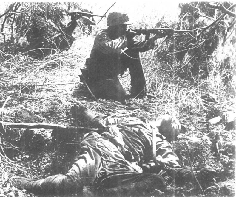
塞班岛登陆战中的一个镜头