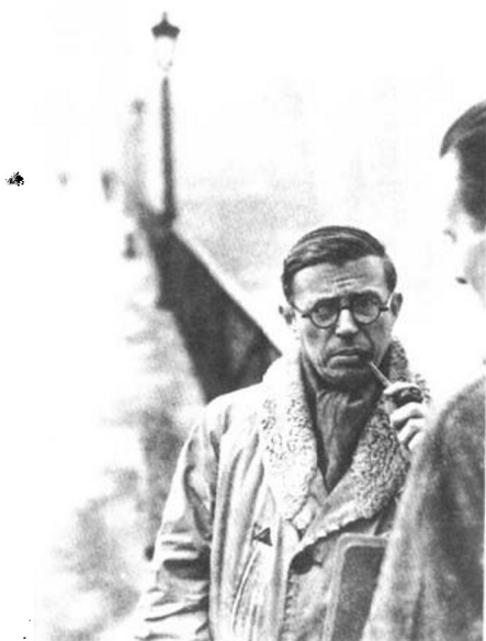
1946 巴黎

塞纳河边的两个男人分别是存在主义思潮的两个代表人物萨特和加缪，他们曾先后被授诺贝尔文学奖（萨特拒领）。背对镜头的加缪头发梳得笔直，腋下夹着文件包，而萨特叼着他已熄灭了的木烟斗，似乎在沉思，又似乎对他的朋友不屑一顾。这是两位大师翻脸前的最后一张合影。