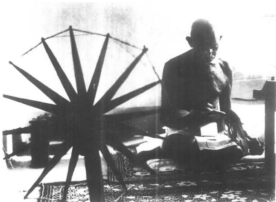
斋日里的甘地 1946 印度