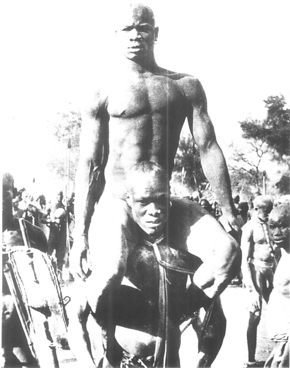
部落成员抬着角斗胜利者 1949 南苏丹