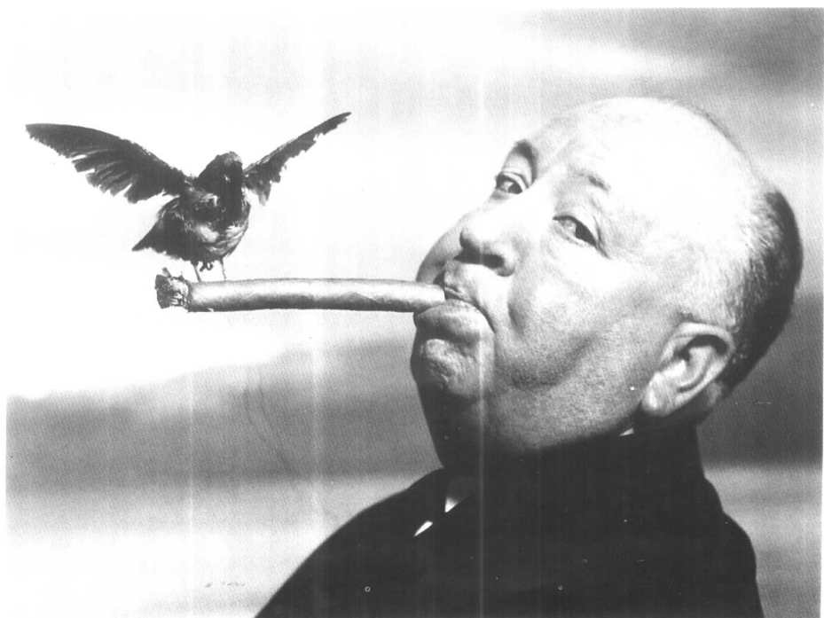
悬念故事大师希区柯克 1962