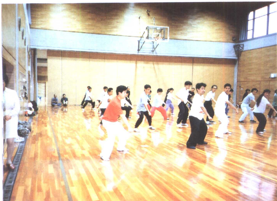
作者于 1995 年 8 月在日本讲学