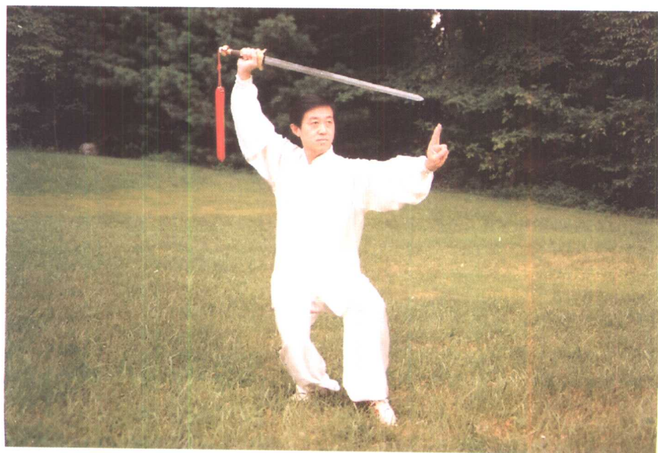
作者于 1996 年 8 月在美国讲学表演