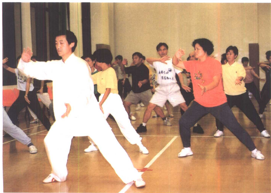
作者于 1993 年 10 月在香港教拳