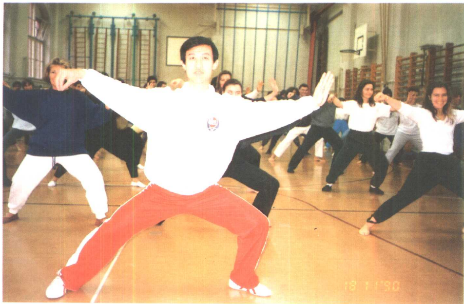
作者于 1990 年 11 月在瑞士讲学