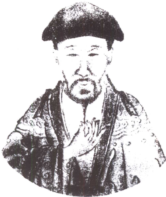
太极拳创始人陈王廷遗像 (1600—1680)