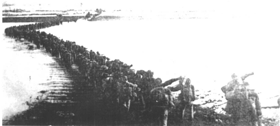
1950年10月19日黄昏，中国人民志愿军第13兵团，从长甸河口架设的浮桥上跨过鸭绿江。