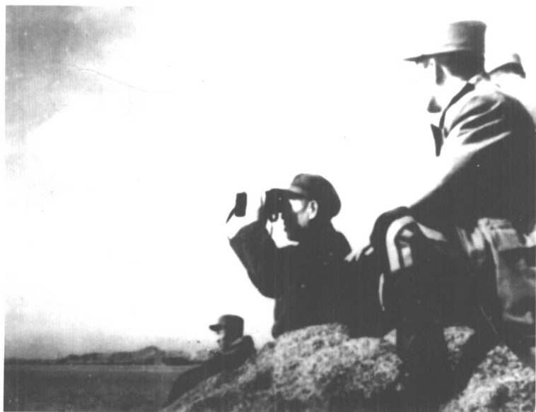
1953年1月，邓华司令员在朝鲜西海岸抗登陆作战准备阶段，在朝鲜人民军第4军团防御地区察看地形。