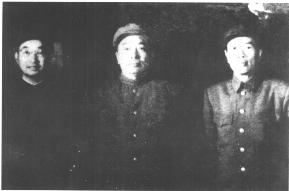
中国人民志愿军司令员兼政委彭德怀(中)、副司令员兼副政委邓华(右)、副司令员陈赓(左)。