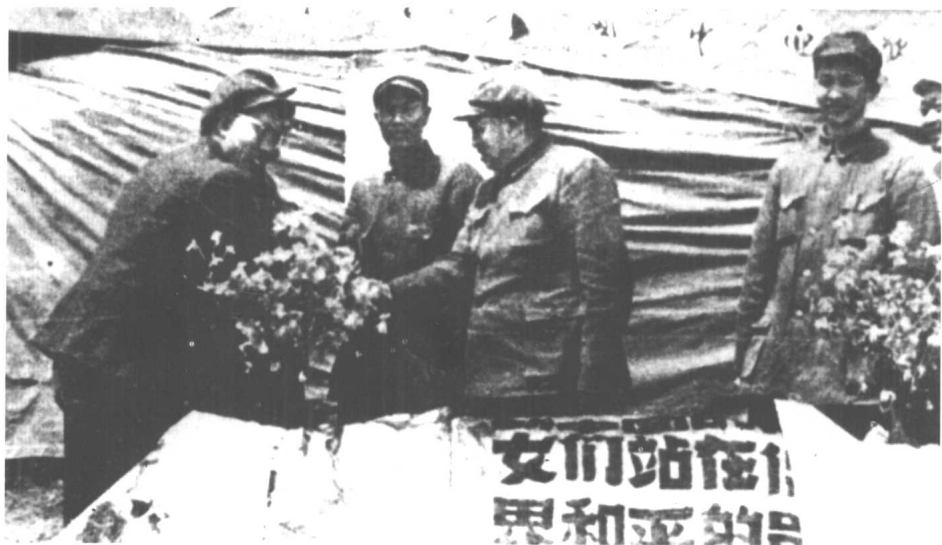
中国人民志愿军司令员兼政委彭德怀(右2)、副司令员邓华(右3)、副司令员兼志愿军后勤司令员洪学智(右1)参加欢迎祖国人民慰问团大会。