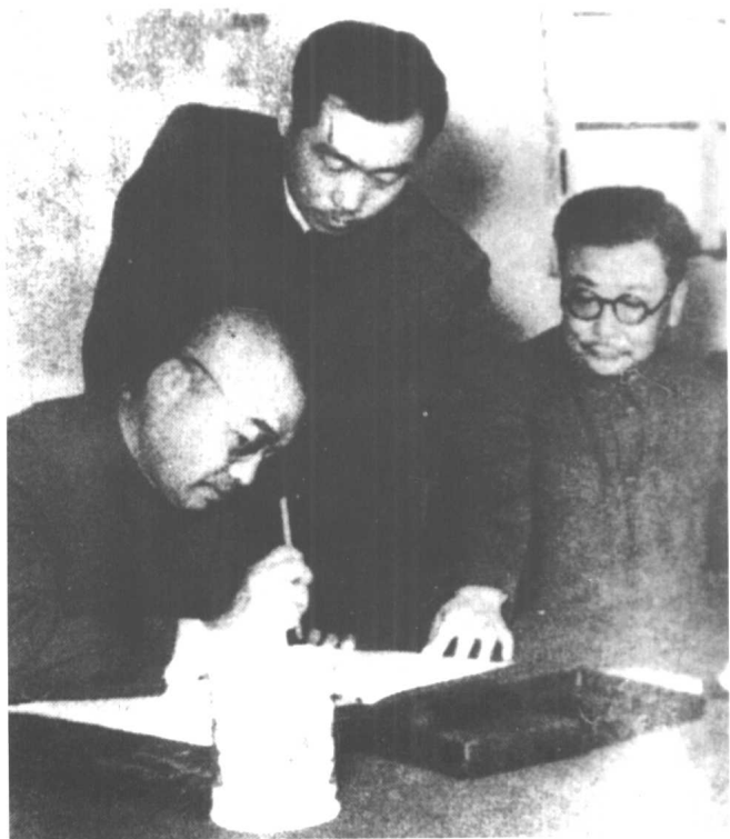
1953年7月28日，在朝鲜开城，志愿军司令员彭德怀(左1)在朝鲜战争停战协定上签字。李克农同志(右1)是我方停战谈判代表团领导者。