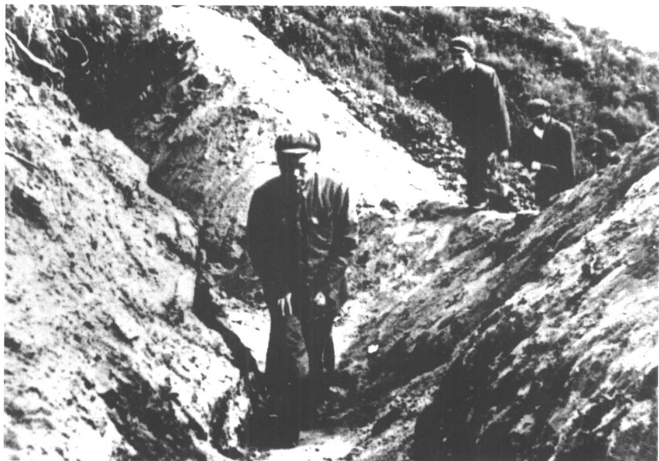
彭德怀司令员在前线向某师指挥所行进途中。