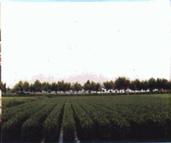
杂交稻和垄稻沟鱼