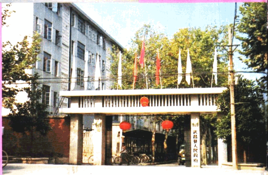
武昌县人民政府门楼