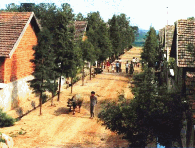
乌龙泉镇农村新貌