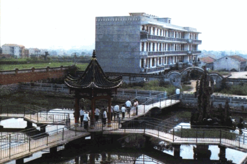
武昌县社会福利院