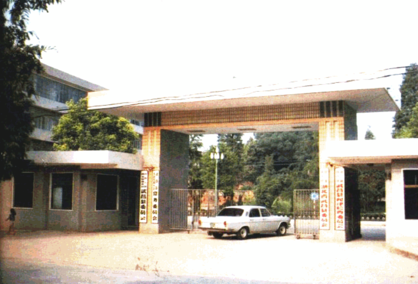
中共武昌县委、县人大、 县政协、县纪委门楼