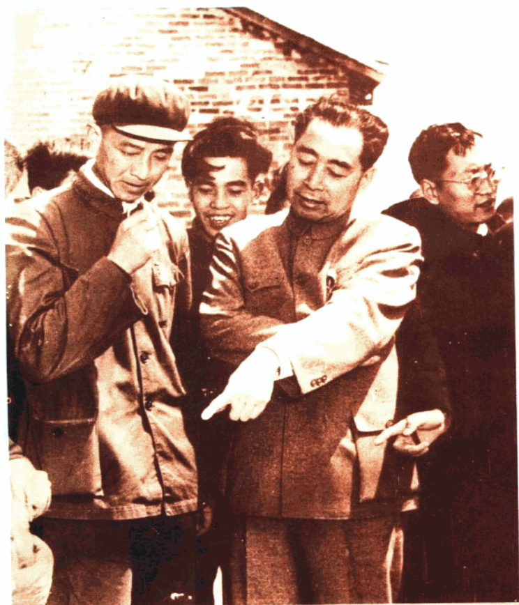
国务院总理周恩来一九五八年视察武昌县