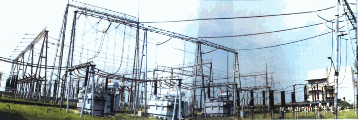
凤凰山500千伏变电站