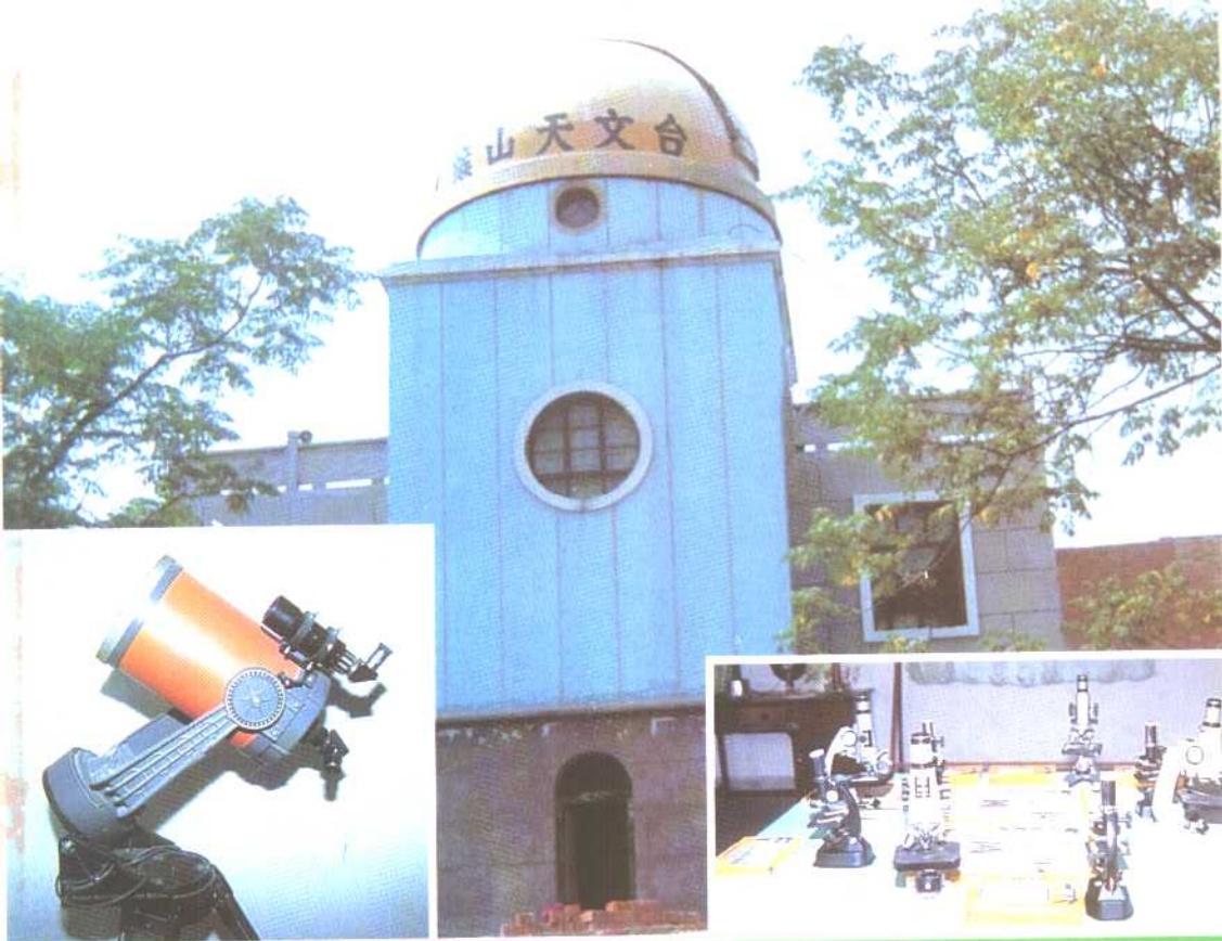
美籍华人向偃师县缙山青少年科学宫捐赠的部分仪器