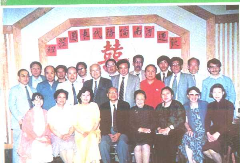
1987年,美国纽约河南同乡会欢迎河南省侨务代表团