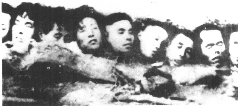
为了显示军功，日军将砍下的南京民众头颅排在一起，摄影留念。——原照从日俘身上所得，系南京国民政府国防部审判战犯军事法庭存件之一。