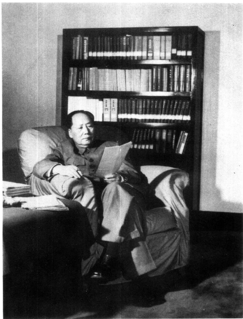
1961年毛泽东在读书（广州）