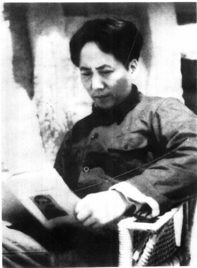
1939年毛泽东在读书（延安）