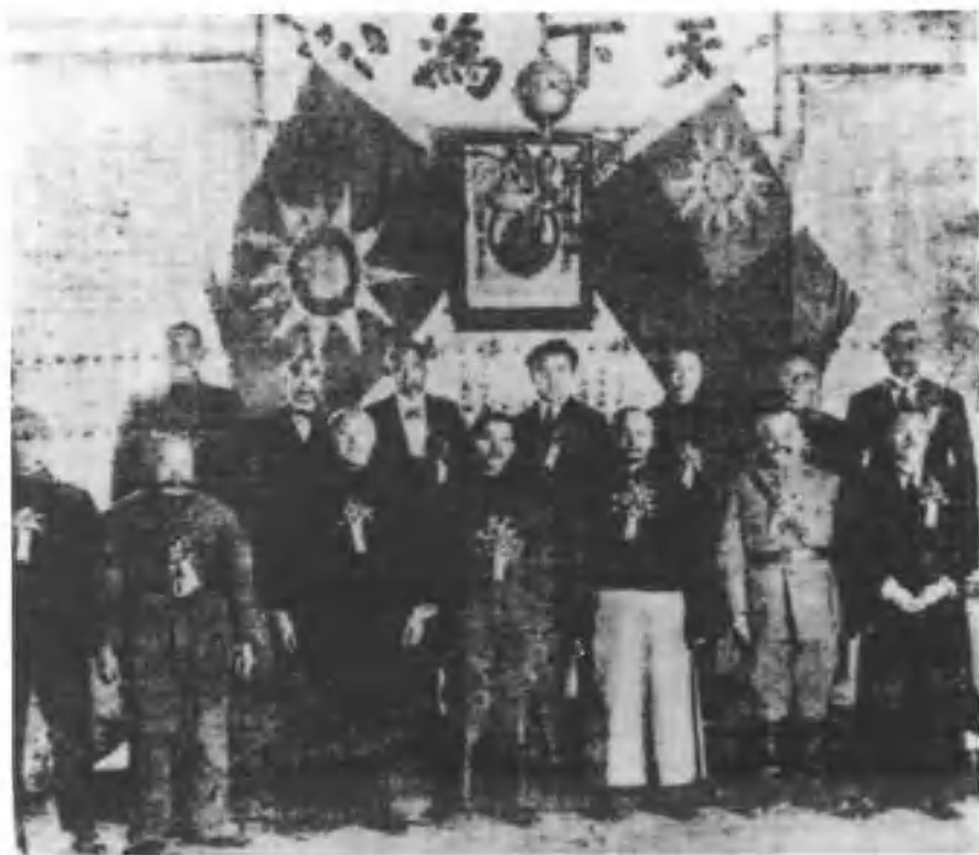
一九二九年一月十五日，張學良（右四）、張作相（左三）、 萬福麟（左二）宣誓就任東三省邊防軍正副司令長官，右 三為國民政府監督人方本仁。