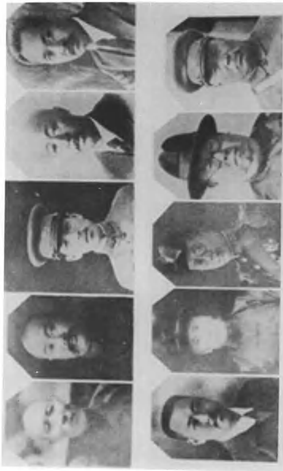
一九二九年一月七日，東北政務委員會成立，圖為主席張學良及部分委員 (上排左起為翟文選、萬福麟、張學良、張作相、莫德惠，下排左起為劉哲、 劉尚清、沈鴻烈、王樹翰、湯玉麟)。