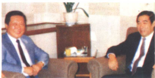
1988年上海市副市长刘振元会见陈德薰先生(左)