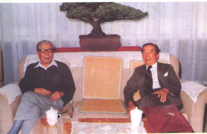
包玉刚先生(右)在上海