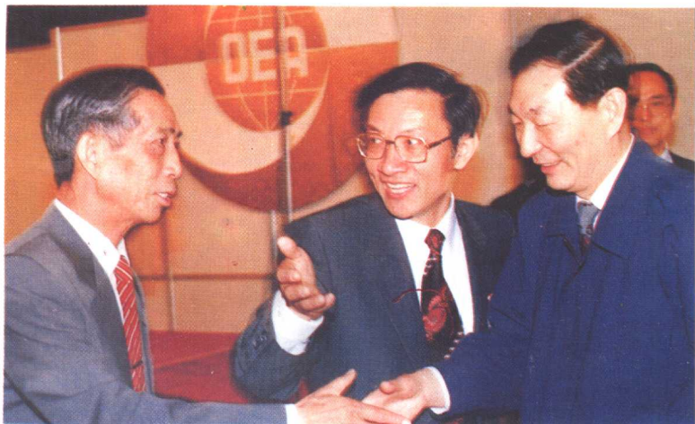
1990年5月上海市前市长朱镕基会见张鼎九先生(左)