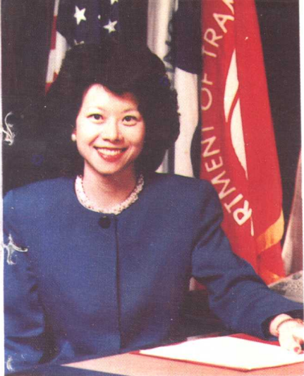
美国联邦政府 交通部副部长 赵小兰近影