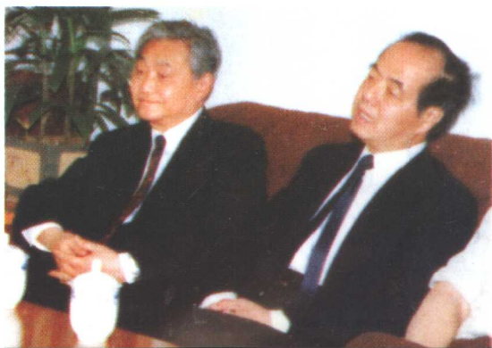
1988年李政道(右) 在中国科学院上海分院