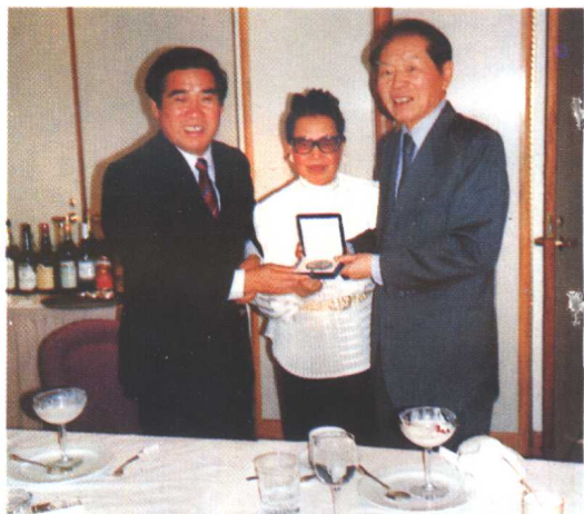
1990年上海市副市长刘振元会见顾衍时先生(左)