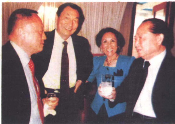
1990年上海市前市长朱镕基会见沈坚白先生(左一)