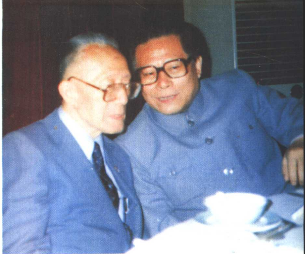
1986年6月9日前上海市 委书记江泽民在上海会见 顾毓琇(左)先生