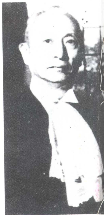
50年代的顾维钧先生