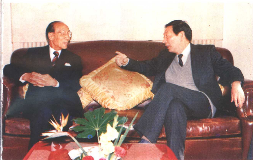
· 1990年1月上海市前市长朱镕基会见邵逸夫先生(左)