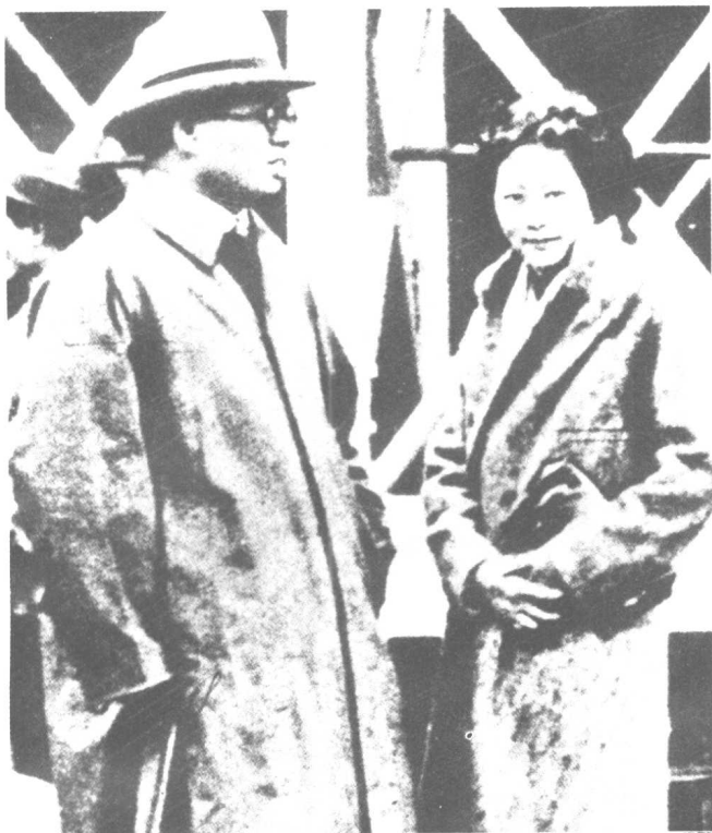
左图：宋子文和夫人