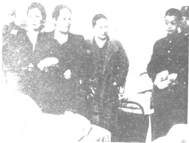
宋子文的三个姐妹非因抗战难得聚首