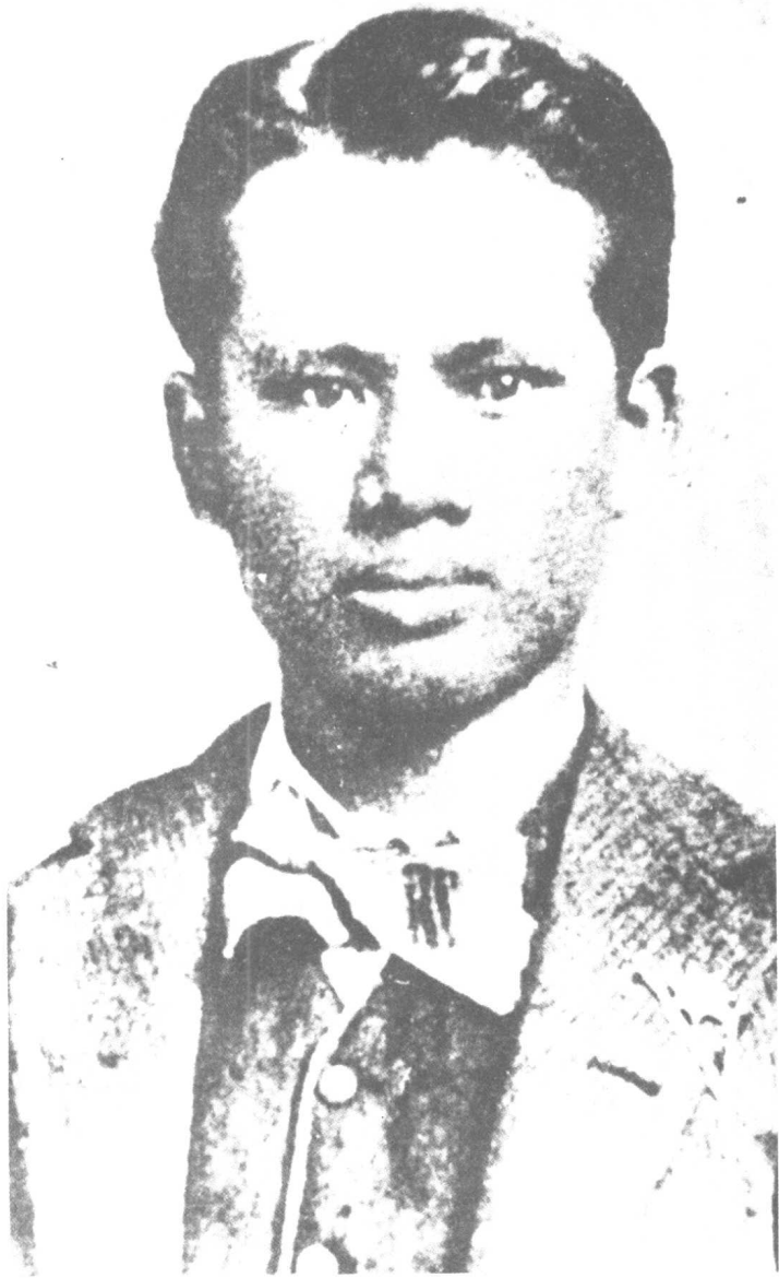
宋查理(宋子文之父)