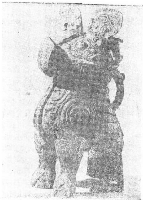
商·鸱尊 河南省安阳殷墟出土

所谓不孝之鸟。但古代又以为枭鸟有辟兵的神秘力量，《淮南子·说林训》：“鼓造辟兵，寿尽五月之望。”鼓造即枭，说明枭鸟能辟兵，应是很古老的传说。当然，能辟兵，首要之点就是要胜于兵，这种风俗在汉代就很普遍，并有“以得人为枭，失士为兪”之说，然《晋书·张重华传》记载更详：传汉室后裔张重华以主簿谢艾为中坚将军，配步骑五千，引师出征讨寇，宿夜，有二枭鸣于营中，艾曰：“枭，邀也，六博得枭者胜，今枭鸣于营中，是克敌之兆。”于是进战，大破敌寇，斩首五千级。这一史料表明，鸱鸺是勇