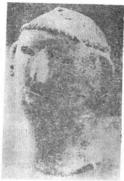
仰韶文化时期·残陶塑人头形器口 1964年甘肃社县高寺头仰韶文化遗址出土

型的陶器中，也能发现这种以陶塑人头，配上类似兽皮花纹为装饰的实例。粗粗想来，这也许是原始社会人们的一种纹身习俗；也许是为崇拜祖先或其他宗教信仰所反映的特殊形式，然而，这种形式恰恰获得了一种超模拟内涵的意义，使人们对它的感受取得了超感觉的性能和价值。它不是别的，正是人们审美意识和雕塑艺术创作的萌芽。