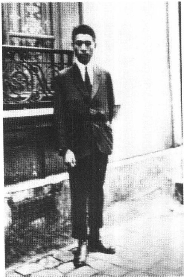
伯伯在巴黎勤工俭学时的住所门前。

“哎,你爷爷为人忠厚老实,在外工作多年,一个月最多挣过30块钱,只够他在外面自己生活,但凡有一点可能,他也早把我们哥仨接出老家了,你伯伯写信给他,只会给他添烦心事,于事无补啊!而你四爷爷没有孩子,多年在外,经常接济家里,所以,家里有点难处,你伯伯都是跟他商量。你伯伯