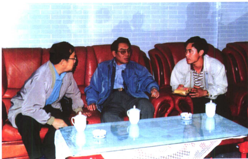
1997年9月2日在天池研究案情。(图中为自治区公安厅副厅长杨德禄，右为公安部五局一处处长刘晓辉，左为乌鲁木齐市公安局副局长张海)