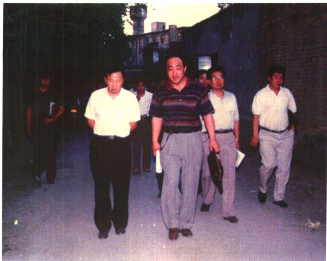
1997年8月28日公安部五局局长张新枫同志在“8·19”案件现场听取乌鲁木齐市公安局领导同志介绍案情。