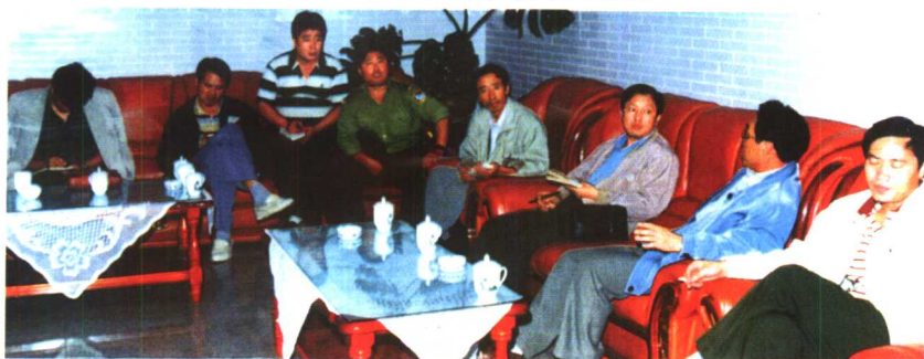
1997年9月2日，在天池分析研究案件情况。