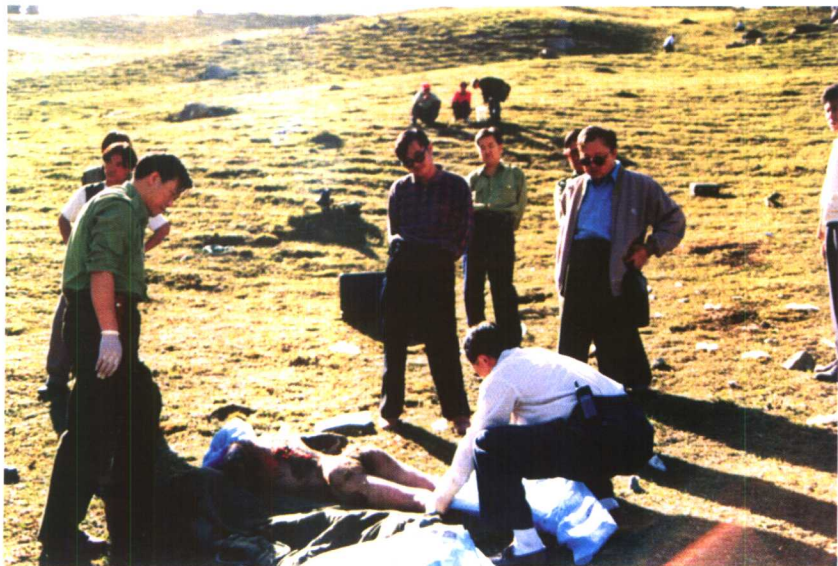
1997年9月2日，在天池高山现场勘查被枪杀后焚尸的现场工作情况。