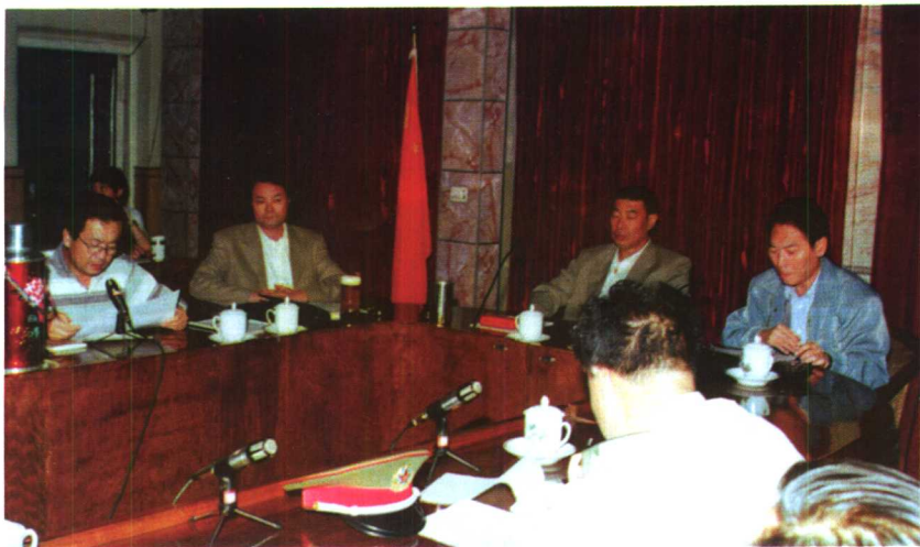
新疆生产建设兵团副司令王汉儒主持会议部署兵农六师、农七师、农八师侦破“8·19”系列案件工作，公安厅副厅长杨德禄参加了会议(图中为兵团副司令王汉儒)。