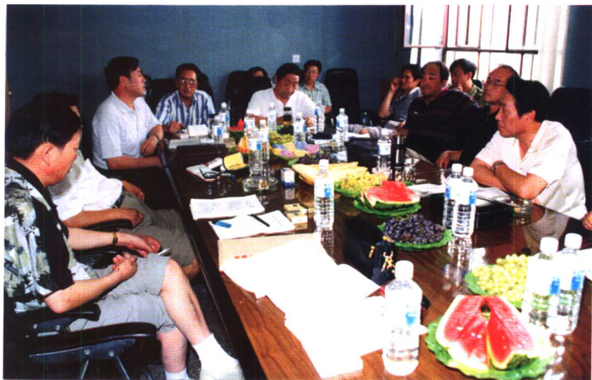
1997年8月18日新疆维吾尔自治区公安厅针对“7·5”、“8·8”案件情况，召集兵团公安局、石河子市公安局、乌鲁木齐市公安局的同志，分析研究案情、部署侦查措施。