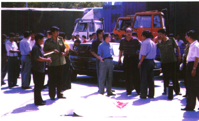
1997年8月19日上午12时许乌鲁木齐市边疆宾馆持枪抢劫杀人的现场(图为乌鲁木齐市公安局领导和刑侦支队领导在现场部署工作)。