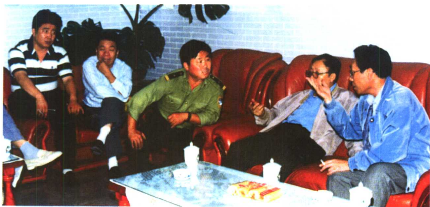
1997年9月2日在天池研究案情。