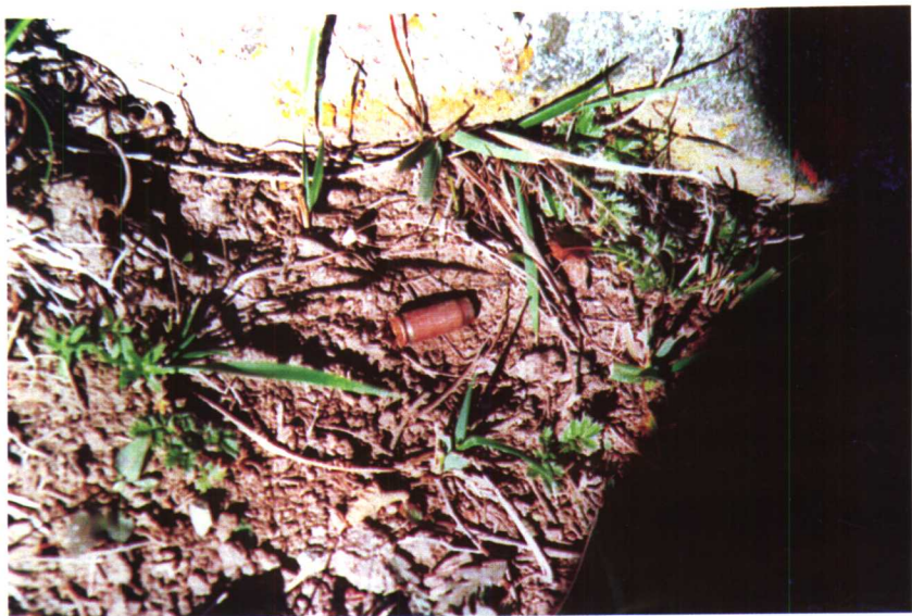
1997年9月2日在天池高山现场发现一枚弹壳。