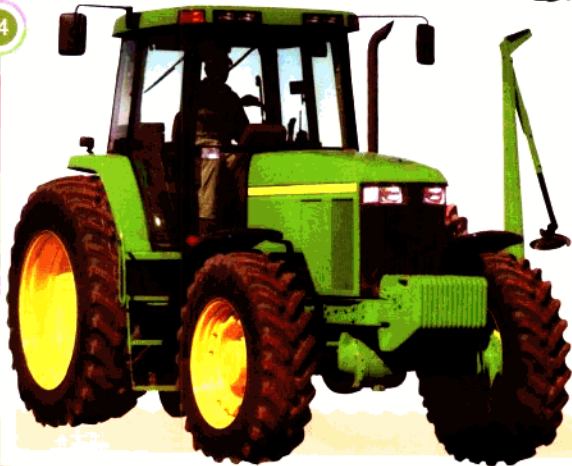
shōu gē jī 收割机