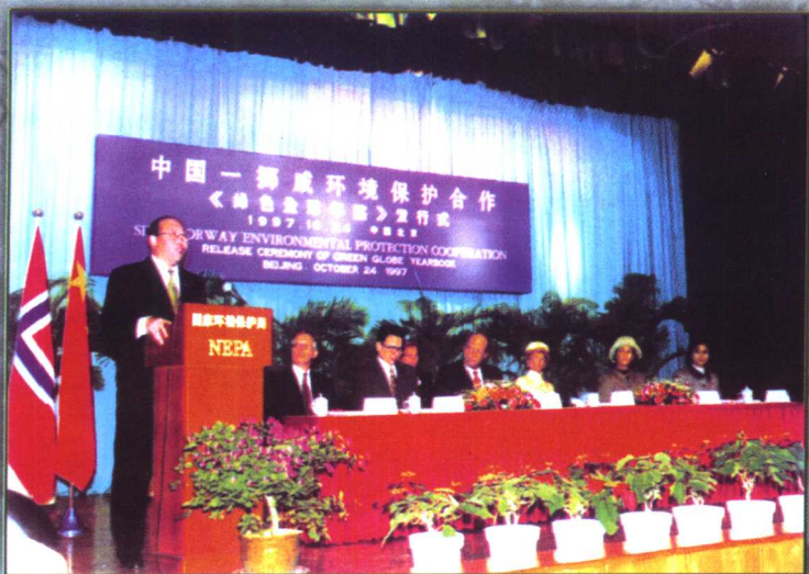
1997年10月24日，挪威国王伉俪访问国家环保局