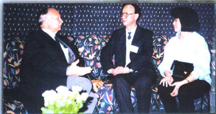
1991年6月北京召开的发展中国家环境与发展部长级会议期间，曲格平局长与联合国环发大会秘书长斯特朗先生亲切会谈