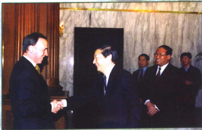
1997年11月20日朱镕基副总理在钓鱼台会见 来华出席环境论坛会议的澳大利亚前总理基廷