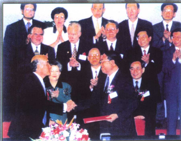
1998年6月29日美国商务部长戴利与中国国家环境保护总局解振华局长签定“空气质量监测项目”合作意见书