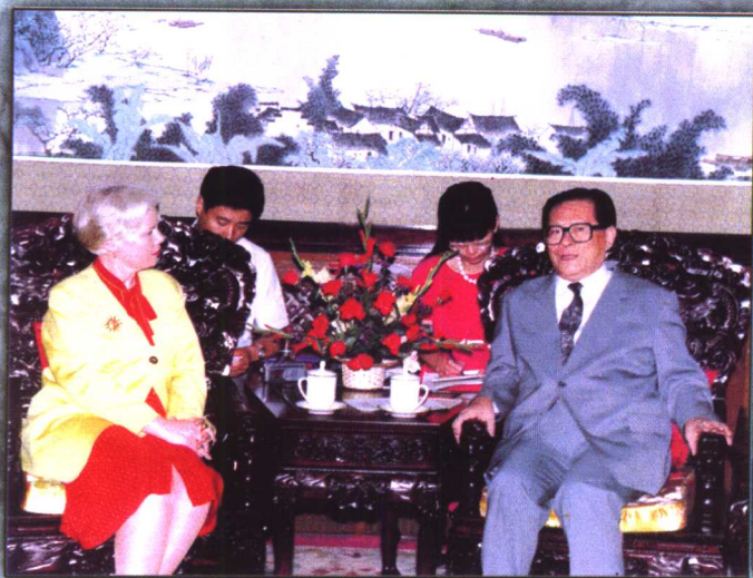
1993年6月4日，国家主席江泽民在中南海会见联合国环境规划署执行主任多德斯韦尔女士