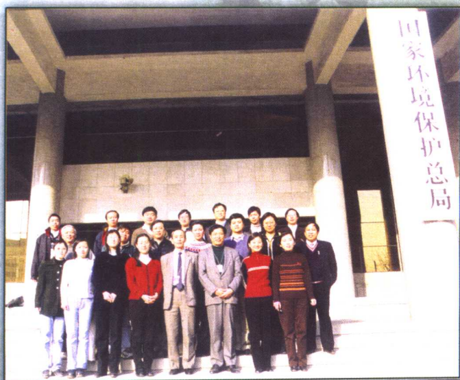
国家环保总局国际合作司于1998年7月组建，这是包括借调人员在内的全体同志