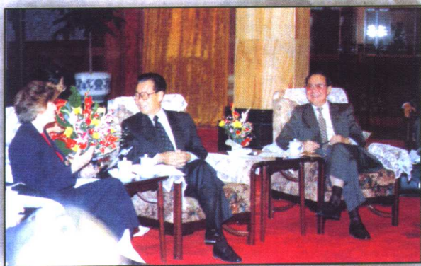
1994年9月22日下午，中共中央政治局常委、全国政协主席李瑞环会见了中国环境与发展国际合作委员会副主席、加拿大国际开发署署长霍盖特·拉贝尔女士及参加该委员会第三次会议的中外委员