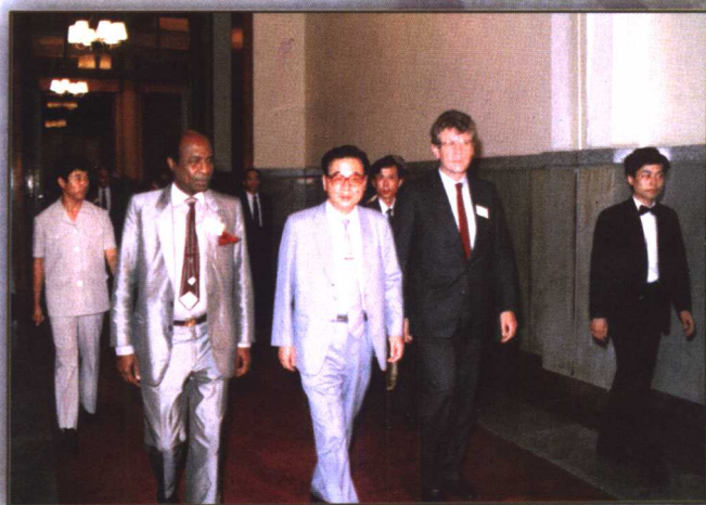
1987年7月李鹏副总理在人民大会堂会见了世界环境与发展委员会访华成员