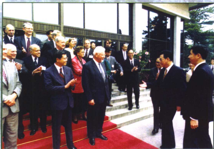
1995年9月10日，国务院总理李鹏在北京会见出席中国环境与发展国际合作委员会第四次会议的 代表