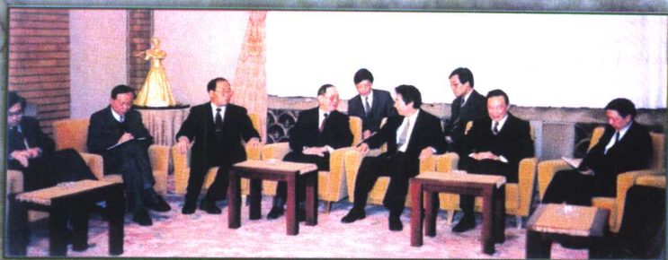
1993年11月24日，国务委员宋健，国家环保局局长解振华访日期间拜会日本首相细川护熙