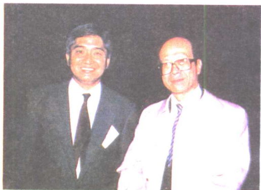
荣智健和李嘉诚合照