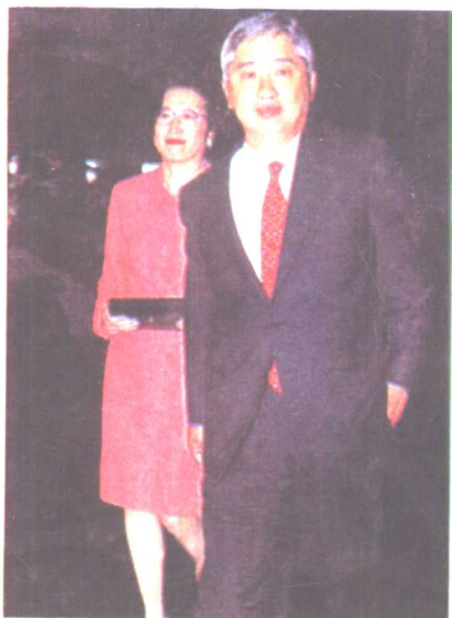
荣智健携夫人出现在酒会中