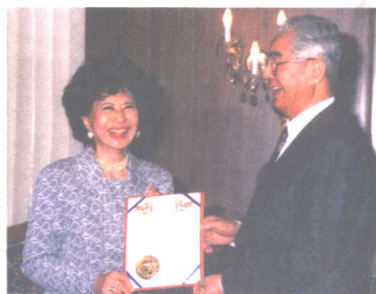
荣毅仁接受美国加利福尼亚州政府授予的加州荣誉公民证书。