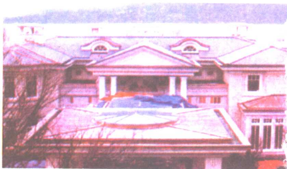
荣智健在加拿大的豪宅