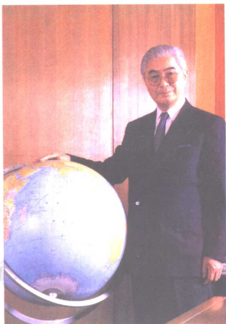
国家副主席荣毅仁