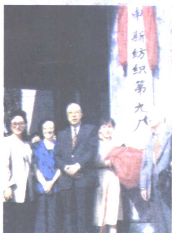
庆祝恢复申新纺织第九厂