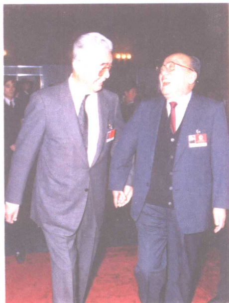
荣毅仁与原国家主席杨尚昆在七届全国人大会议上。