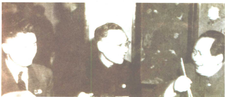
荣毅仁与毛泽东、黄家驷在一起