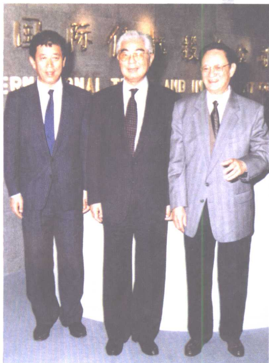
荣毅仁担任国家副主席后与中信公司新任董事长魏鸣一、总经理王军合影。