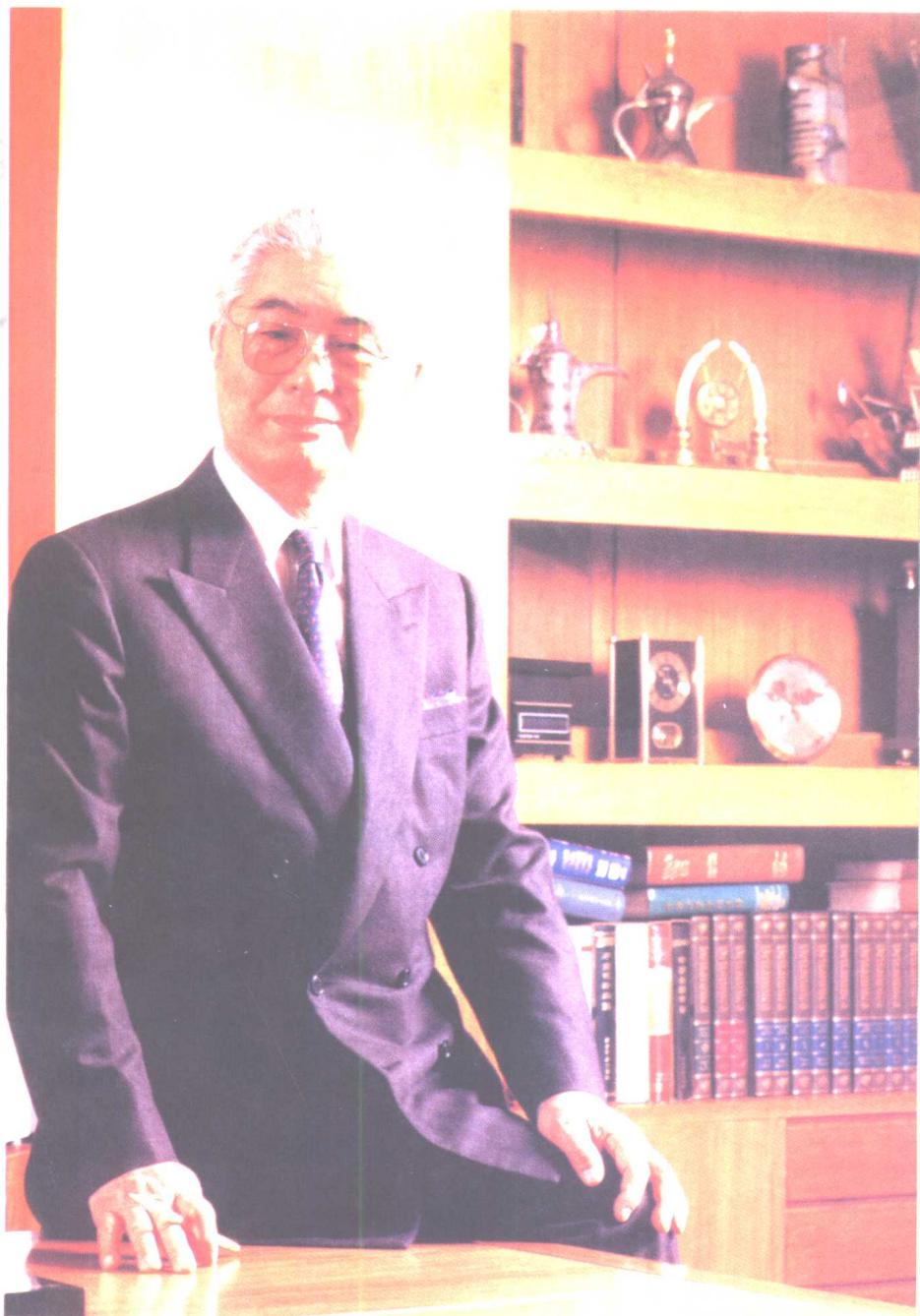
紅色资本家：榮毅仁