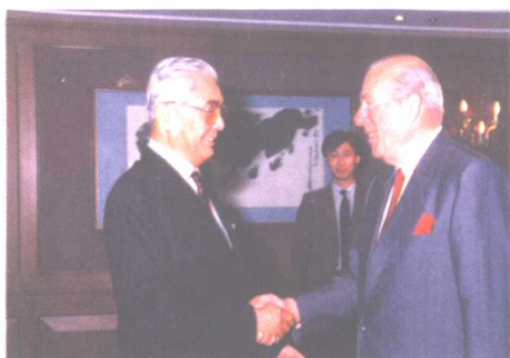
荣毅仁会见美国前国务卿舒尔茨。