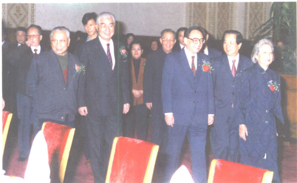
荣毅仁邀请党和国家领导人出席中信公司的新年招待会。图为丁关根（右三）、钱其琛（右二）、彭冲（左三）、谷牧（左二）等与荣毅仁、夫人杨鉴清（右一）一起入场。