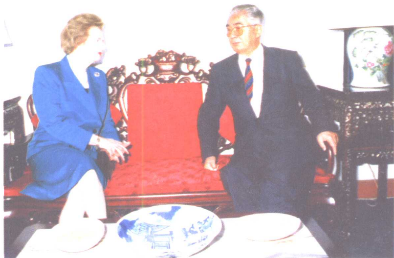
荣毅仁与原英国首相撒切尔夫人在会见中。