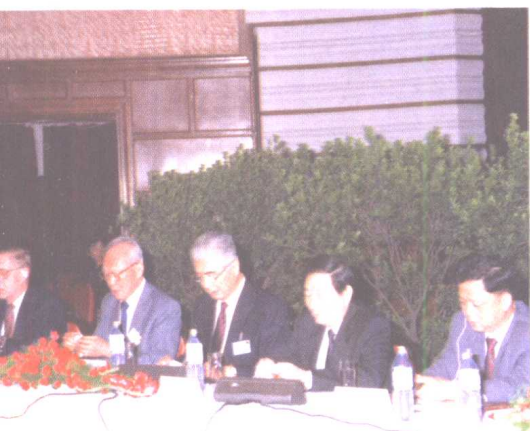
荣毅仁主持中信国际经济论坛，国务院副总理朱镕基（右二）、新加坡内阁资政李光耀（左二）等中外政要参加了这次论坛。