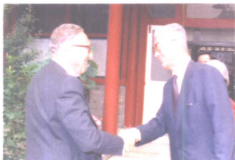
荣毅仁在家中接见来访的美国前国务卿基辛格。