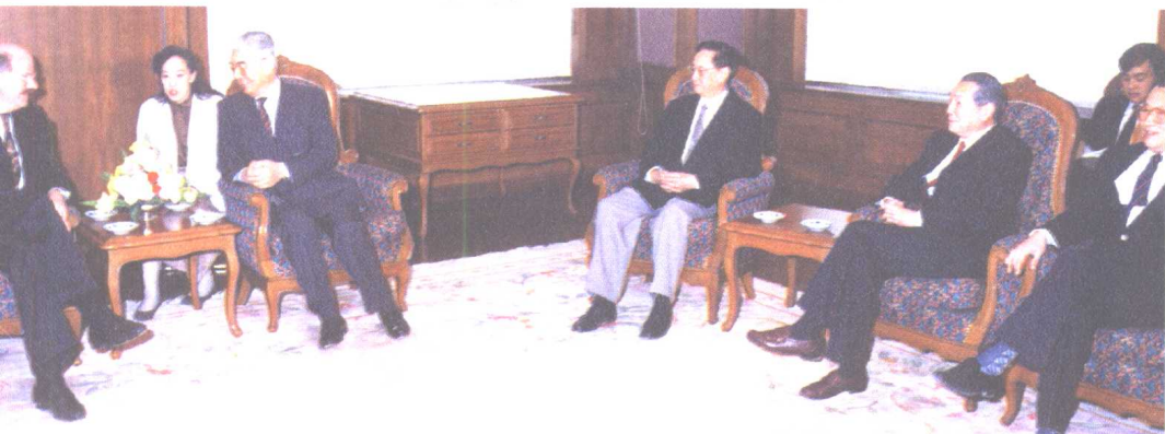
荣毅仁与中信公司领导一起会见加拿大不列颠哥伦比亚省省长麦克·哈克特。