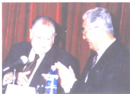
荣毅仁与智利总统在中智经济研讨会上。