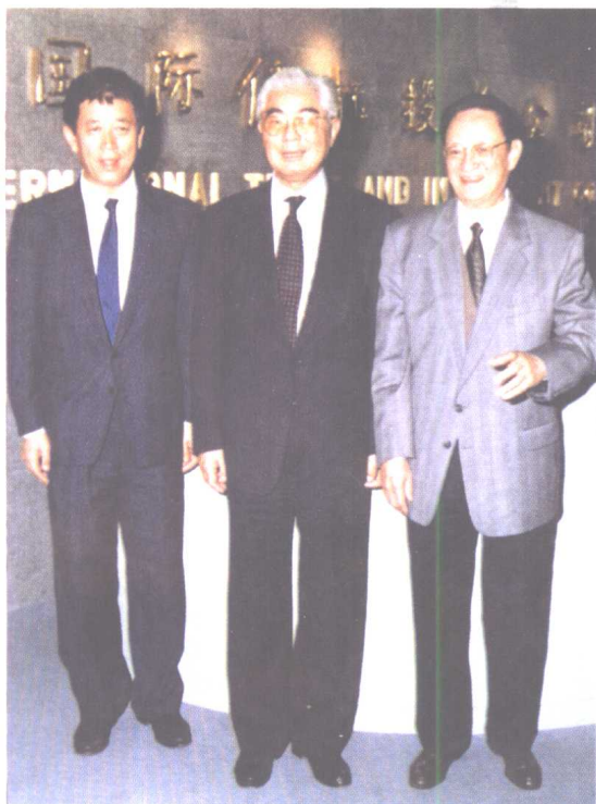
荣毅仁担任国家副主席后与中信公司新任董事长魏鸣一、总经理王军合影。