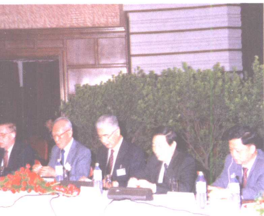
荣毅仁主持中信国际经济论坛，国务院副总理朱镕基（右二）、新加坡内阁资政李光耀（左二）等中外政要参加了这次论坛。