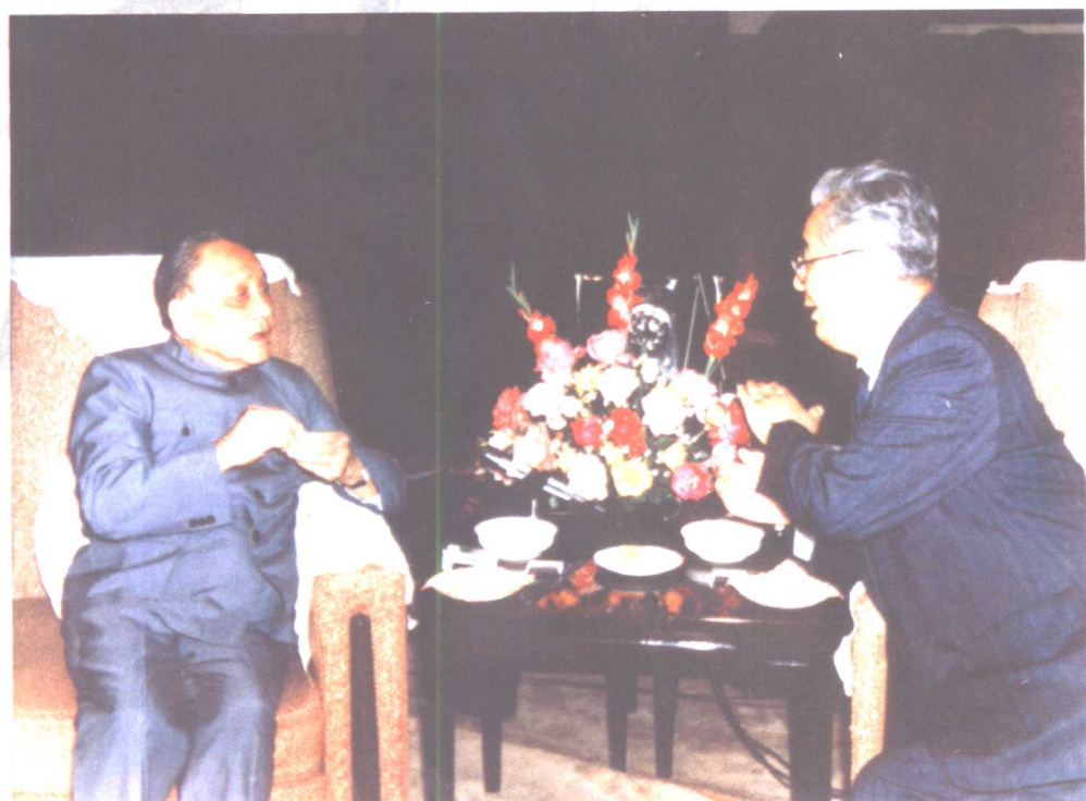
一九八八年五月，邓小平向荣毅仁询问中信公司业务发展情况