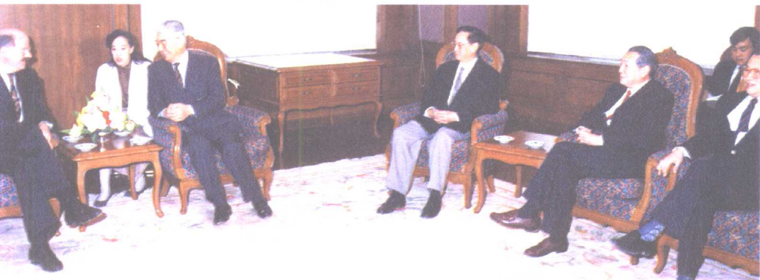
荣毅仁与中信公司领导一起会见加拿大不列颠哥伦比亚省长麦克·哈克特。