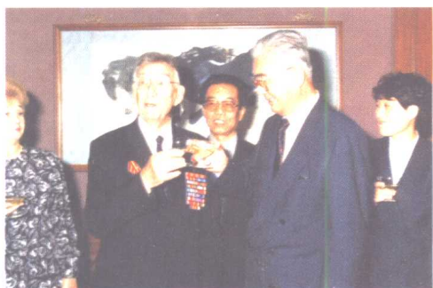
荣毅仁与原苏联部长会议第一副主席 阿尔希波夫在碰杯。