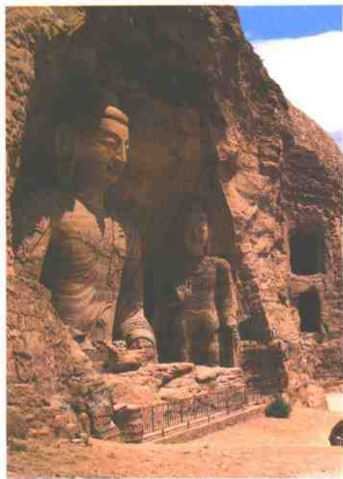
2 山西省大同云冈石窟露天大佛 (北魏)