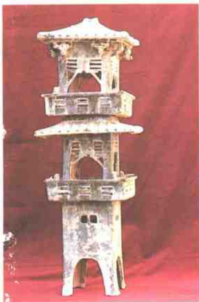
1 山西省芮城县汉代陶楼