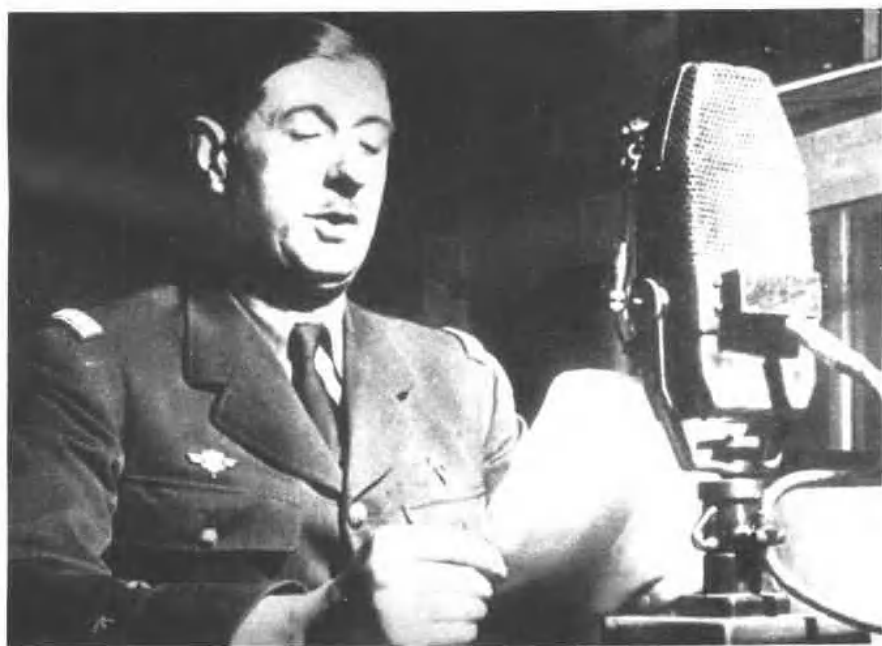
国家存亡,匹夫有责;“六一八”演说