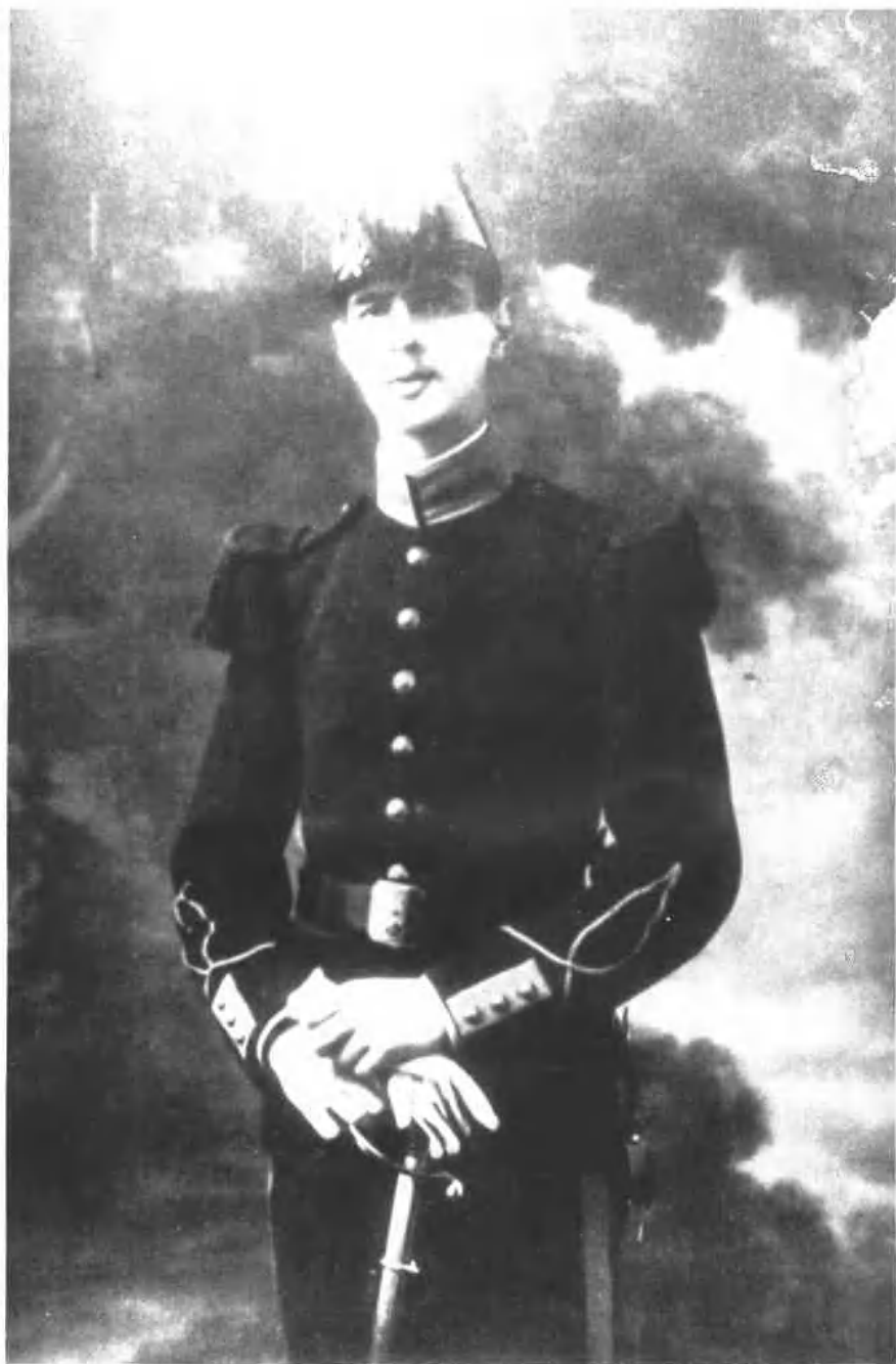
意气方遒：青年戴高乐