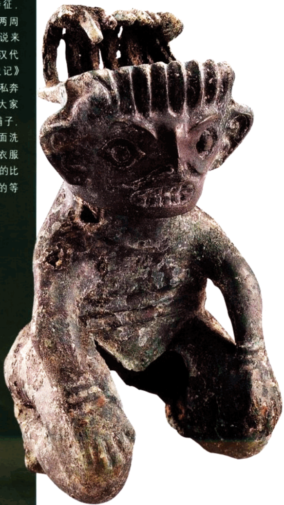
青铜跪坐人像 高14.6公分

跪坐人像是一个奴隶的形象，出土于一号祭祀坑。所穿的衣服具有中原服饰的特征，右衽长袖短衣，腰部系了两周腰带，下身穿着犊鼻裤。说来也巧，这种穿着竟能和汉代“文君当炉”相联系。《史记》记载，卓文君和司马相如私奔后，没有钱了，只得放下大家闺秀的架子，自己开个酒铺子，穿着犊鼻裤，站在酒肆里面洗碗。青铜大立人像华丽的衣服同跪坐人像寒酸的犊鼻裤的比较，显示出当时服饰出现的等级区分。