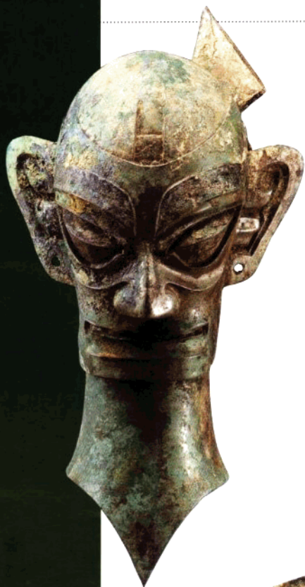
青铜人头像 高49.4公分