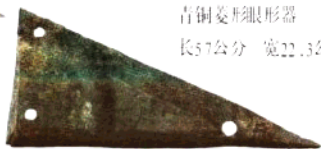
青铜菱形眼形器 长57公分 宽22.3公分