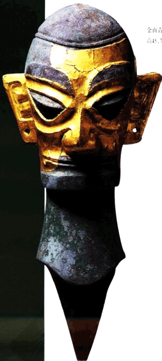
金面青铜人头像 高45.7公分