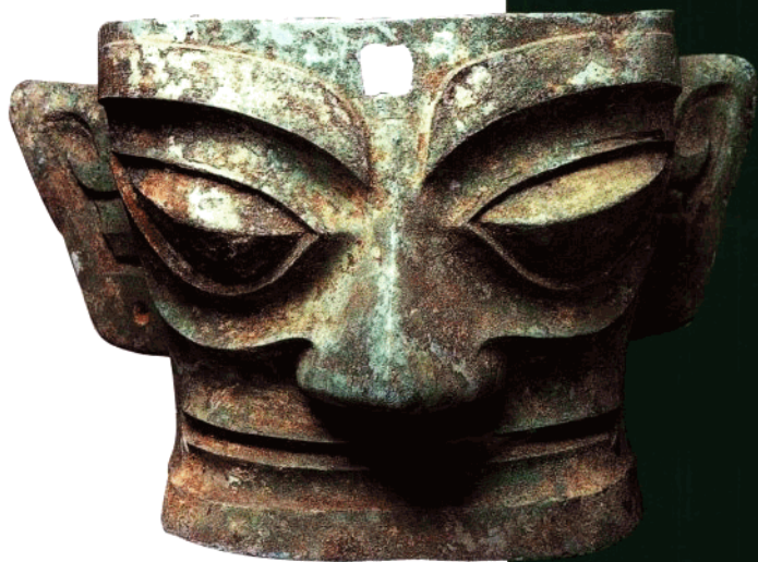
青铜面具 高22.5公分 宽42公分