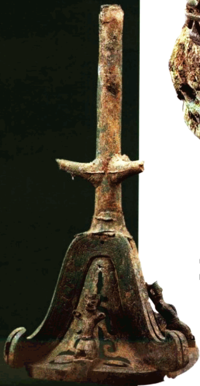
青铜神树座 直径64公分