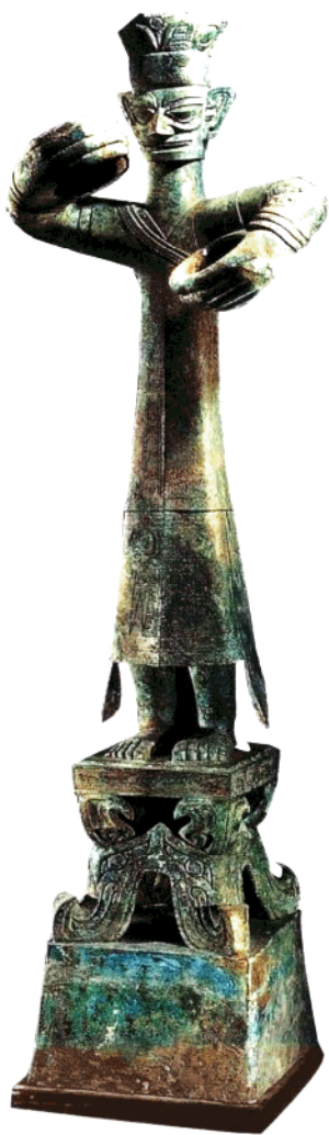
青铜大立人像 高172公分 底座高90公分

大立人像身高172公分，加基座通高262公分，重180公斤。它比我国历史上记载的秦始皇灭六国后铸十二金人早近1000年，比西方赫赫有名的德尔菲御者铜像、宙斯铜像早700年以上，被称为“铜像之王”。