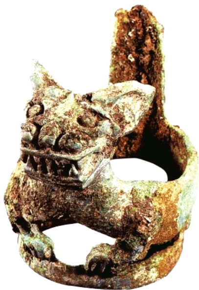
青铜虎形器 直径7.7公分 宽10公分 残高11公分