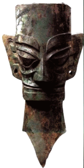
青铜人头像 高41.2公分