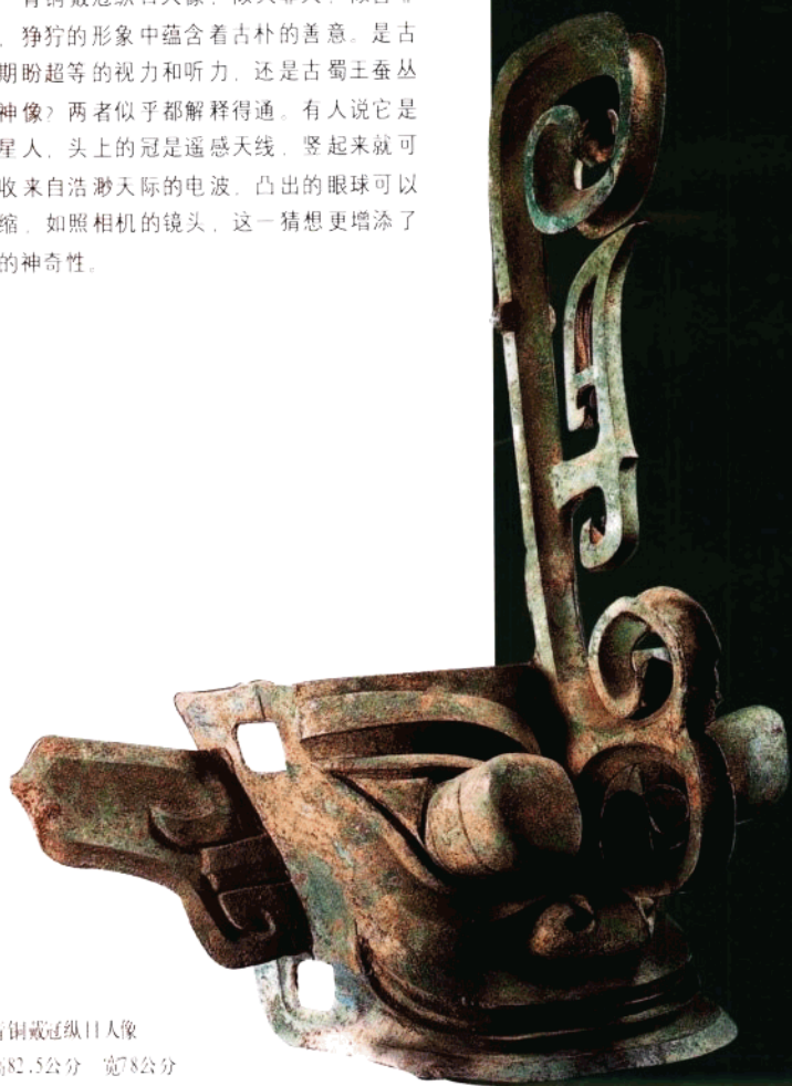
青铜戴冠纵目人像 高82.5公分 宽78公分

青铜戴冠纵目人像，似人非人，似兽非兽，狰狞的形象中蕴含着古朴的善意。是古人期盼超等的视力和听力，还是古蜀王蚕丛的神像？两者似乎都解释得通。有人说它是外星人，头上的冠是遥感天线，竖起来就可接收来自浩瀚天际的电波，凸出的眼球可以伸缩，如照相机的镜头，这一猜想更增添了它的神奇性。