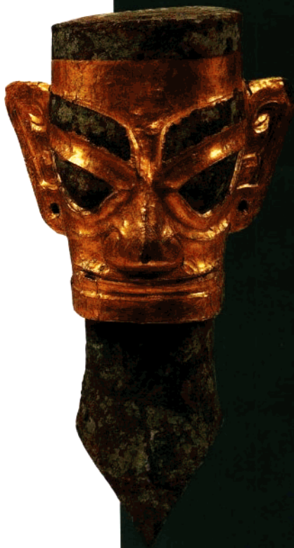
青铜人头像脸上的金箔

现代人有“往某人脸上贴金”的说法，三星堆的古蜀人则真往脸上贴金。戴了金面罩的青铜人头像，金光灿烂气度非凡，犹如天神降临人间。在夏商时代的整个中国范围内，从文献到考古资料，都无此文化因素的来源。而在埃及和西亚却有相似的例证，这是偶然的巧合还是有某种联系？更有趣的是金面罩是用一种枣红色“中国漆”之类的树脂粘在青铜头像上的。