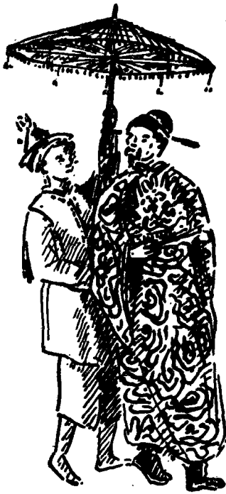
驕橫腐化的越南官吏

爭。阮氏統治者比鄭氏更凶惡，對農民的壓迫更殘酷。最初，南方比北方人口少、土地多，阮氏統治者招募北方的農民來從事開墾，並強迫在戰爭中所獲得的俘虜種地。開墾出來的土地結果都落入大小官僚、地主手中。此外，他們還征收各種名目的租稅。農民還要服勞役、兵役，過着極端痛苦的生活。阮氏的政權掌握在張福巒〔luán〕手中，他是越南歷史上有名的大奸臣，對人