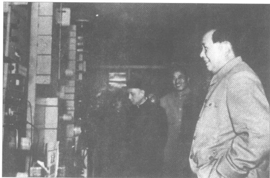
▲1954年10月14日，毛泽东同志在中南海参观我军通信装备展览。