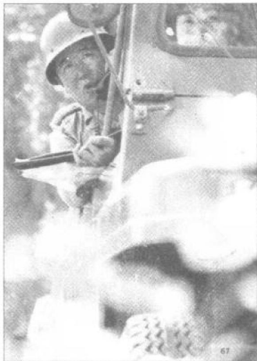
▲开进中使用无线电实施指挥。