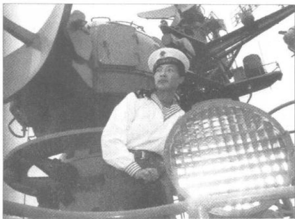
▶ 海军信号兵进行灯光通信。