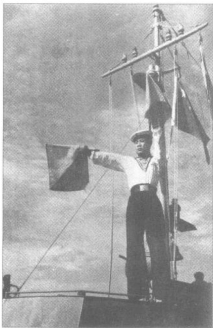
◀ 海军信号兵在舰上进行旗语通信。