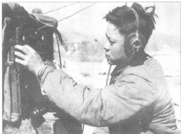
◀剿匪作战中的无线电兵正在联络。