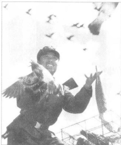
▶ 信鸽也是通信手段之一。