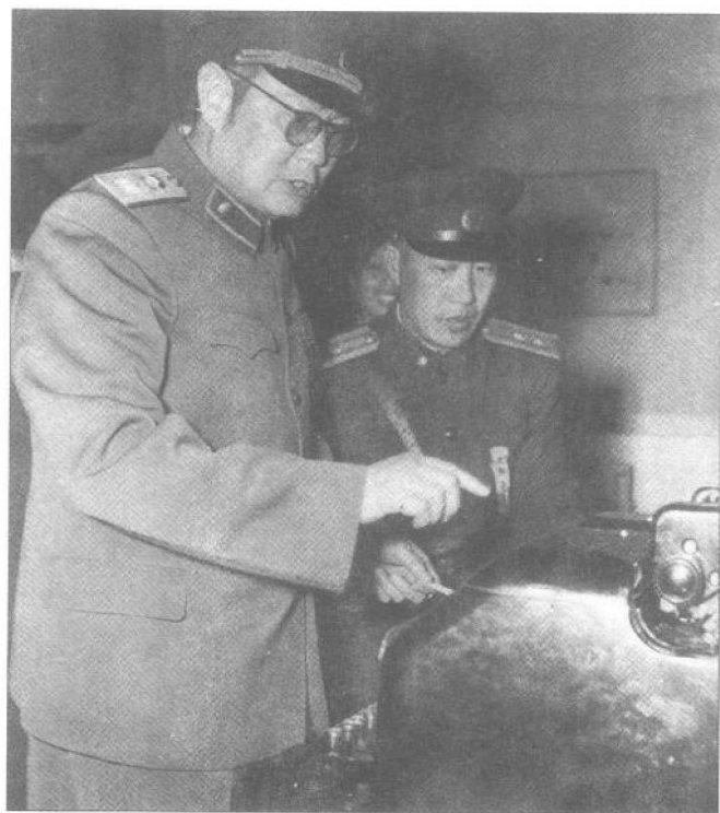
◀1957年4月，叶剑英元帅参观通信装备。