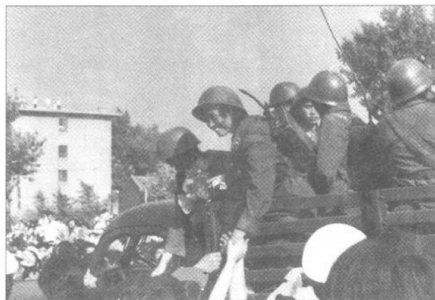
▶参加南疆自卫还击作战的通信兵女战士胜利凯旋。