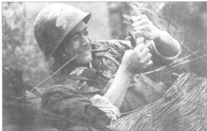
▶某部电话兵冒着炮火抢修线路。