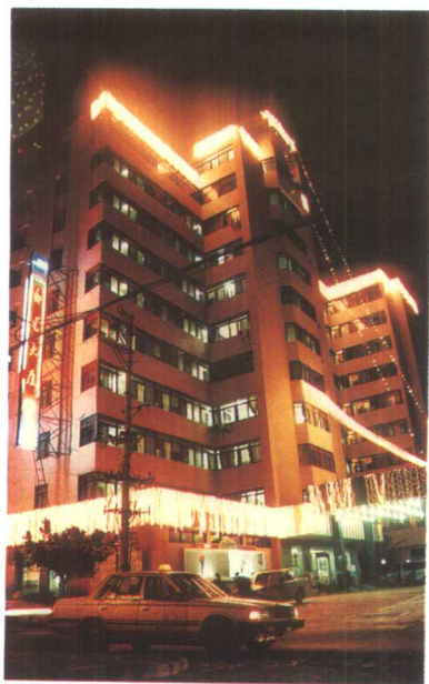
▲1990年建成的海南邮电大厦