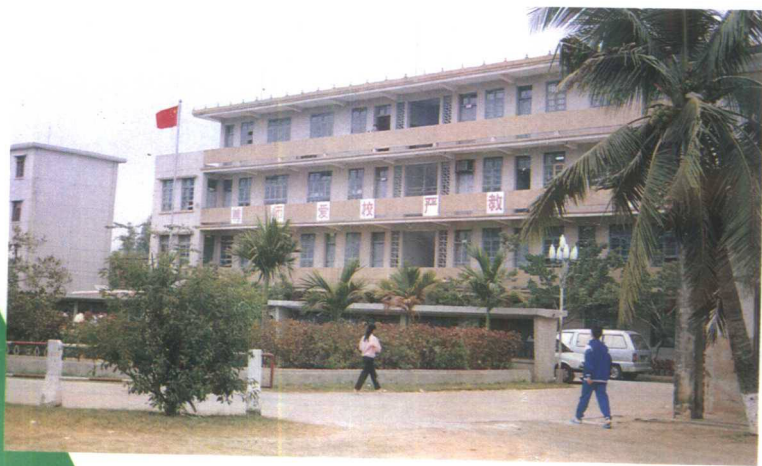
▲初具规模的海南邮电学校,图为教学大楼一角