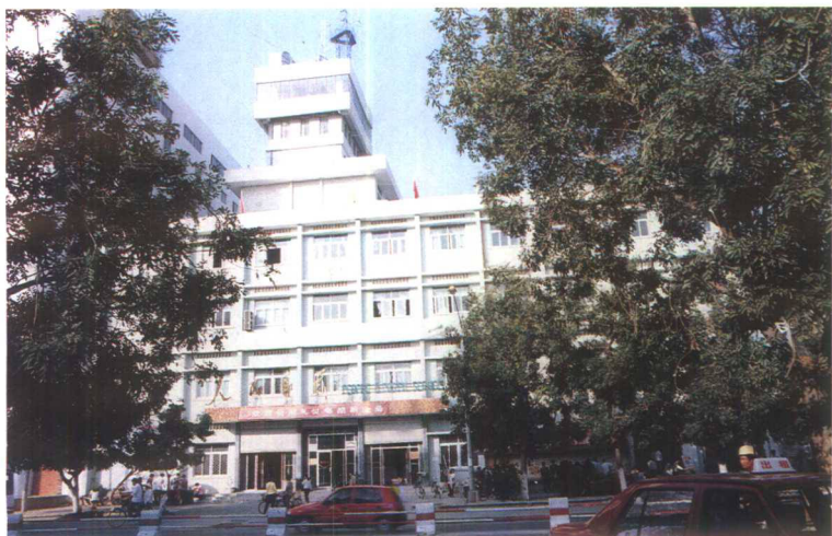
▲新建的三亚市邮电大楼