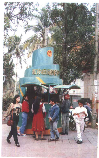
▲90年代的海口市报刊亭