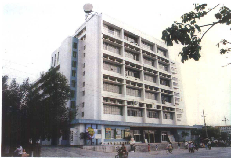
▲新建的通什市邮电大楼