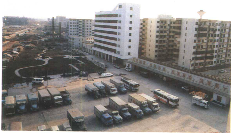
▲1991年兴建的海口市邮局邮运中心