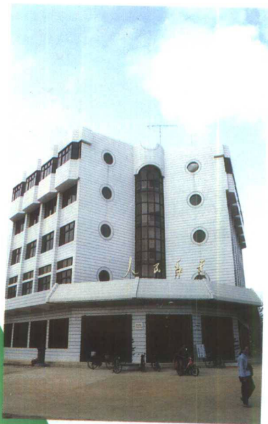
▲90年代新建的万宁县 兴隆邮电支局