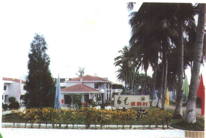
▲1990年建成的海南兴隆邮电度假村