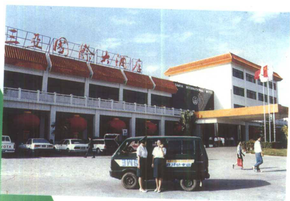
▲三亚市邮电局的特快专递业务