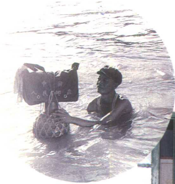
▲60—70年代，邮递员用葫芦装放邮件、报刊泅水投送，被称为“葫芦邮包”。