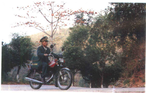
▲邮递员骑摩托车投递报刊邮件