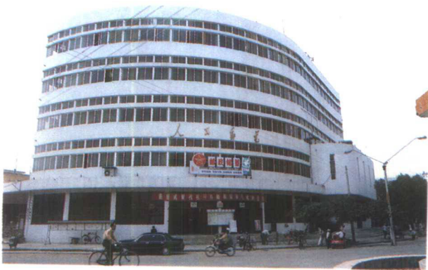
▲新建的万宁县邮电大楼