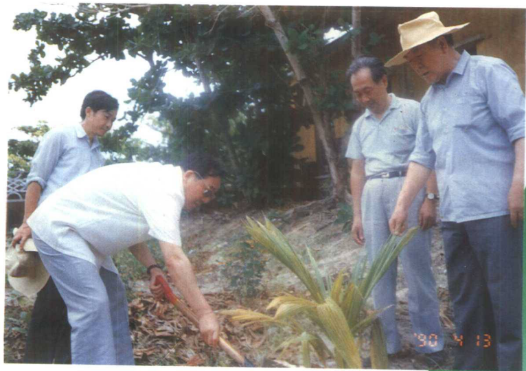
▲1990年4月12日,邮电部副部长吴基传到西沙邮电局视察邮电工作,并慰问邮电职工,亲手种植椰子树。