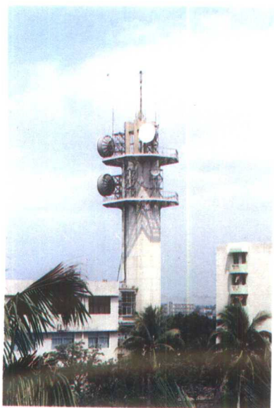
▲80年代兴建的海口微波塔