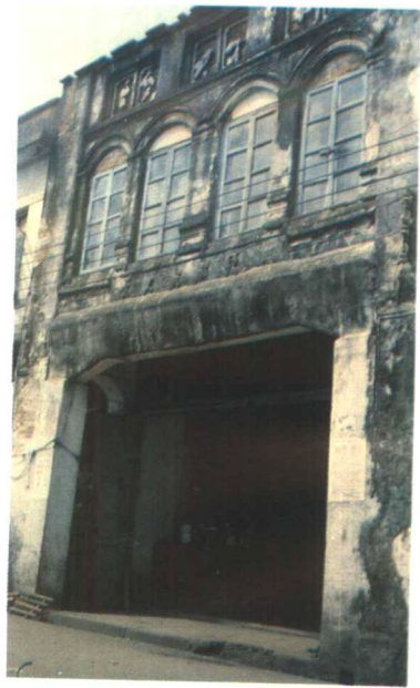
▲昔日万宁县邮电大楼