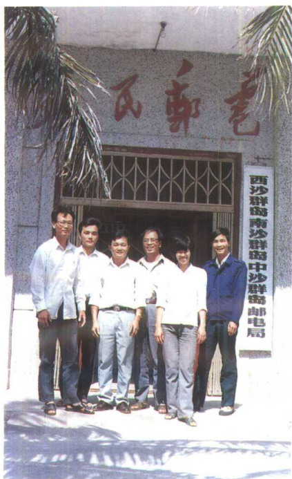
▲西沙群岛南沙群岛中沙群岛邮电局全体职工合影留念