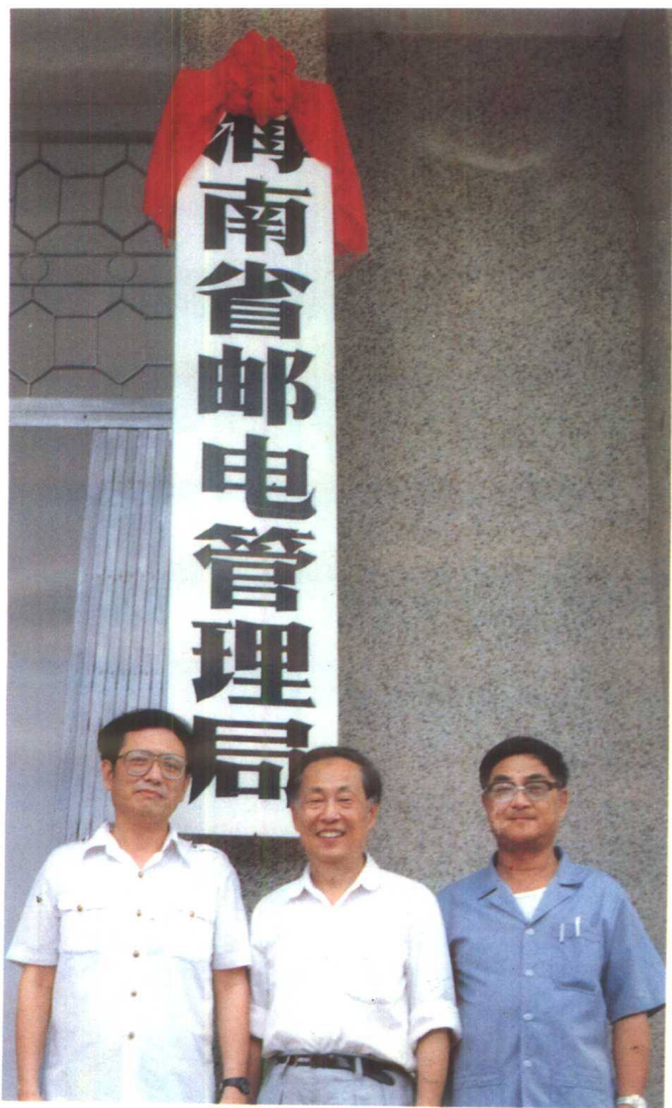
▲1988年4月20日,邮电部批准成立海南省邮电管理局。图为省局首届领导班子成员合影。