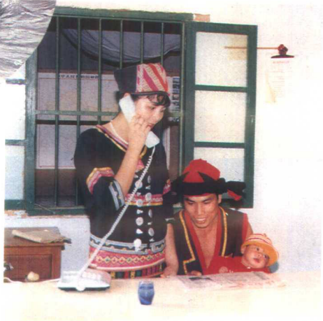
▲自动电话进入黎家苗寨