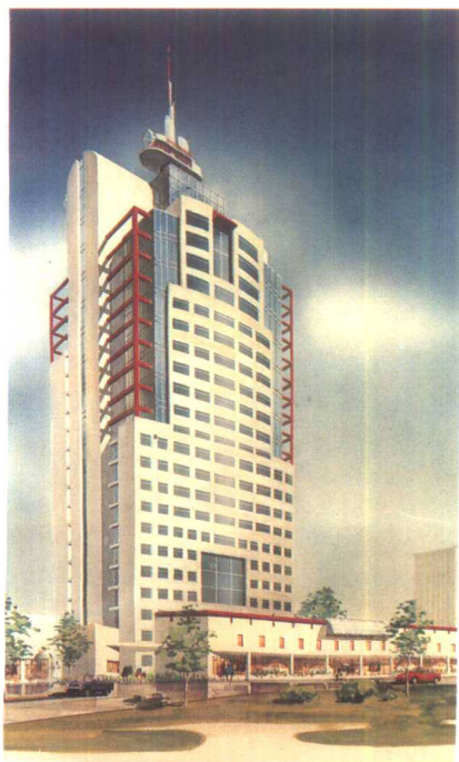
▲正在筹建中的海口市电信枢纽楼(设计图之一)