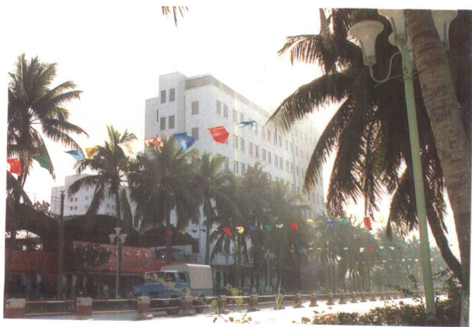
▲新建的海口市白坡电信大楼