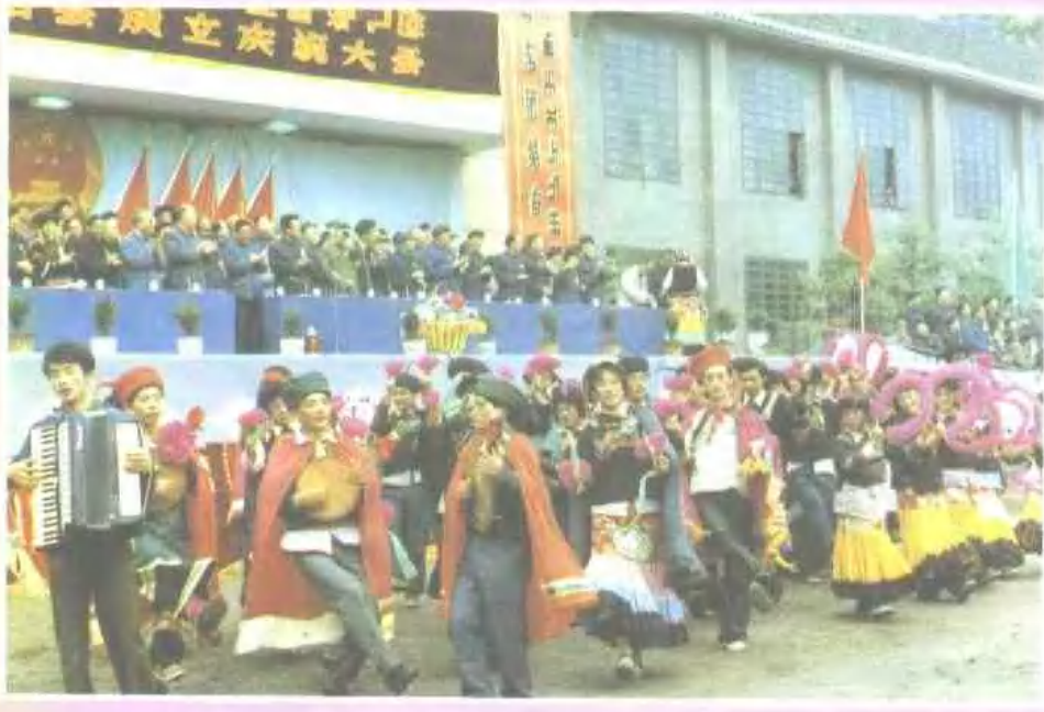
马边彝族自治县 成立庆祝大会