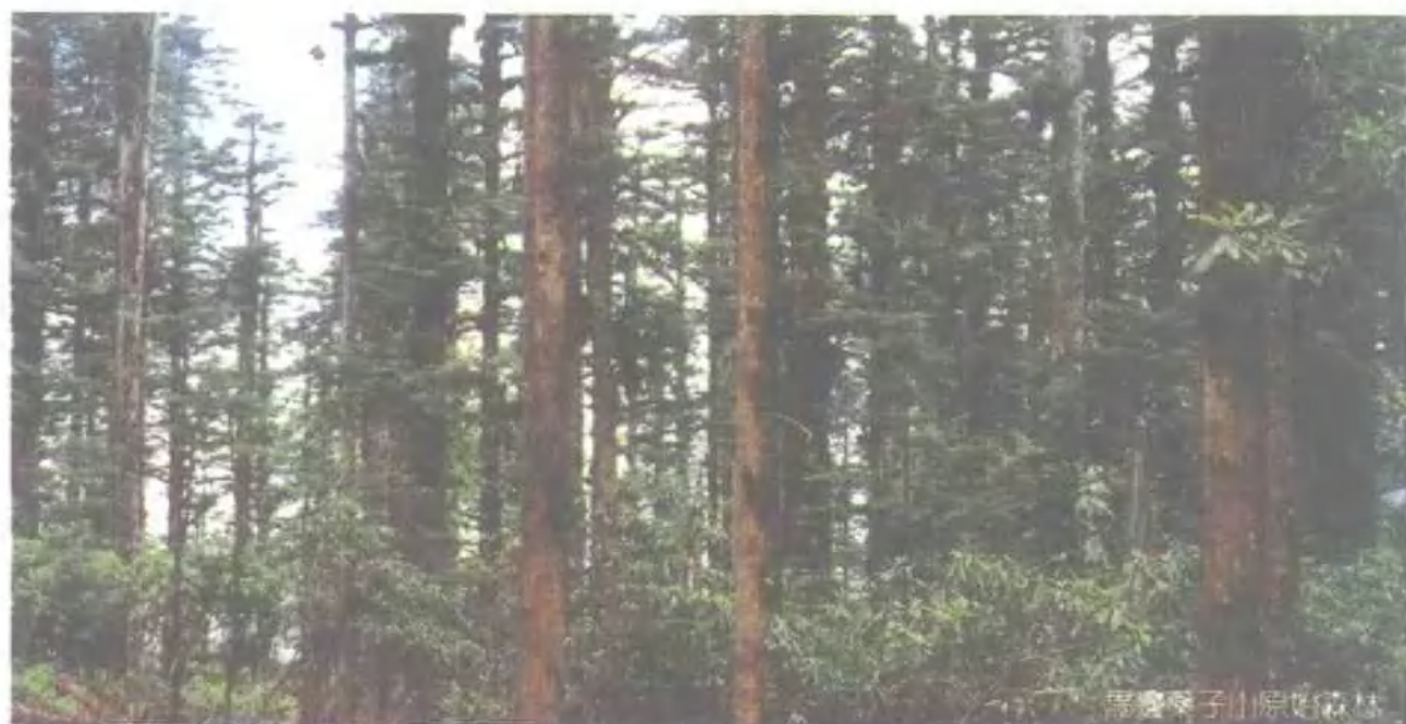
马边栗子山原始森林