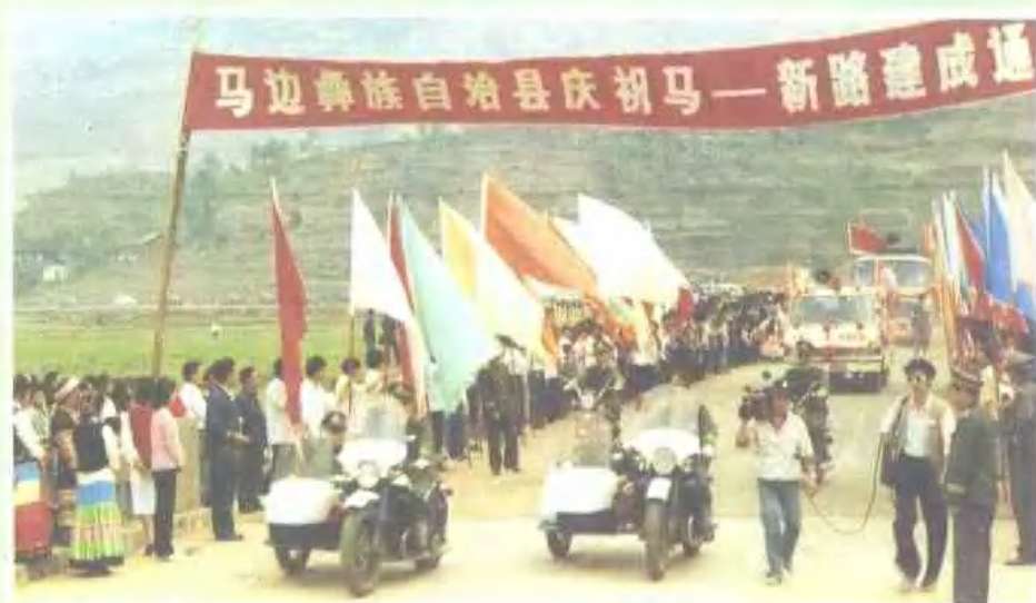
马边—— 新市镇公路通车