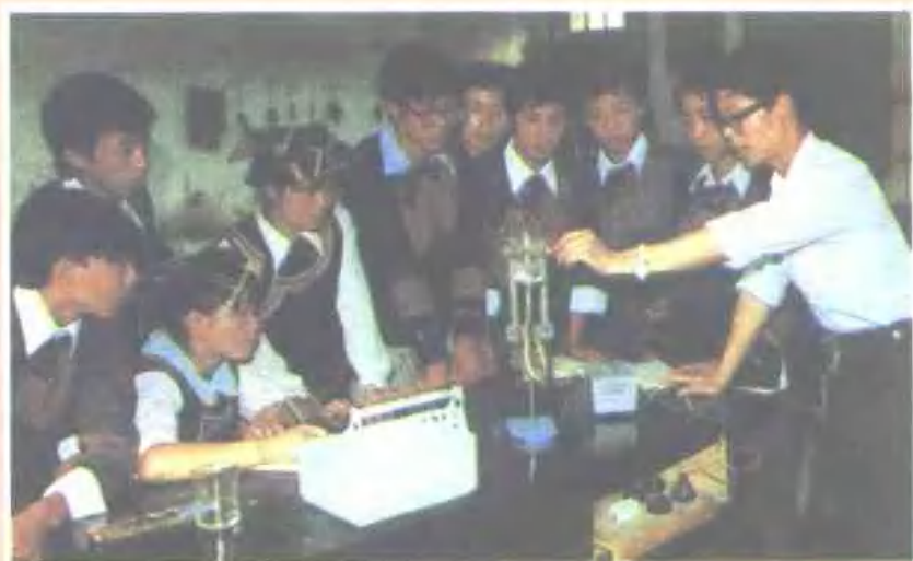
马中学生在上实验课