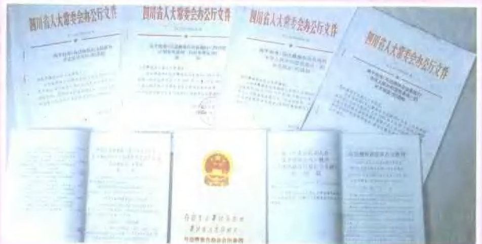
自治县权力机关 制定的地方法规