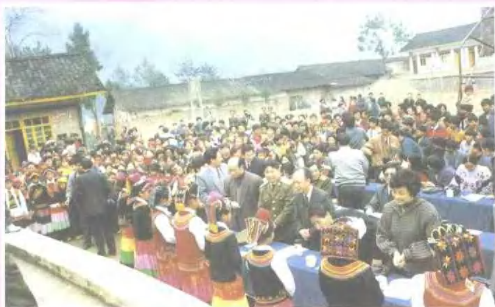
市慰问团赴马边 同庆彝族年节