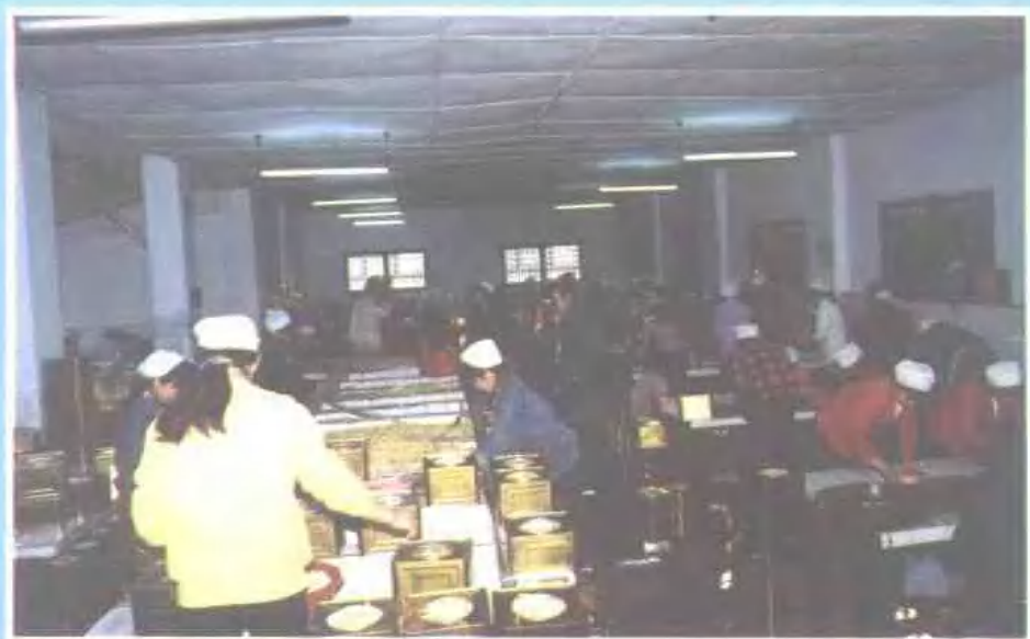
清水笋罐头厂车间