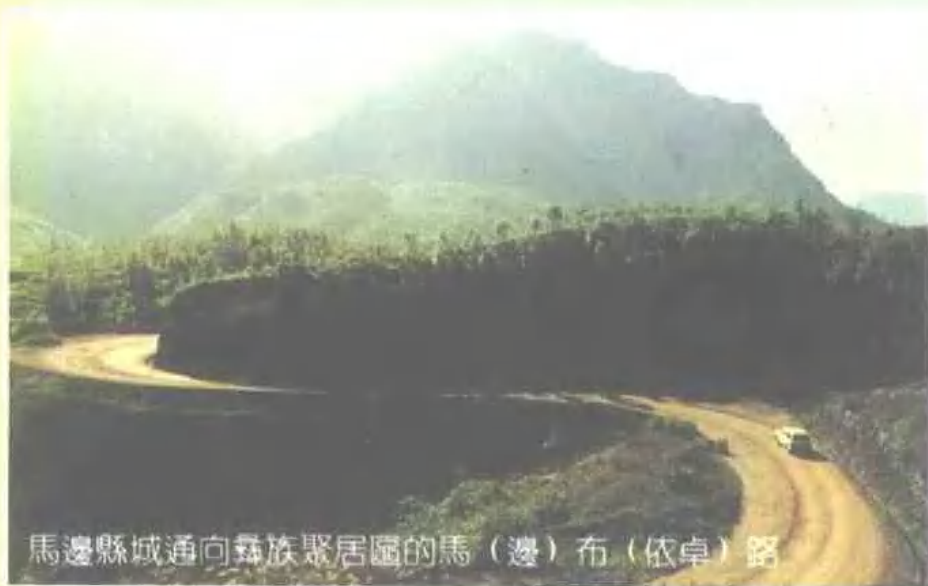
馬邊縣城通向彝族聚居區的馬（邊）布（依卓）路