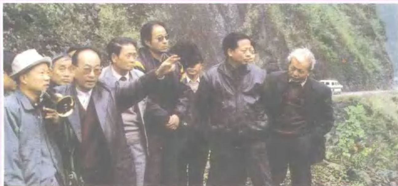
有关专家来马边 考察资源开发