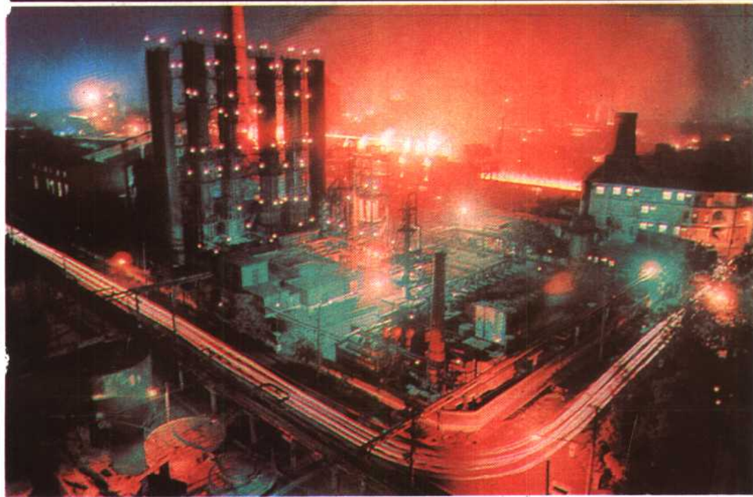
河南省最大的钢铁生产联合企业——安阳钢铁公司