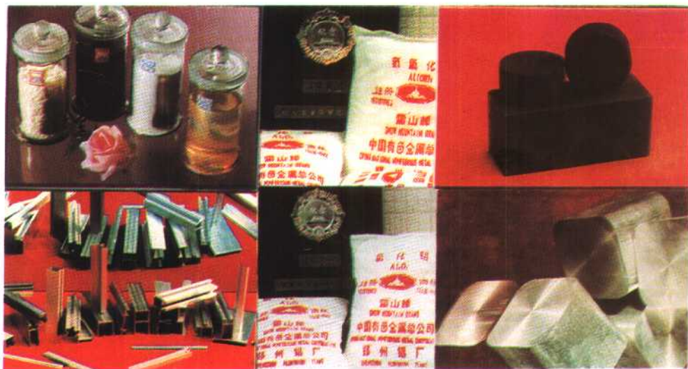
②该厂的部分优质产品