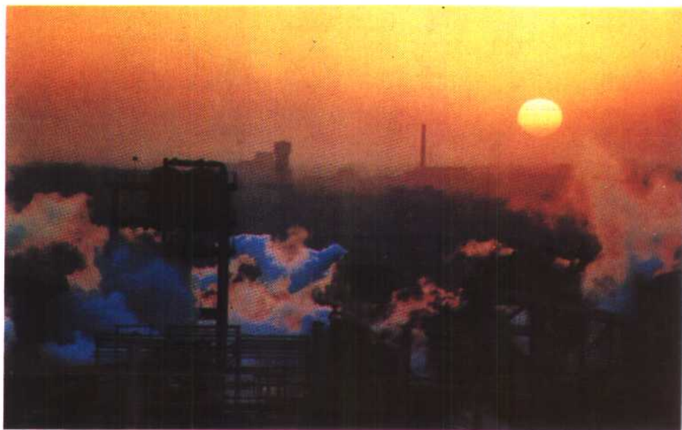
①全国最大的铝冶炼联合企业——郑州铝厂