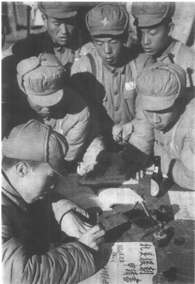
人民解放军全军各部队指战员纷纷写申请，要求赴朝参战。