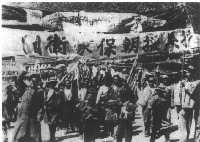
1950年7月，我国各地掀起了群众性的反对美国侵略朝鲜、台湾运动。图为少数民族群众在游行。