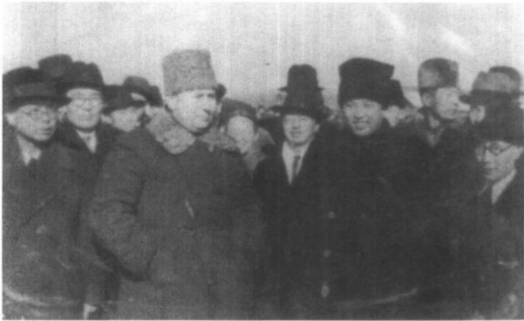
1949年冬，朝鲜民主主义人民共和国首相金日成访问苏联，左为外相朴宪永。此时苏军已从朝鲜北部撤军。

当时，新中国的首要任务是恢复国民经济，希望周边有一个安定的环境，正如毛泽东的秘书胡乔木回忆的那样：“内战刚刚结束，我们国内一大堆问题，我们决不可能鼓动朝鲜发动战争。”（《胡乔木回忆毛泽东》第87页，人民出版社1994年版）