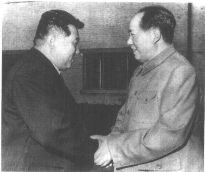
毛泽东主席会见访华的金日成首相。

1950年6月25日，朝鲜爆发了全面内战。三天后，朝鲜人民军攻占了南朝鲜首都汉城，随后向南追击溃逃的南朝鲜军队。