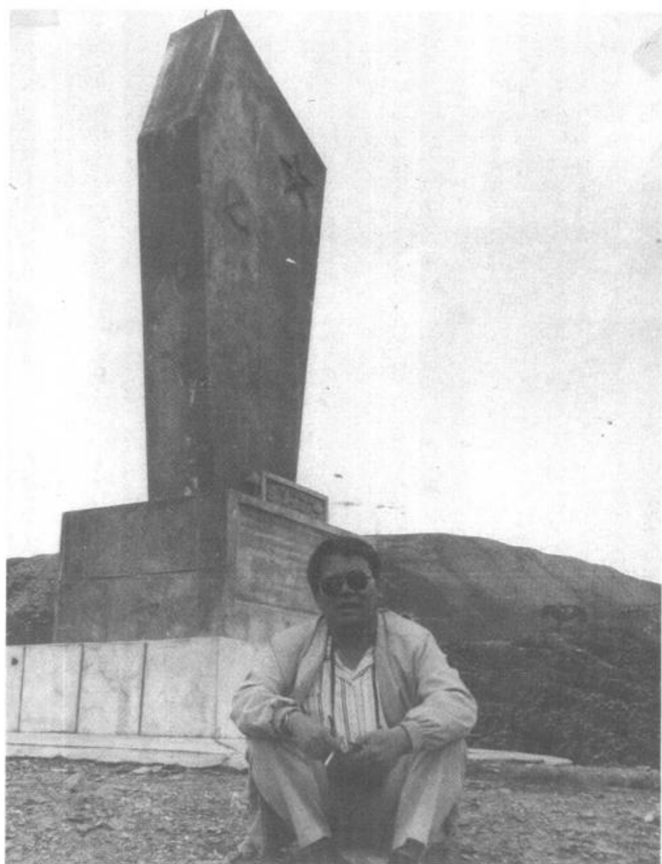
耸立在肃南裕固族自治县 县城南的红军路军纪念塔 (上图)