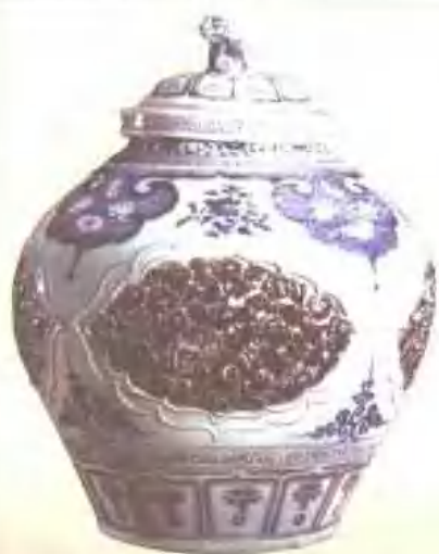
青花釉里红盖罐（元）