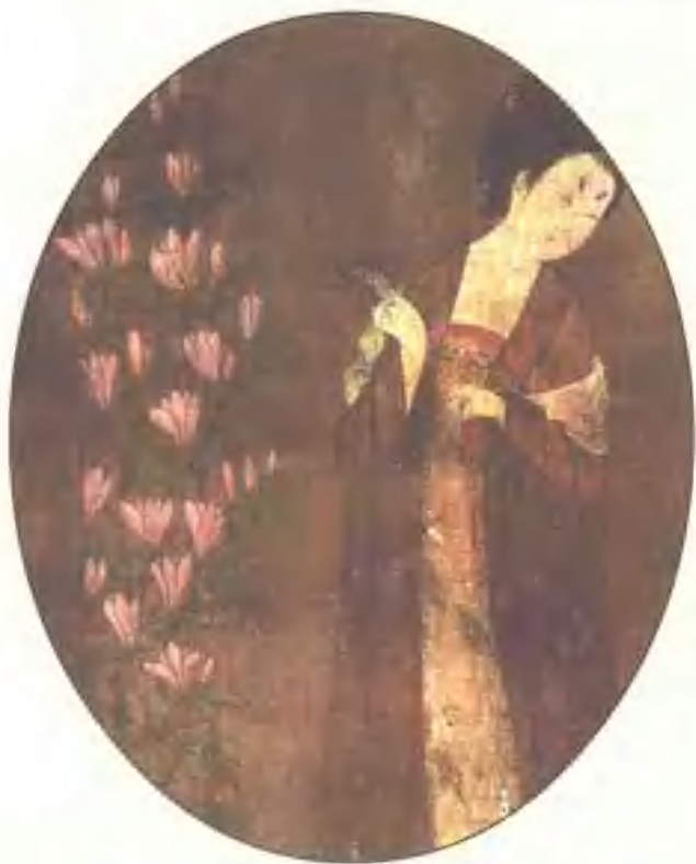
春花仕女图（唐·周昉）