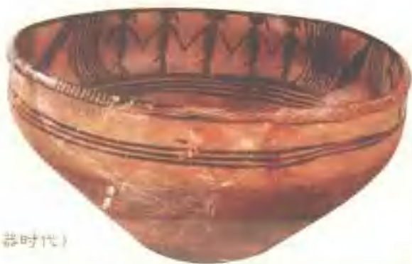
舞蹈纹彩陶碗（新石器时代）