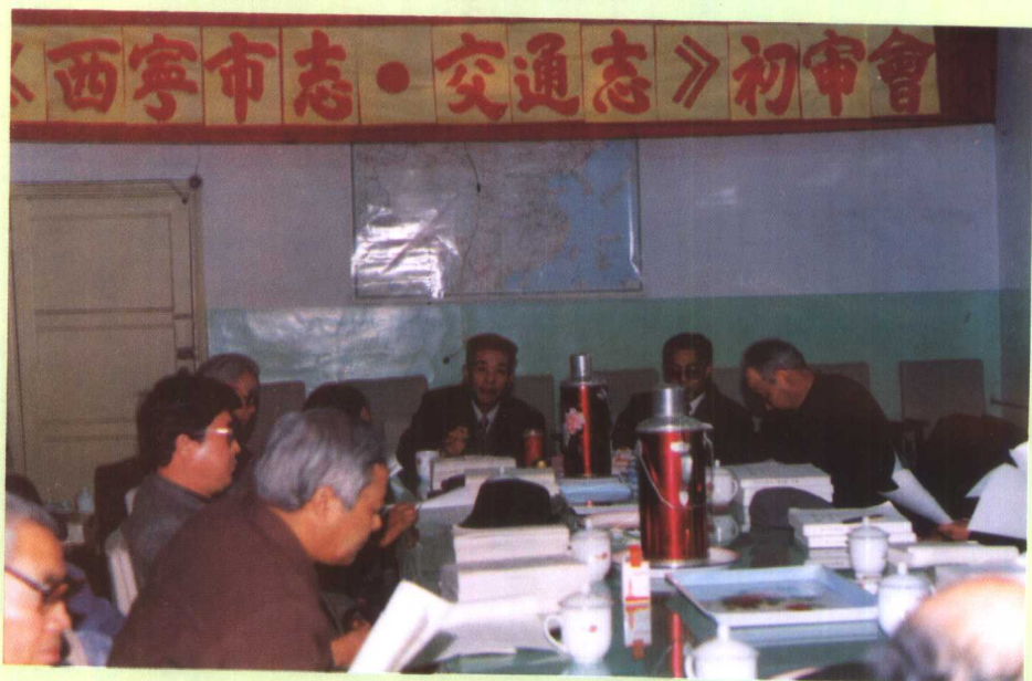
▶《西宁市志·交通志》初审会