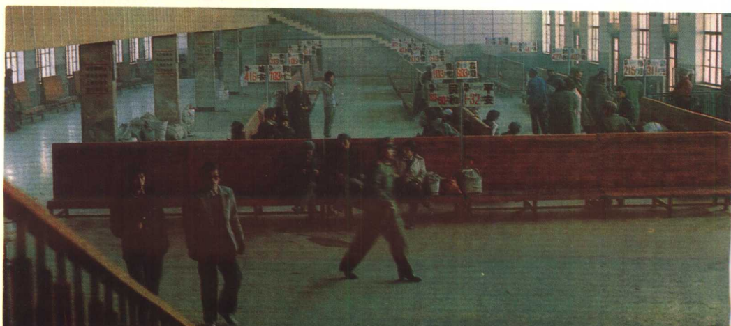
▼西宁汽车站候车厅