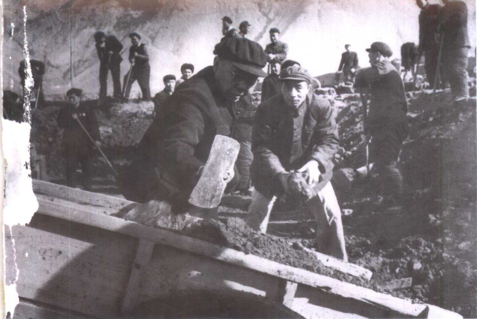
◀ 1958年冬袁任远省长等领导参加西宁火车站修路基劳动