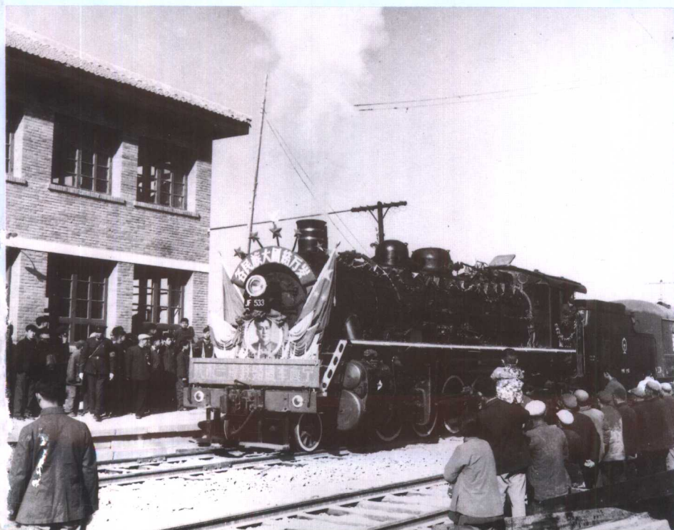
◀ 1959年10月1日 兰青铁路通车西宁