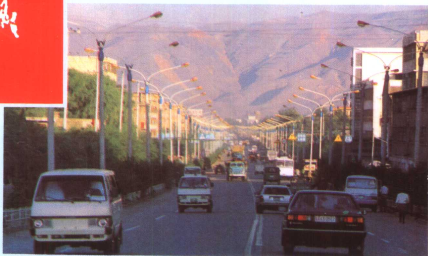
▼▲ 20世纪90年代西宁市城市道路