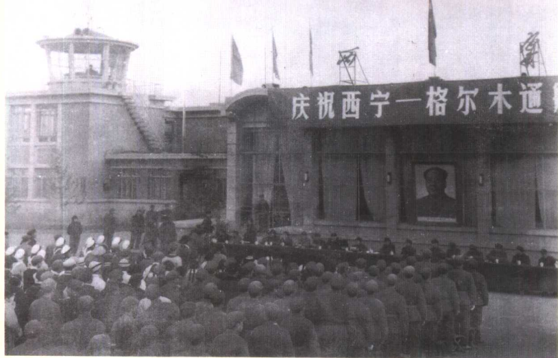
◀ 1974年11月9日西宁—格尔木通航(图为省政府在西宁乐家湾机场举行通航仪式)