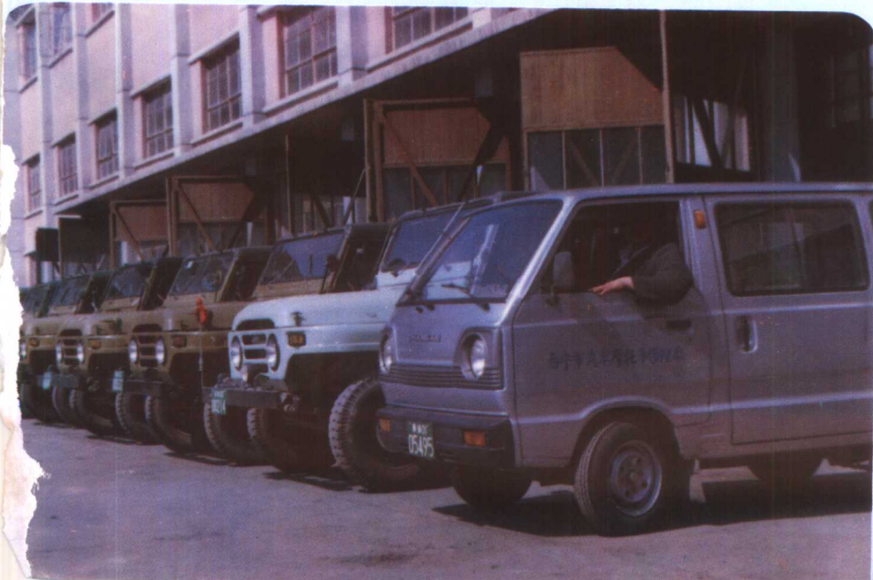
▼ 西宁市汽车摩托车修理厂修复后的车辆