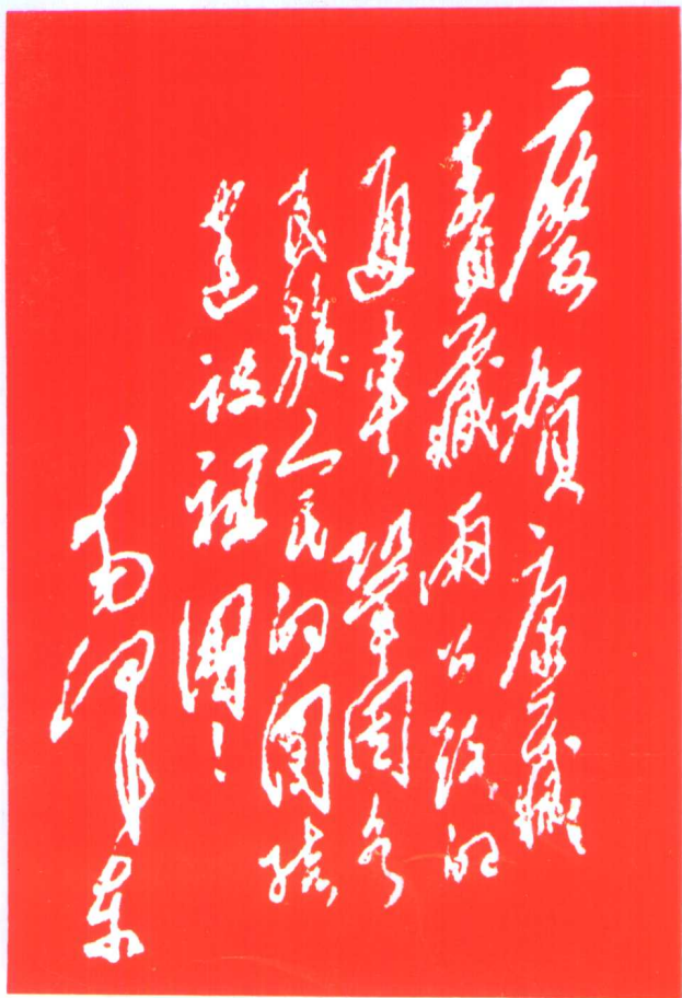
◀1954年12月毛泽东主席为筑路部队和工程技术人员亲笔题写的“庆贺康藏青藏两公路的通车, 巩固各民族的团结, 建设祖国!”的锦旗