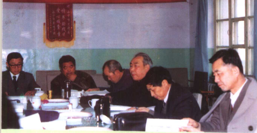
◀《西宁市志·交通志》复 审会