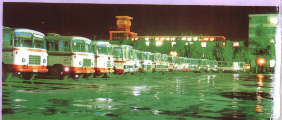
司停车场 ▶ 西宁市公交公