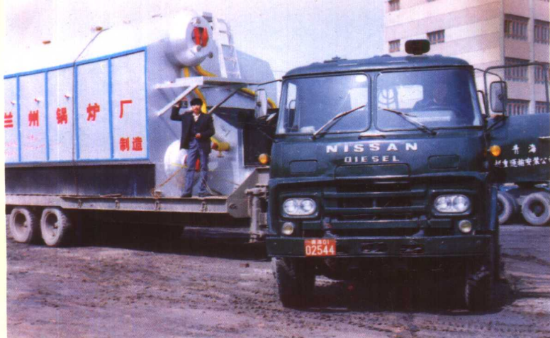
◀青海起重运输安装公司承运大件运输