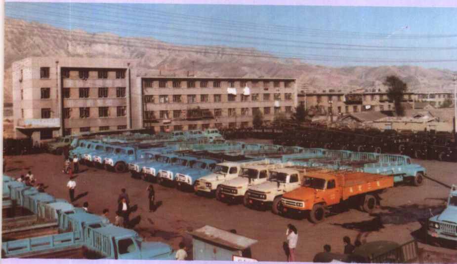
▶ 西宁市运输公司停车场