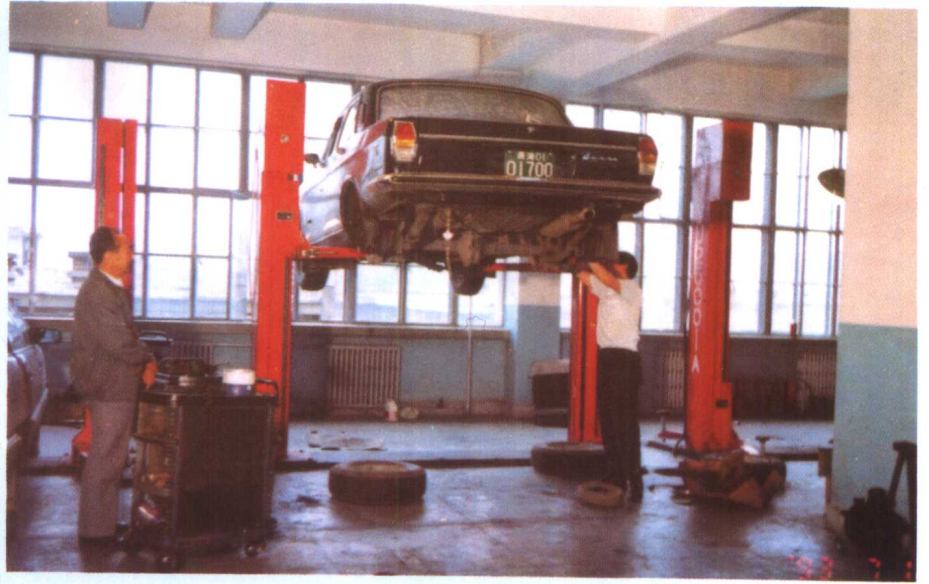
▲ 西宁市小汽车修理厂技工正在检修小车底盘