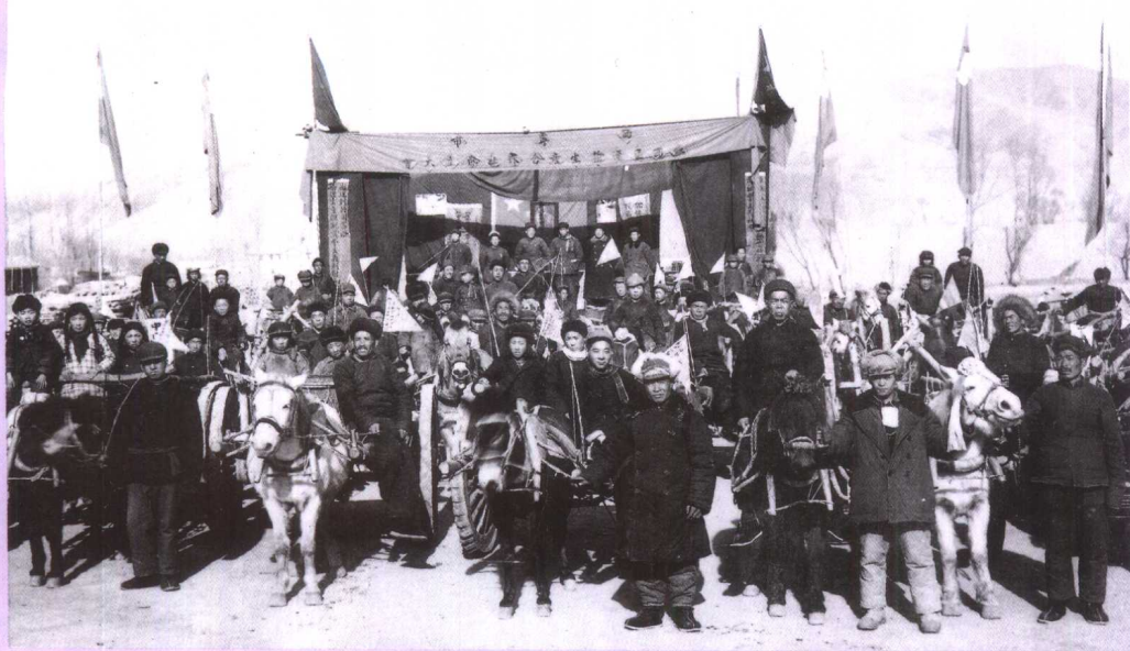
▲西宁地区 20 世纪 50—70 年代民间运输主力马车运输合作社