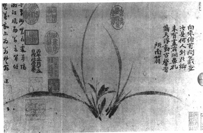
图1 郑思肖 《墨兰图》 页 23.2厘米×55.3厘米 纸本墨笔 美国耶鲁大学艺术陈列馆藏