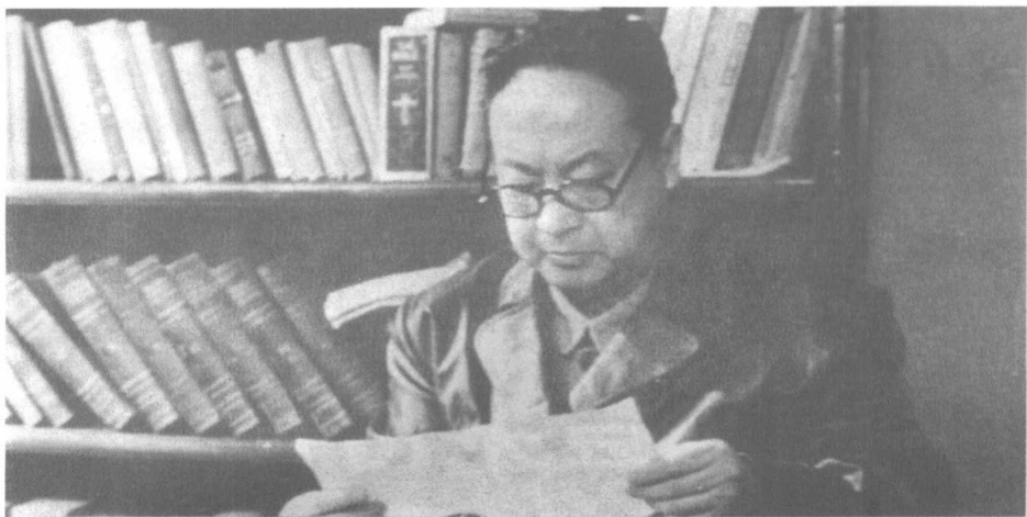
邓小平看完电报后,将电文交给了陈毅司令员。陈毅一边看电报一边说:“不是我们自吹哟,真所谓英雄所见略同。”