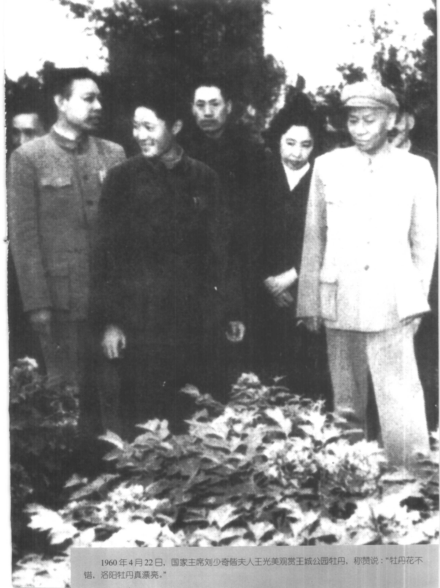
1960年4月22日，国家主席刘少奇偕夫人王光美观赏王城公园牡丹，称赞说：“牡丹花不错，洛阳牡丹真漂亮。”