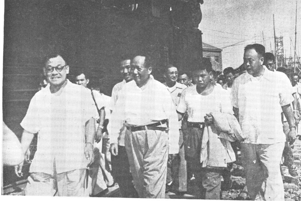
上图：一号高爐建成，毛主席亲自来看出鉄。