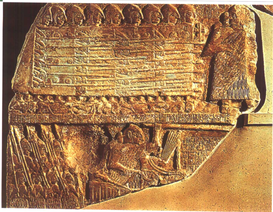
△ 安纳吐姆鬘碑背面，残片（早王朝时期）