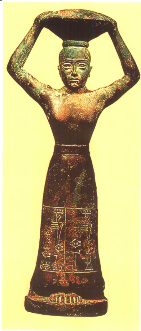
△ 乌尔纳木为尼普尔的恩利尔神庙奠基