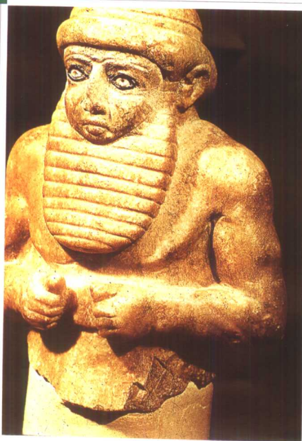
△ 出土于乌鲁克遗址的“祭司王”石雕像