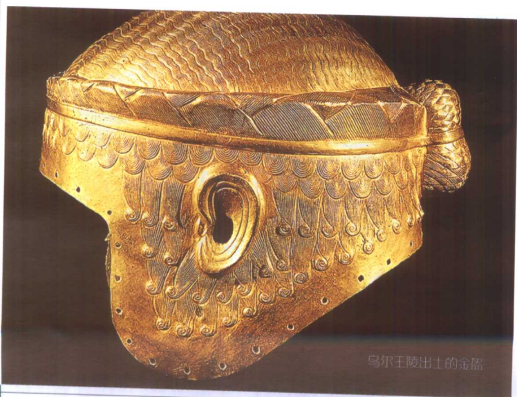
乌尔王陵出土的金盔