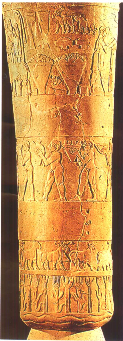
△ 出土于乌鲁克遗址的“乌鲁克石膏瓶”