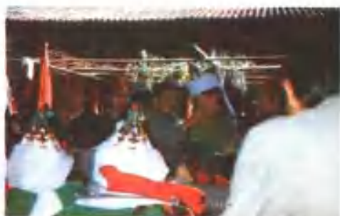
阿文学生毕业典礼