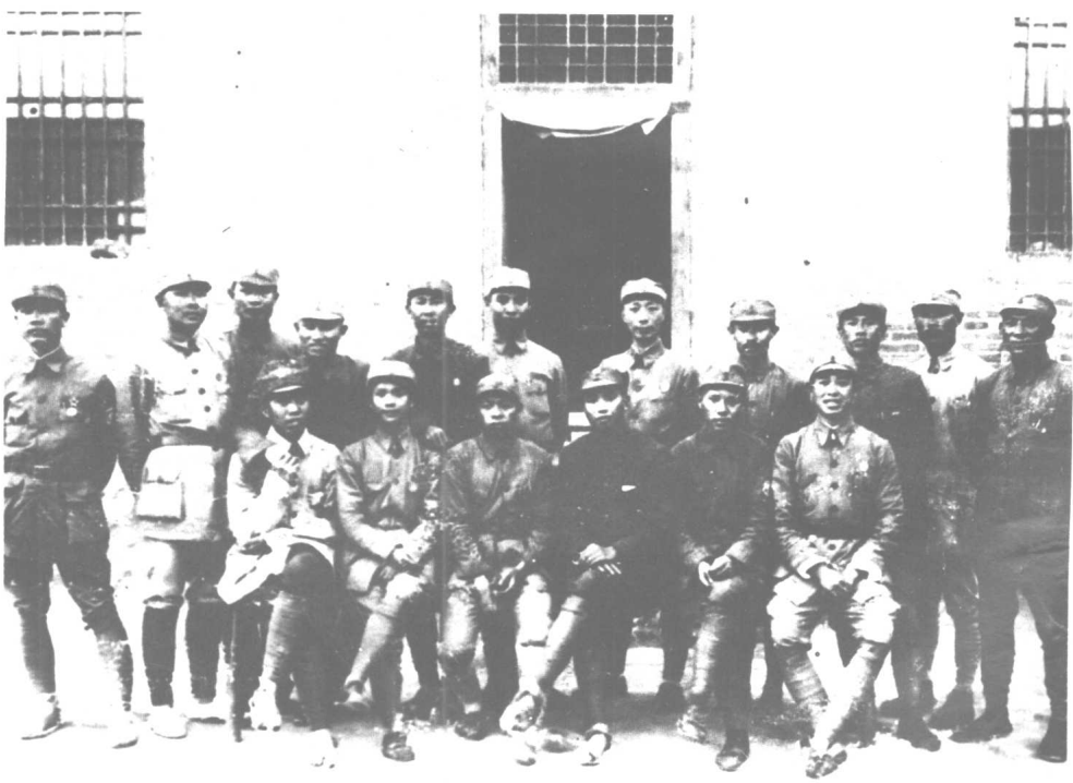
一九三九年于唐县何家庄。前排左起：王震、舒同、罗元发、肖克、朱良才、刘道生；后排左起：陈漫远、赵尔陆、马辉之、程子华、王平、彭真、聂荣臻、关向应、邓华、孙毅、许建国。