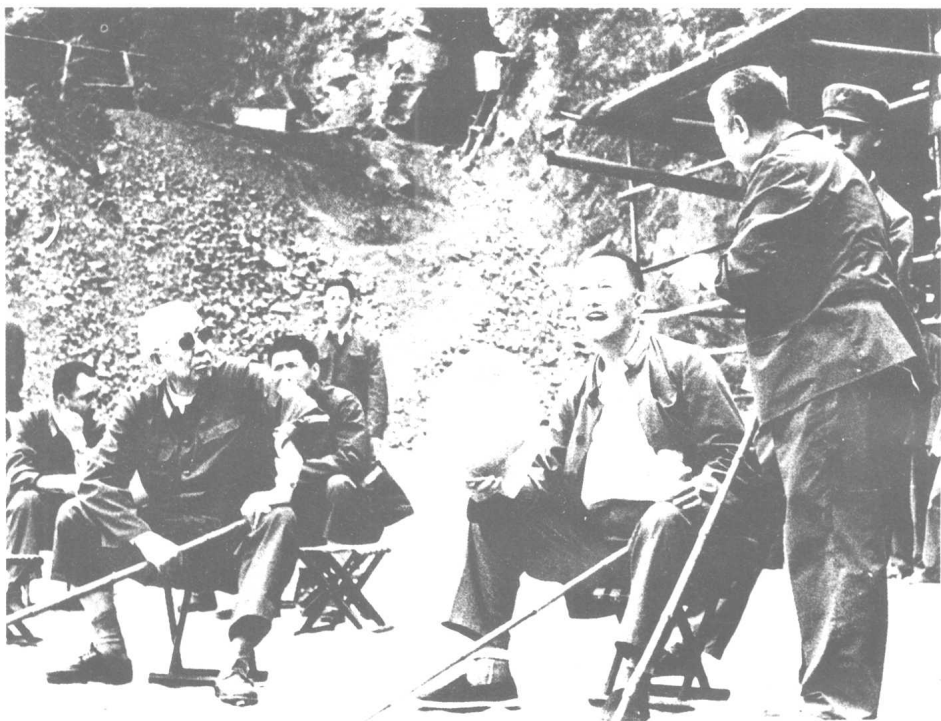
和洪学智部长到部队检查工作。