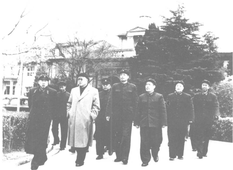
刘伯承元帅到军事学院视察。左起：王平、刘伯承、张震、杜平。