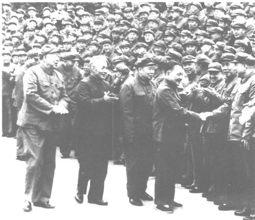
一九七七年，邓小平在武汉接见军区机关干部。 右起：邓小平、杨得志、陈丕显、王平。