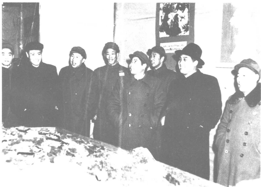
一九五(四年)在朝鲜中国人民志愿军总部。前排右起： 杜平、金日成、杨得志、王平。