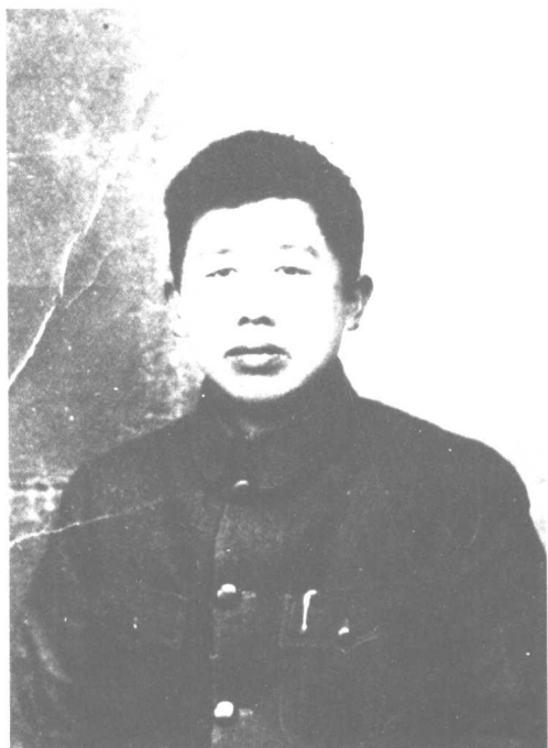
一九三六年于延安。