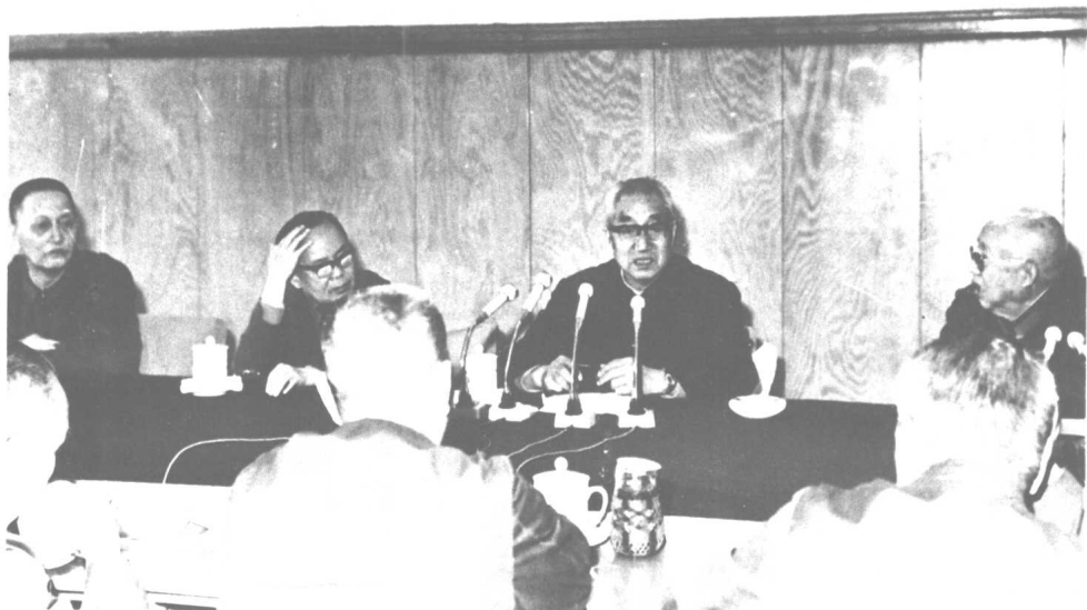
一九八〇年，徐向前元帅出席全军后勤会议。 左起：洪学智、韦国清、徐向前、王平。