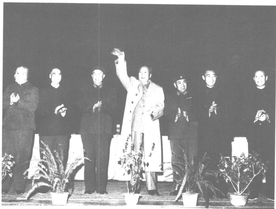
一九六二年，毛泽东主席在南京接见军、地干部。左起：惠浴宇、刘顺元、王平、毛泽东、许世友、江渭清、陈光。