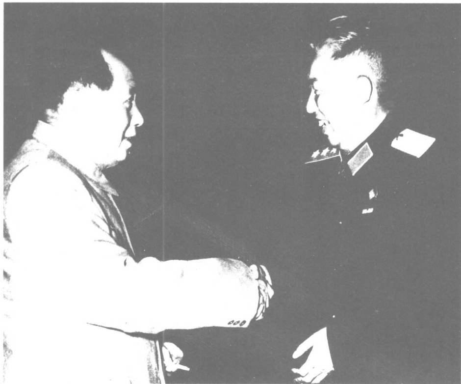
志愿军回国后，受到毛泽东主席接见。