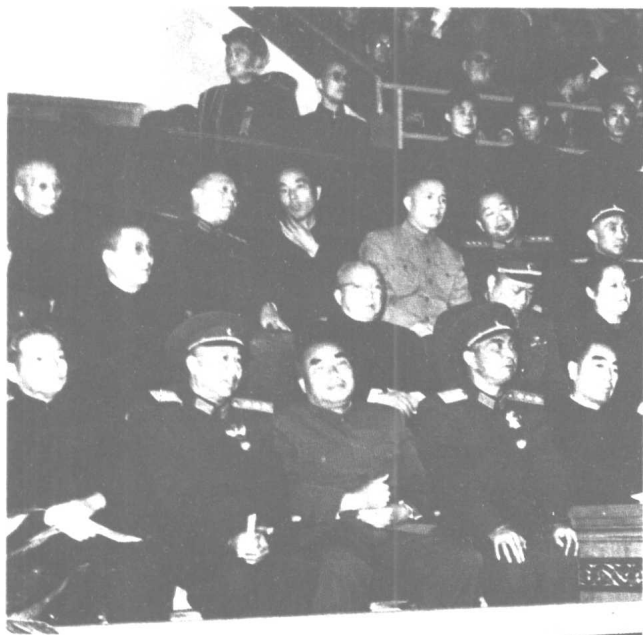
一九五八年十月， 在首都人民欢迎志愿军 回国大会上。前排左起： 陈云、王平、朱德、杨 勇、周恩来。