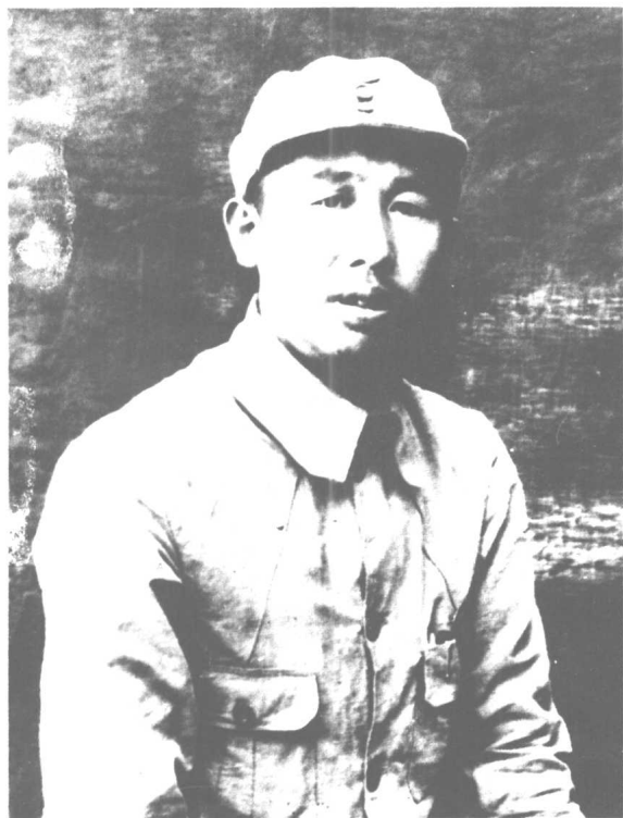
一九三七年于曲阳县灵山。