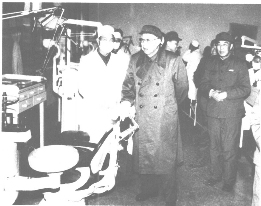
一九八三年，在第四军医大学口腔医院检查工作。