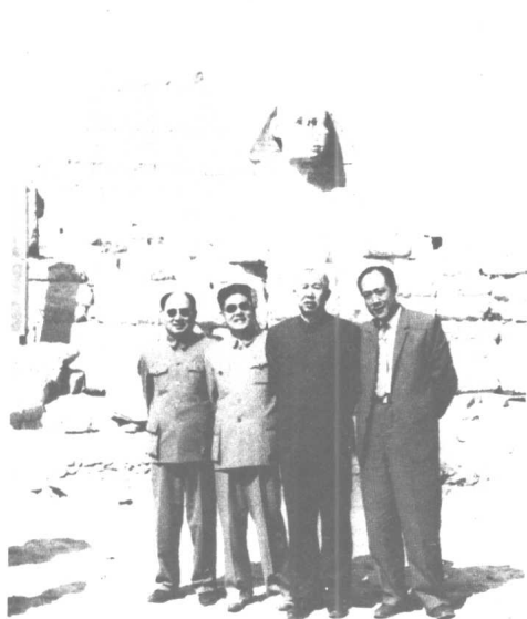
一九六五年访问埃及留影。