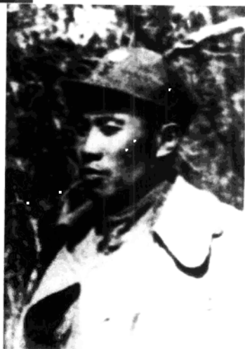
八路军第四纵 队第四旅、新四军第四 师第十旅旅长刘震