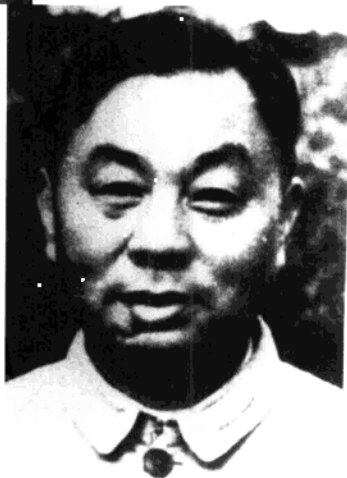
八路军第四纵 队第六旅代旅长、新四 军第四师第十二旅旅长 、淮北军区副司令员饶 子健