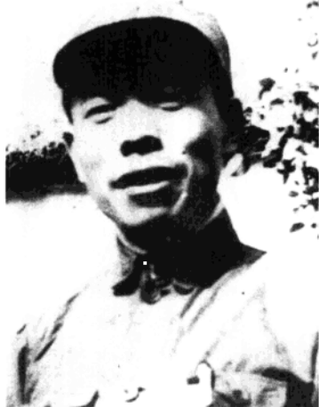
新四军第六支队政治部副主任、八路军第四纵队第六旅、新四军第四师第十二旅政治委员、新四军第四师政治部副主任、第十一旅政治委员、淮北保安军司令部司令员、淮北区司令部司令员赖毅