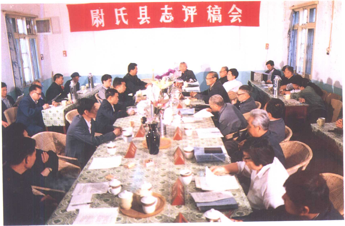
尉氏县志评稿会场