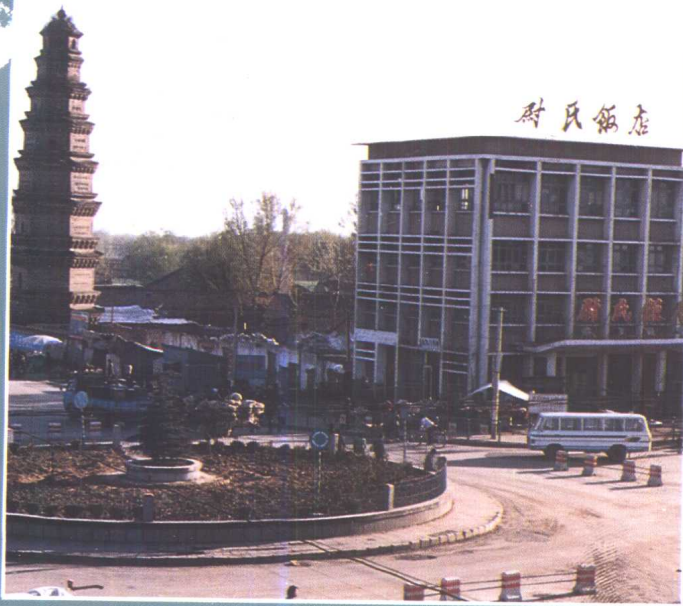
国道、省道交汇于县城东关