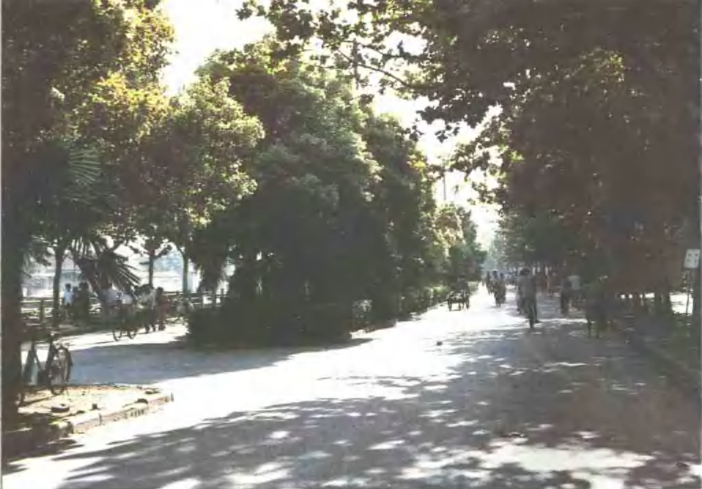
▲ 解放路林荫道 ▼ 正阳桥