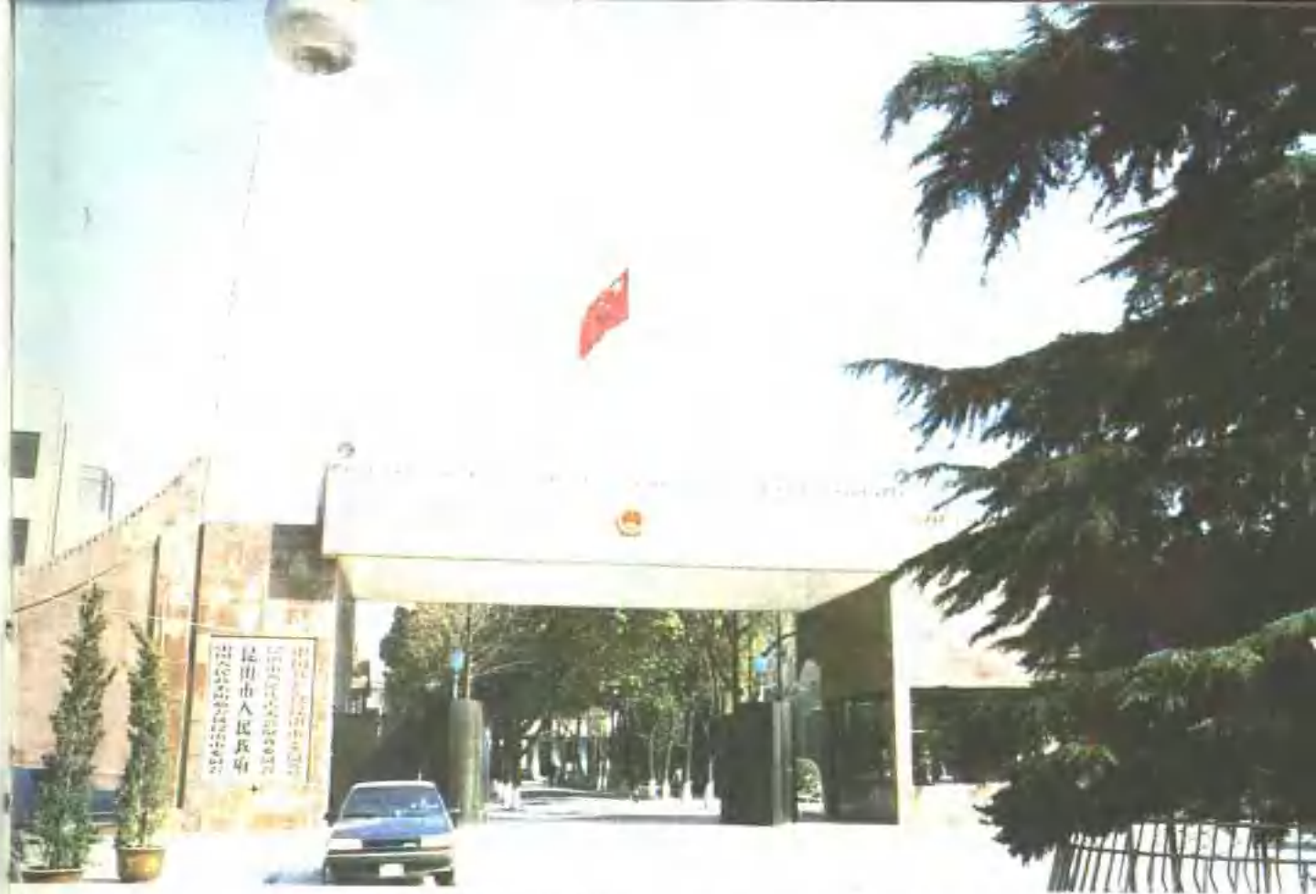
▼ 人民南路、朝阳路十字路口 ▲ 昆山市人民政府(1989年9月28日撤县建市)