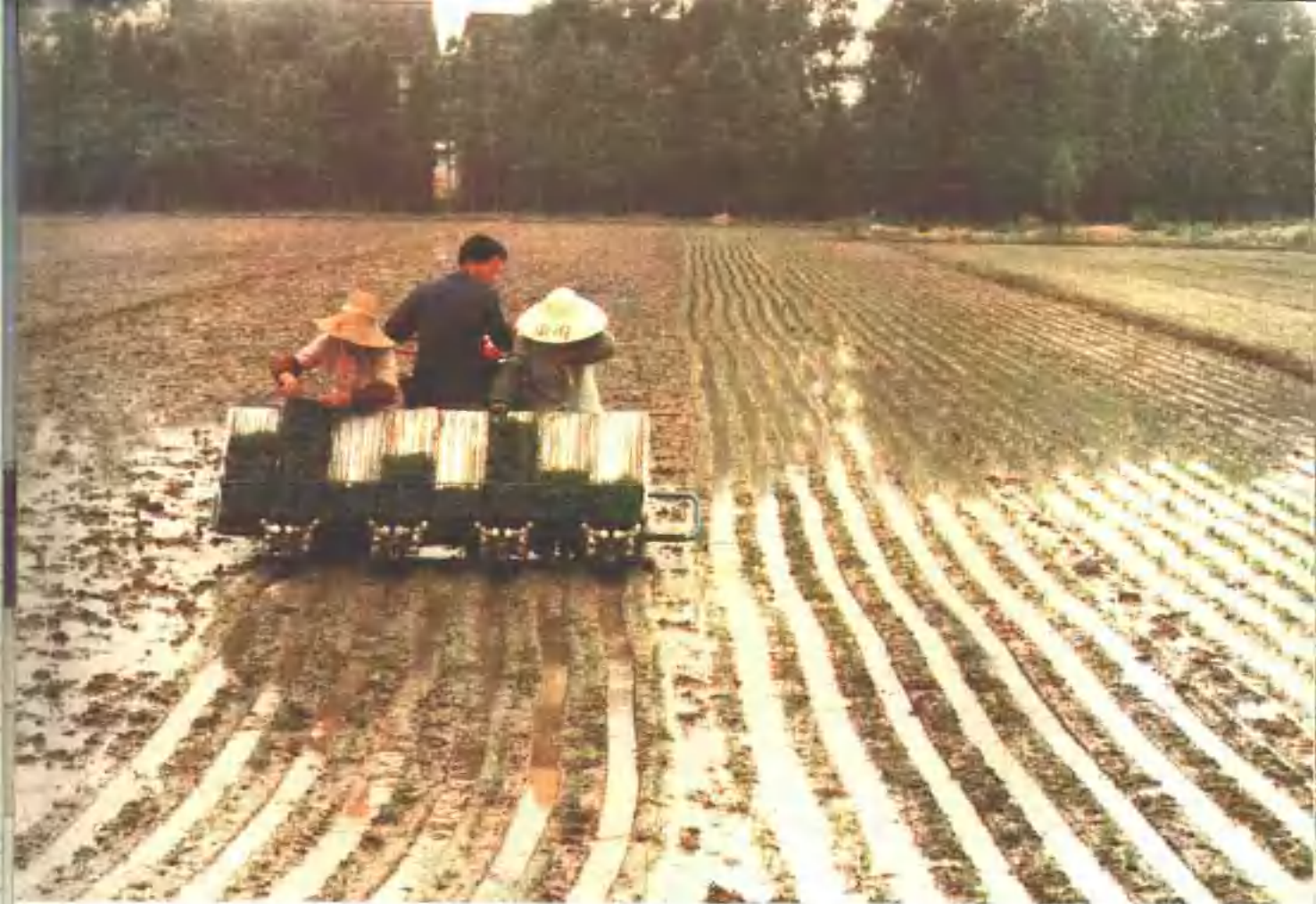
▲ 水稻机械栽插 ▼ 割晒机收割小麦