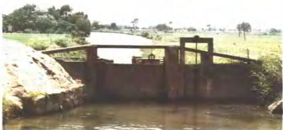
▶ 60年代兴建的一字门式圩口闸