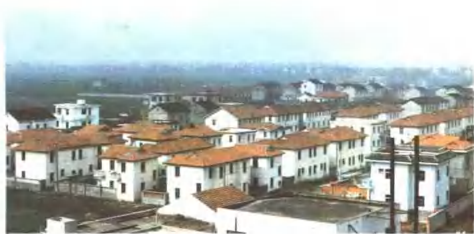
◀ 巴城镇农民住宅群 ▶ 淀山湖挡洪墙