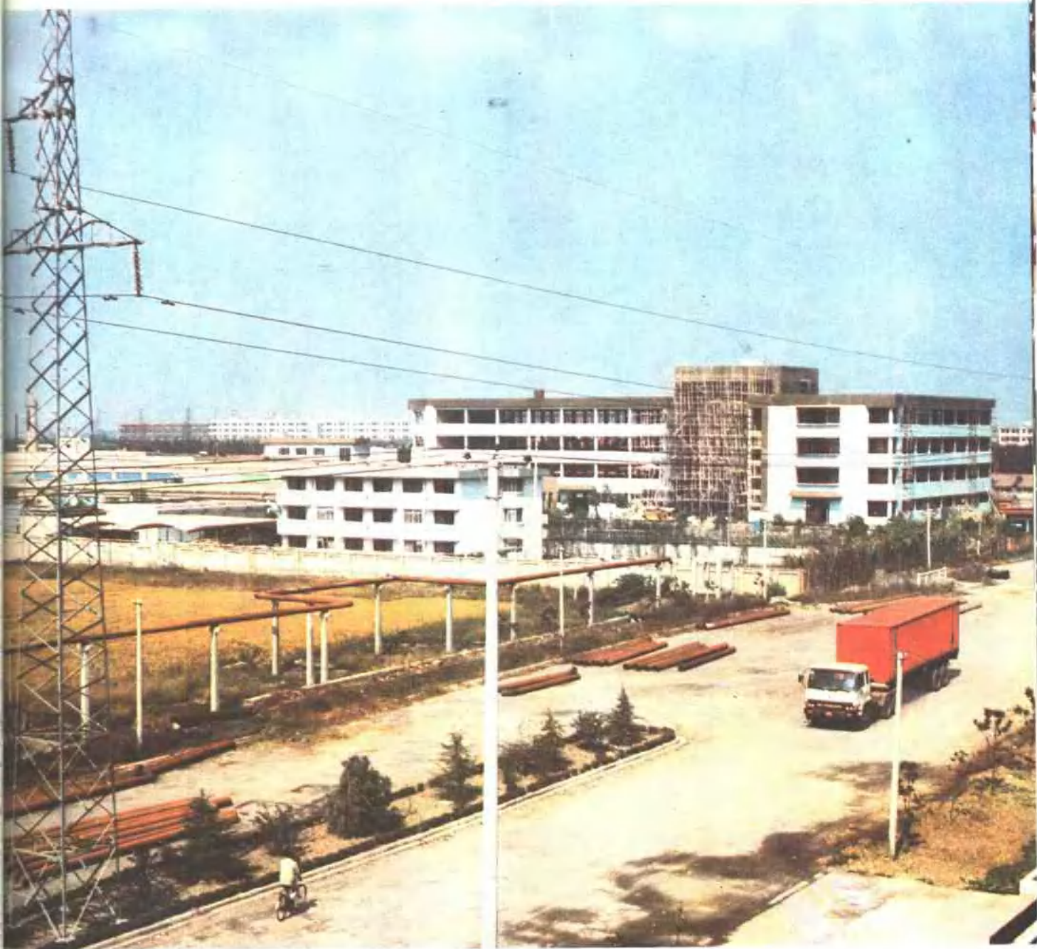
▲ 建设中的昆山经济技术开发区