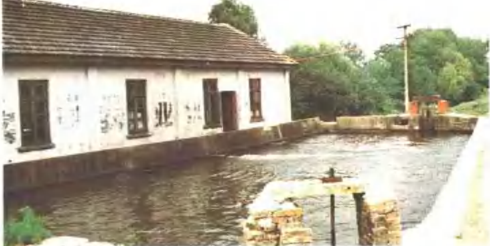
▶ 1958年全县首批兴建的混流泵站——周市更楼站