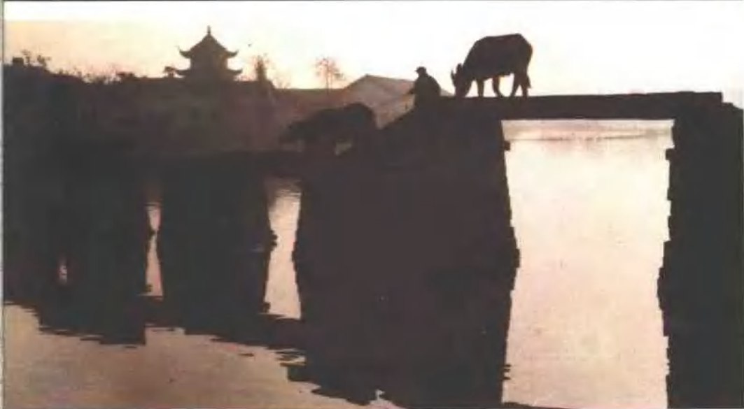
▲古镇陈墓晨曦 ▶1958年昆山民工参加 疏浚浏河工程