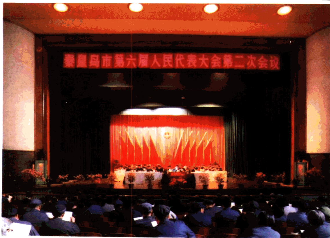
上: 秦皇岛市第六届人民代表大会第二次会议会场