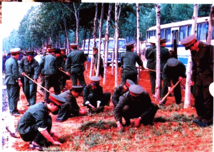
上：海防巡逻 中：治理四河会战 下：城市绿化