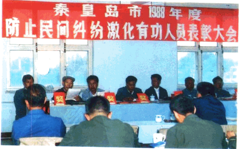
上:案情研究 中:秦皇岛市人民检察院 下:民间纠纷调解 表彰会议