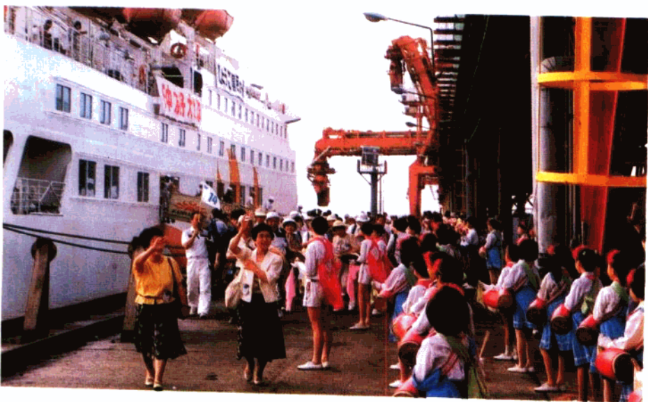
上：第五届“北戴河之夏”对外经济贸易洽谈会 下：外事活动