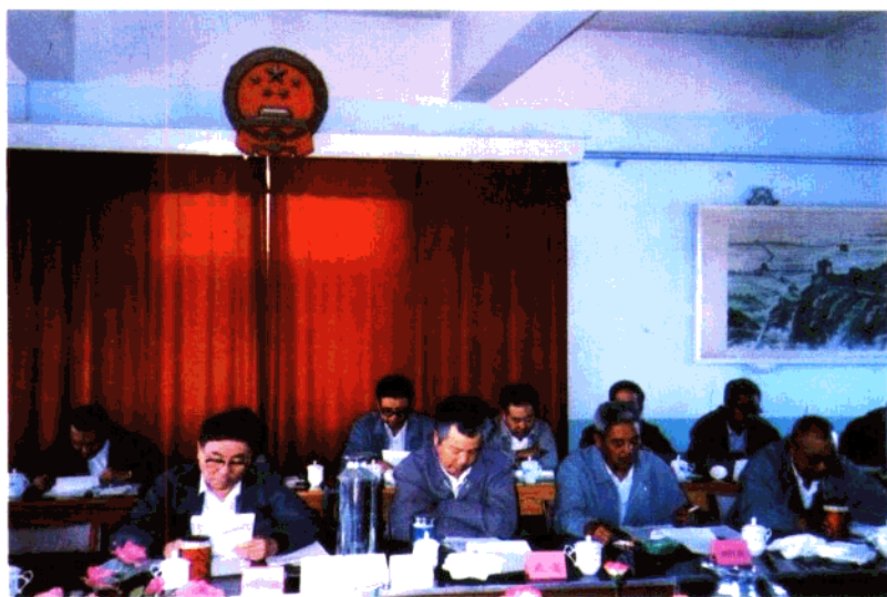
下: 秦皇岛市人大常委会会议