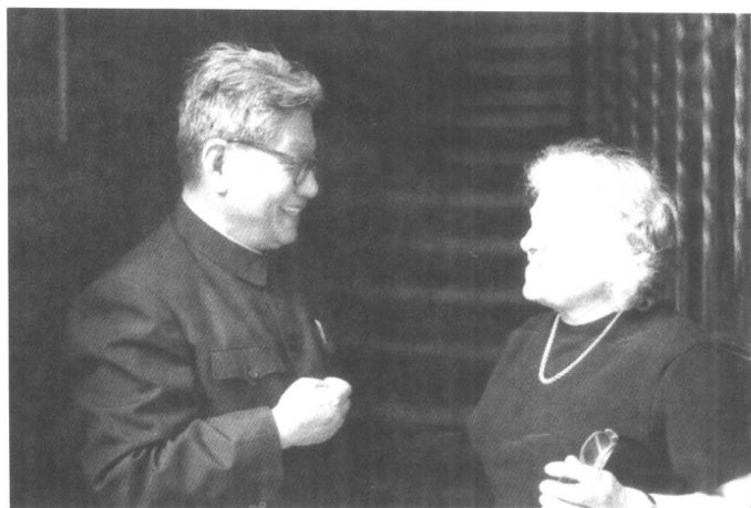
重访海德堡时在旧居前与房东的女儿交谈（1979年）