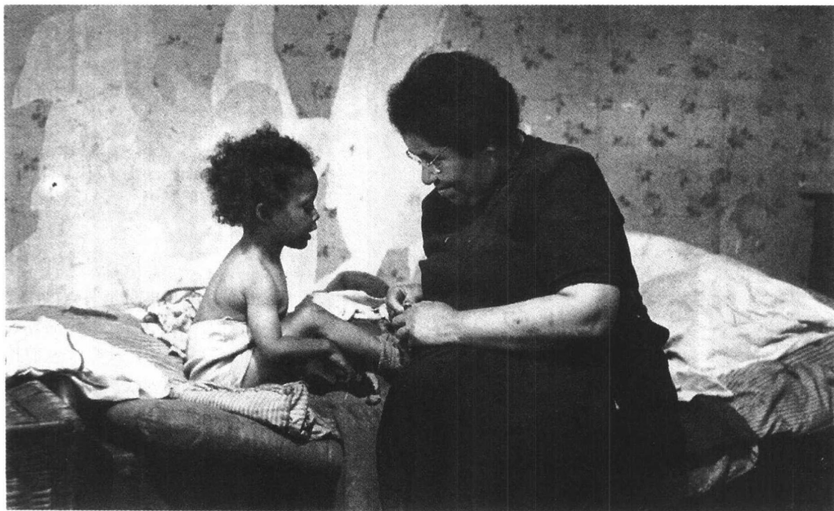
图 1.2 这幅照片是伯特·哈迪于1949年为《图片邮报》周刊拍摄的。见正文。