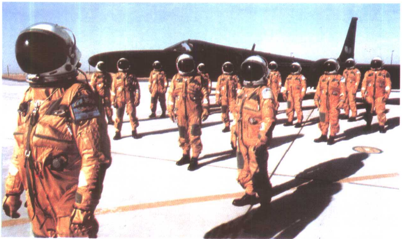
U-2 高空间谍飞机和穿着压力服的U-2 飞行员