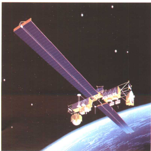
下 美国“军事星 II” 通信卫星