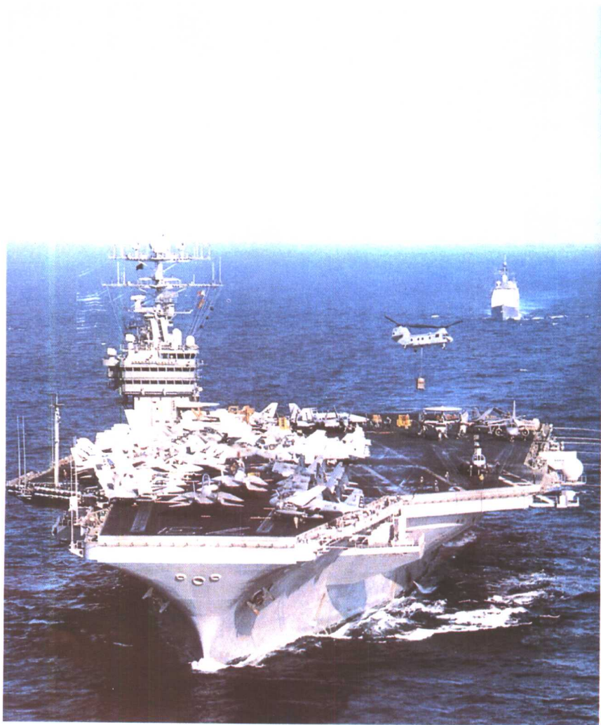
美国海军“华盛顿”号航空母舰