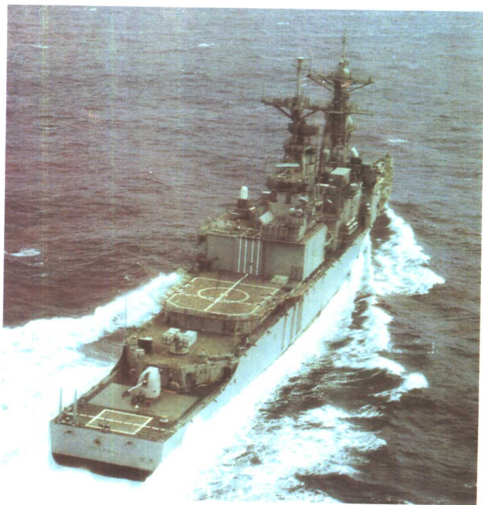
美国装有“宙斯盾”系统的“伯克”级驱逐舰