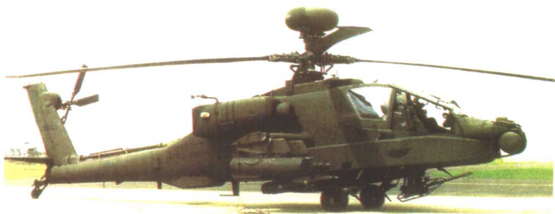
AH-64D “长弓阿帕奇” 武装直升机