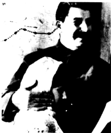
斯大林与塔吉克斯坦少女