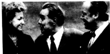
勃列日涅夫与勃兰特夫妇