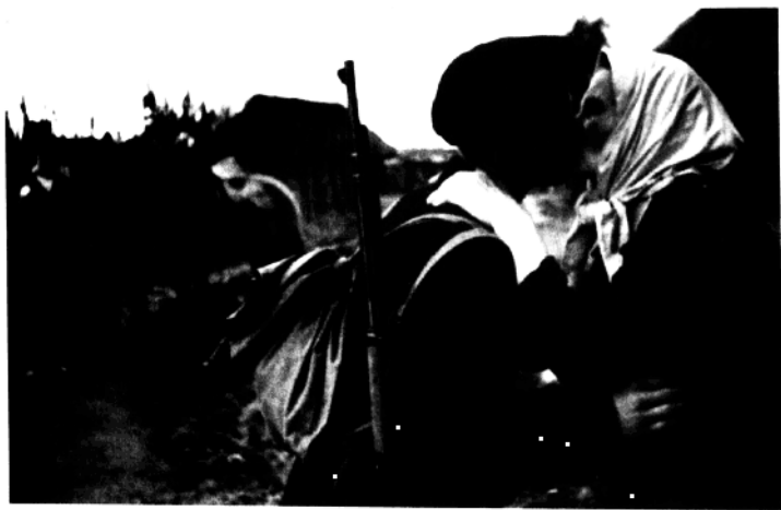
1942年斯大林格勒保卫战中,母子别离。