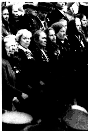
走过红场的二战女兵