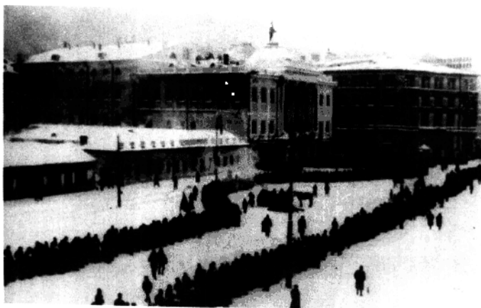
吊唁列宁的群众队伍