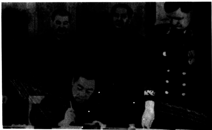
斯大林、毛泽东出席《中苏友好同盟互助条约》签字仪式