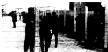
1961年东德士兵构筑“柏林墙”