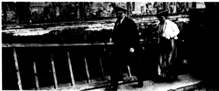
1918年列宁与夫人克鲁普斯卡娅走在街上