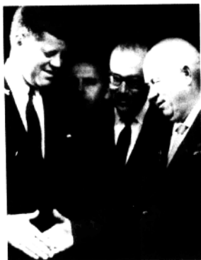
赫鲁晓夫与肯尼迪