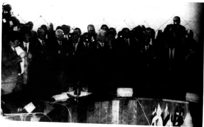
1991年12月，二个共和国领导人宣布成立独联体