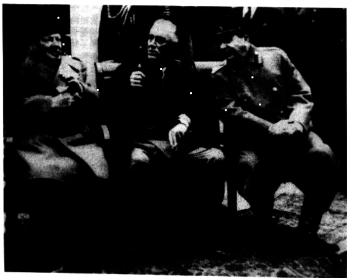
雅尔塔会议上的丘吉尔、罗斯福和斯大林