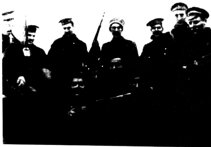
参加攻打冬宫的战士