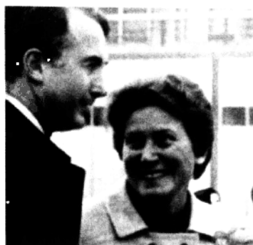
斯大林女儿斯维特兰娜出走纽约