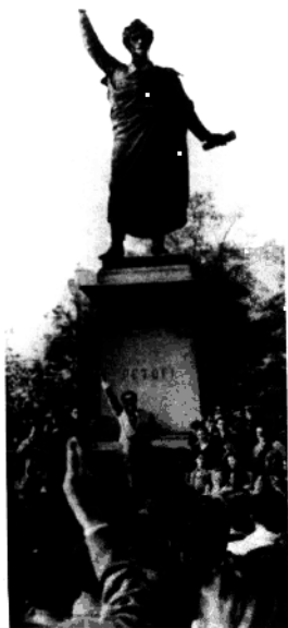
“匈牙利事件”中的演讲者