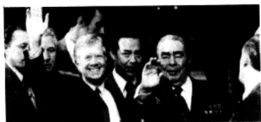
勃列日涅夫与卡特