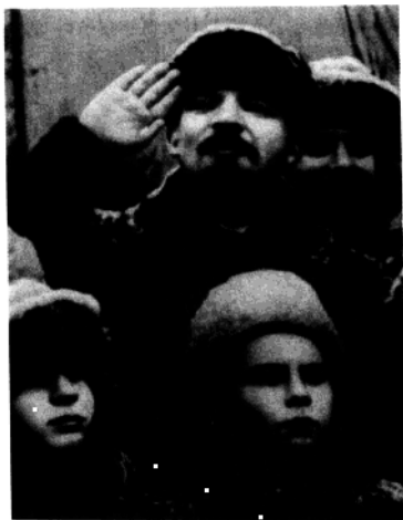
1919年11月7日,列宁在红场上