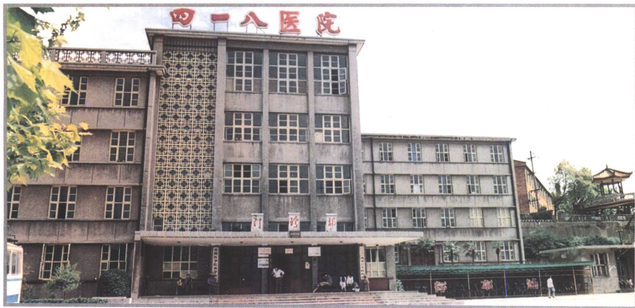
四一八医院门诊部