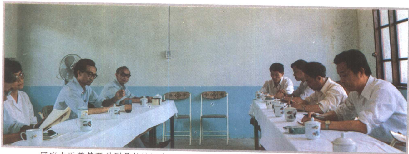
国家中医药管理局副局长诸国本(右一)1989年考察剑河县民族医药