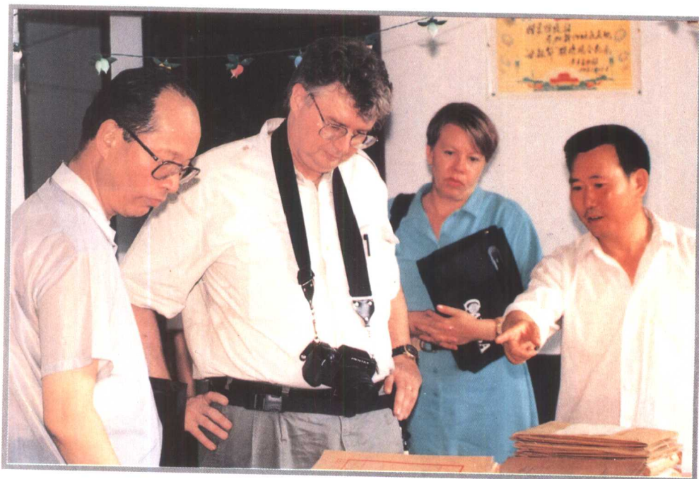
世界银行考察组官员摩尔博士（左二）1991年考察黄平县卫生防疫站