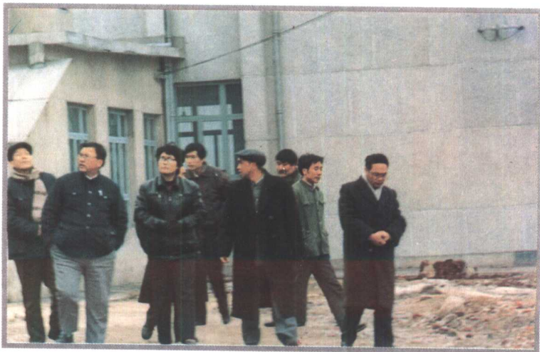
贵州省副省长张玉芹(左 三) 1989年视察黔东南州中医 院(左二为贵州省卫生厅长乐光 志)