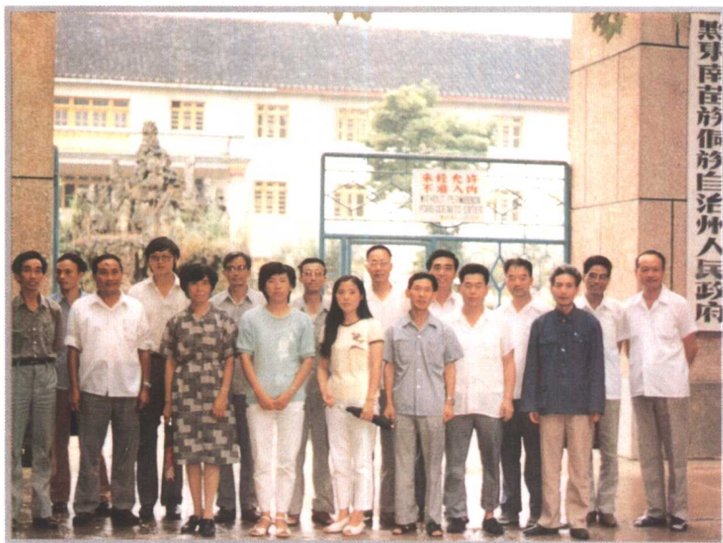
黔东南州副州长姚茂森与林业部赴黔东南扶贫医疗队合影(1989年)