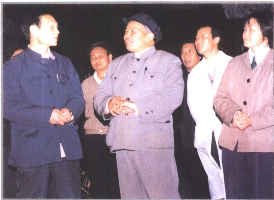
贵州省长王朝文 (前中) 1990年视察黄 平县人民医院