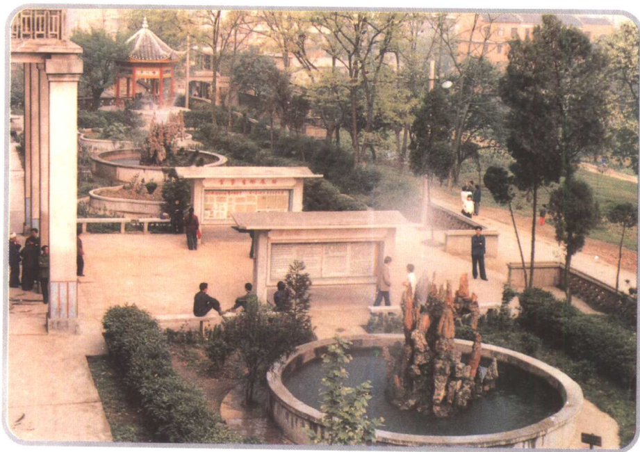
州人民医院门诊部一角