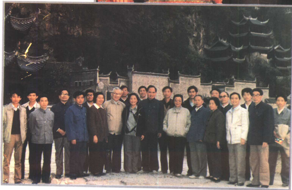
钱正英副主席 1988年视察镇远县