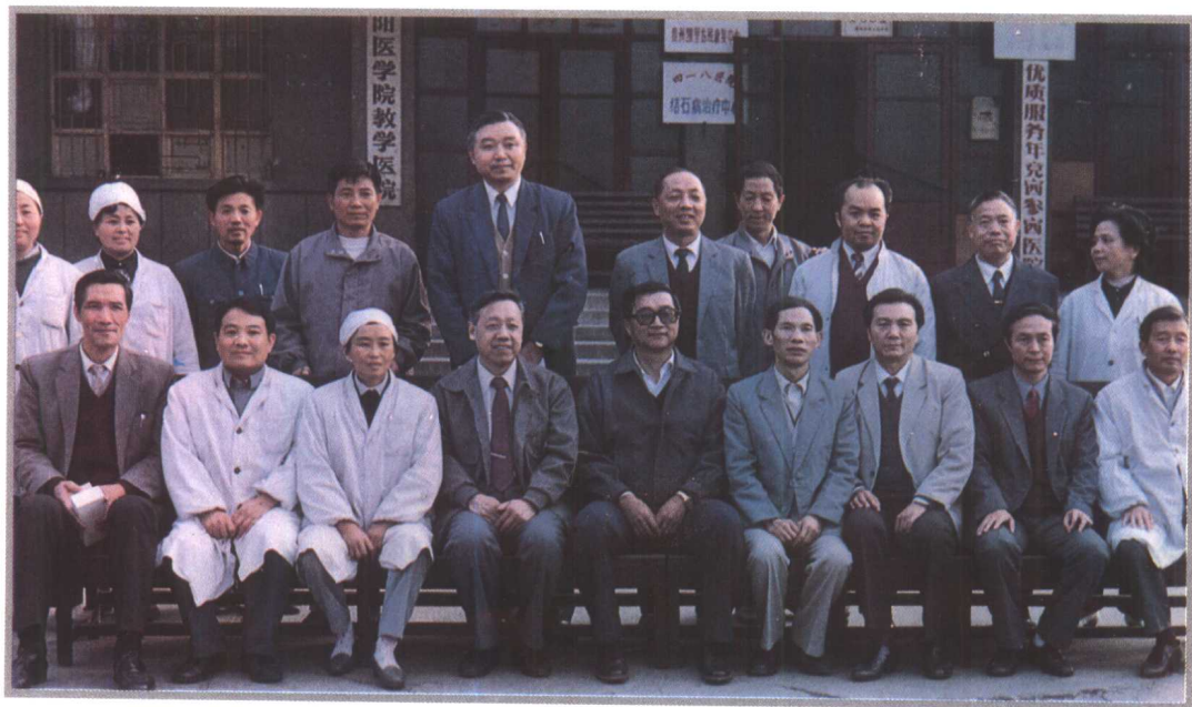
电子工业部副部长胡启立（前排左五）1991年视察四一八医院