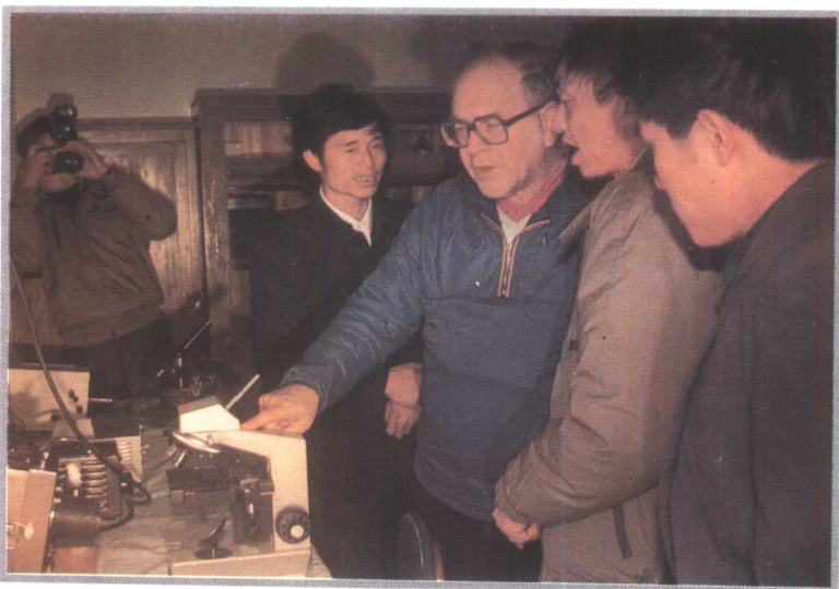
世界卫生组织寄生虫病学专家温斯多弗博士（右三）1988年考察凯里市疟疾防治工作