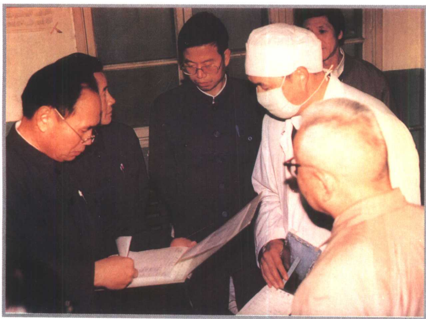
全国政协医卫体委员会副主 任、原卫生部副部长郭子恒(左 一) 1988年视察黔东南州人民 医院