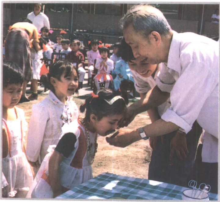
黔东南州副州长王耀伦给儿童喂服脊髓灰质炎糖丸疫苗(1987年)