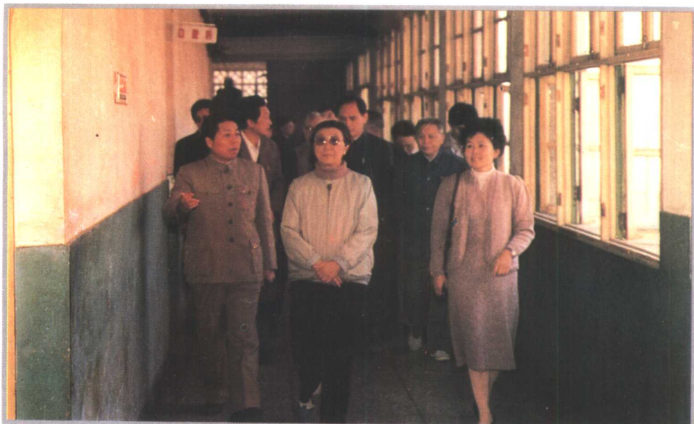
全国政协副主席钱正英（前中）1988年视察凯里市人民医院