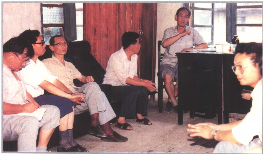
卫生部长陈敏章（左三）1991年视察黄平县谷陇区卫生院