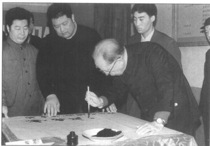
▲1986年4月20日中顾委副主任薄一波参观彭德怀同志故居 并题词：峥嵘风范，不移不淫不屈