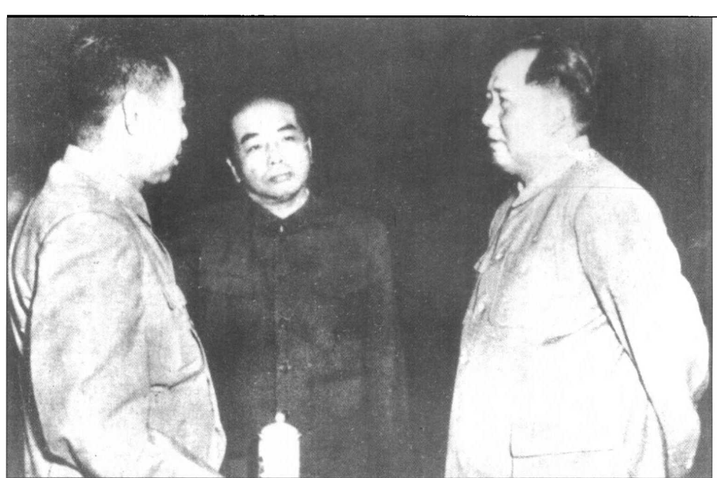
▲ 1956年9月，中共中央政治局委员彭德怀和毛泽东主席、周恩来副主席在中国共产党第八次全国代表大会上。