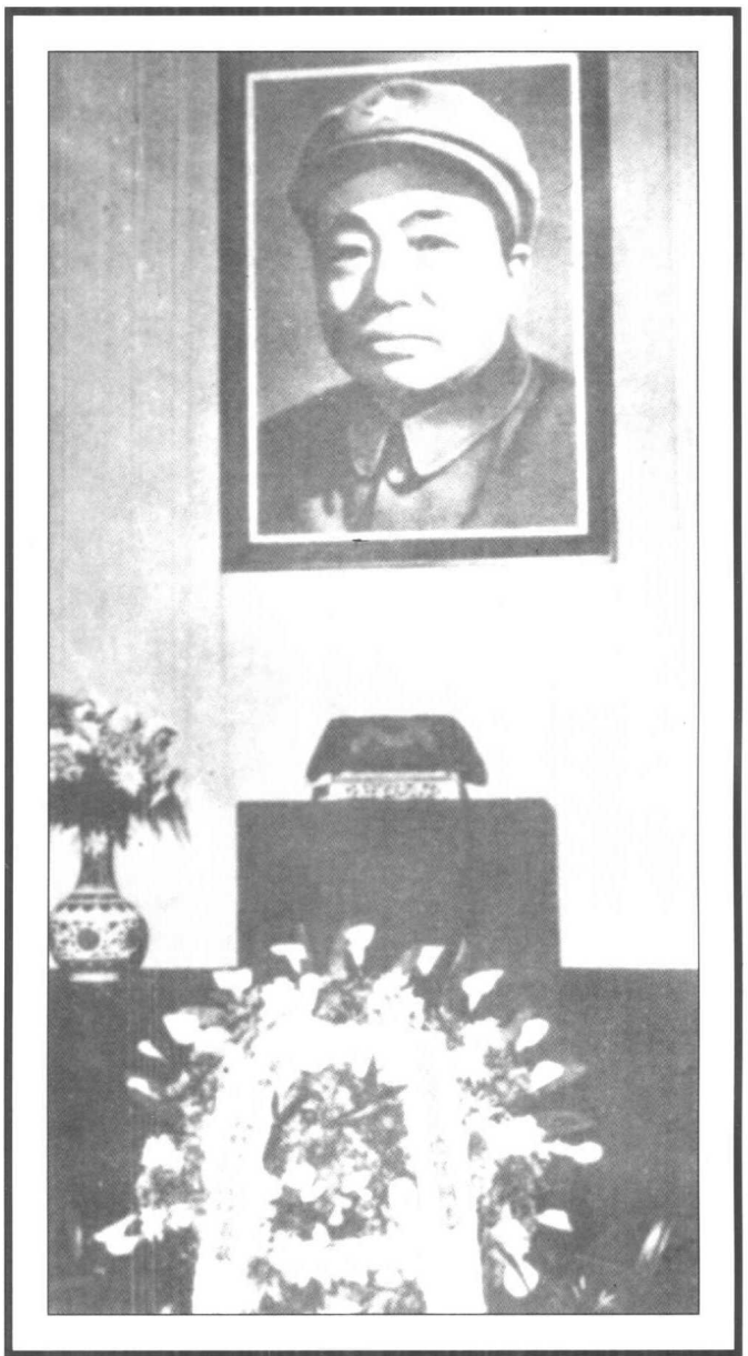
1978年12月24日，彭德怀同志追悼大会在北京人民大会堂隆重举行，骨灰盒上覆盖着中国共产党党旗。他的冤案平反昭雪了！