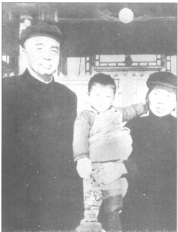
◀ 1964年，彭德怀在北京吴家花园住室前（右为弟媳龙国英）。这是仅存的彭总在吴家花园居住期间的一张照片。