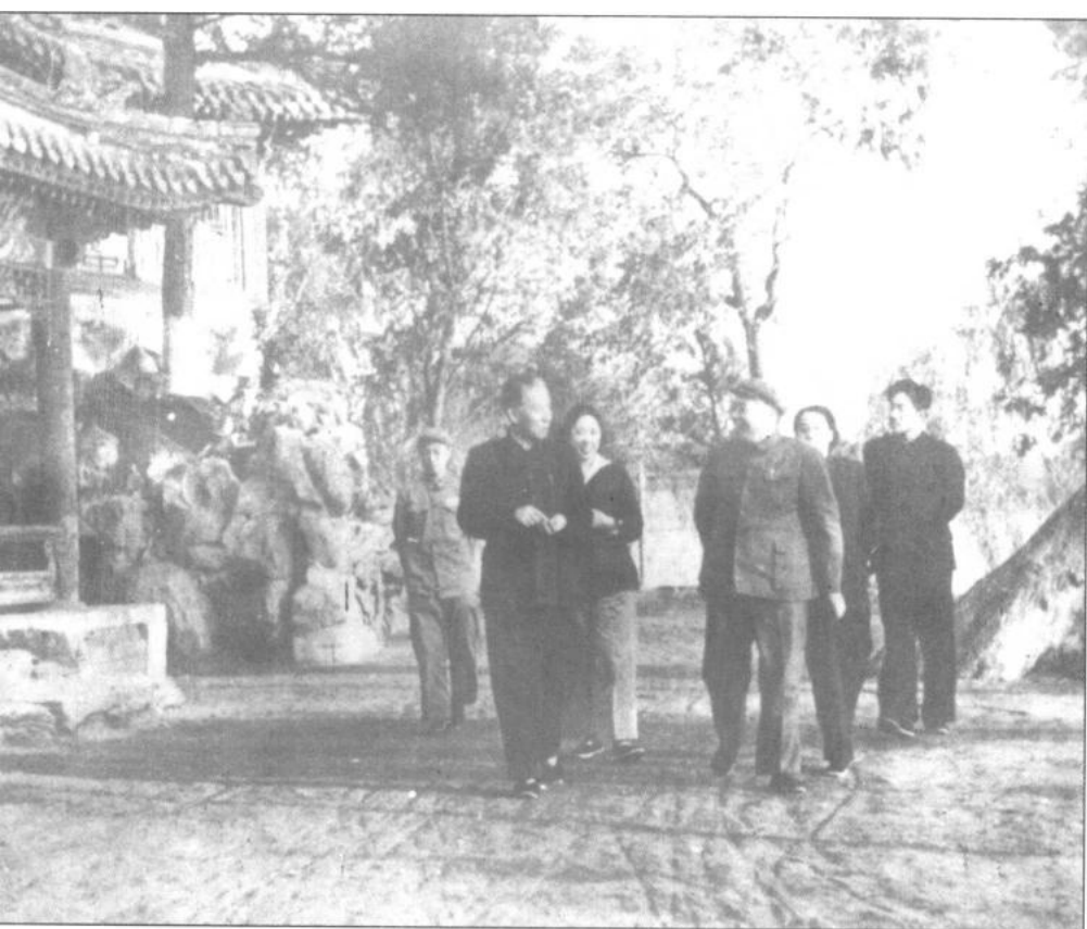
▲1953年5月17日，刘少奇、彭德怀、王光美、浦安修等同志在中南海瀛台散步。