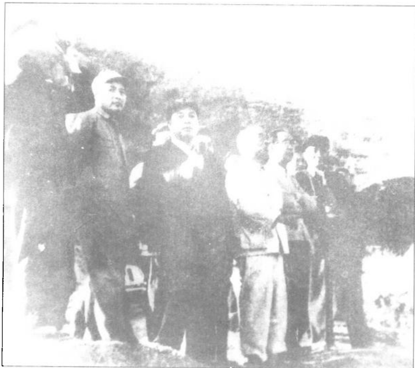
▲1964年，西南三线建委常务副主任程子华(右一)陪同国务院副总理李富春(右三)薄一波(右二)视察四川攀枝花钢铁厂厂址