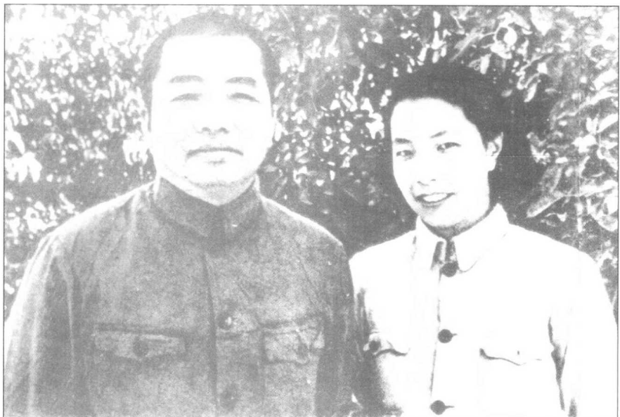
▲ 1946年夏，彭德怀和浦安修在延安枣园合影