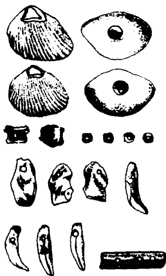
图1 北京房山周口店山顶洞人（距今二万五千年）所使用的串饰。

首饰的文明生活。在我国已公布的全国七千余处较大规模的新石器文化遗址中，几乎都有纺纱捻线的原始工具石纺轮。在河姆渡文化遗址及龙山文化遗址都发现过织布的工具骨梭、木机刀及机具卷布轴等。