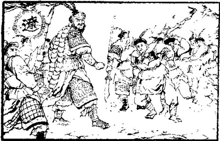
(11) 辽兵一听是杨门之后，吓得纷纷后退。