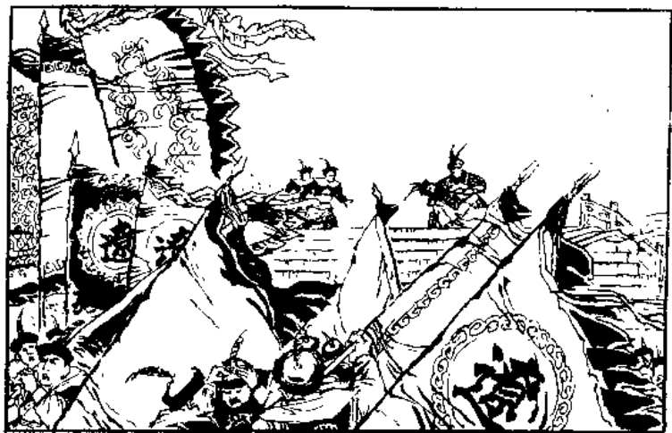
(1)杨大郎一箭射死天庆梁王,受降台上下一阵大乱。