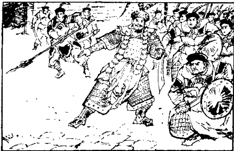
(6)韩昌下令,让众将一齐上,要死的,不要活的。