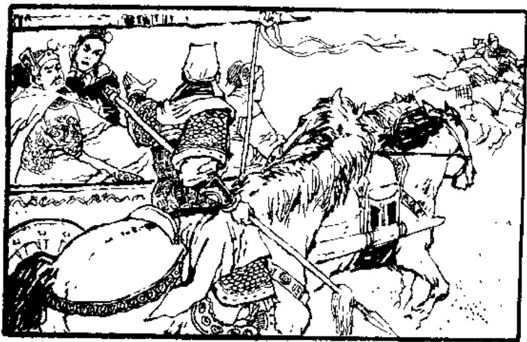
(9)杨六郎告诉众弟兄：快帮大哥下车鞦、上战马。