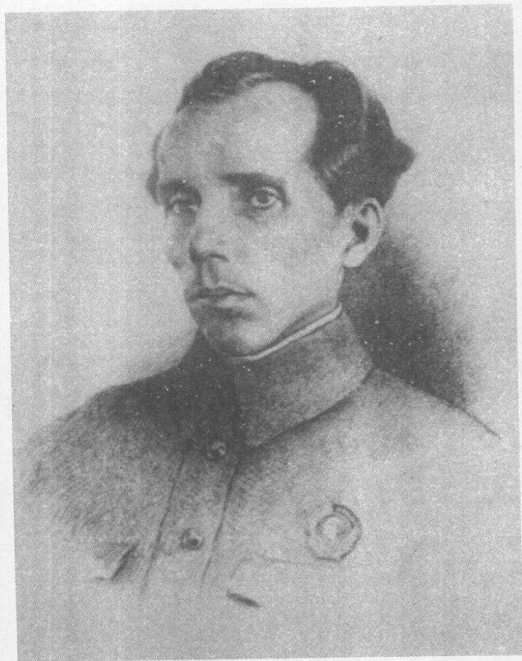
尼·奥斯特洛夫斯基