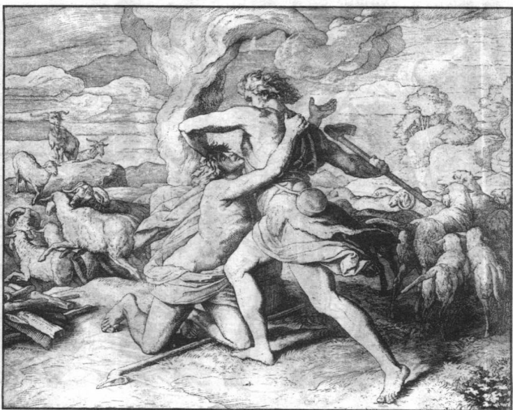
该隐与弟弟亚伯发生争吵扭打，最后杀死了亲弟弟