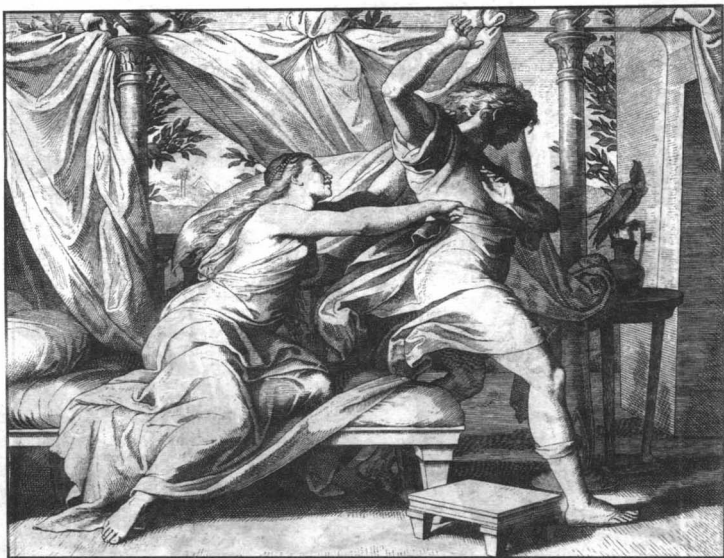
女主人一把抓住了约瑟的衣服，要强行与他同寝