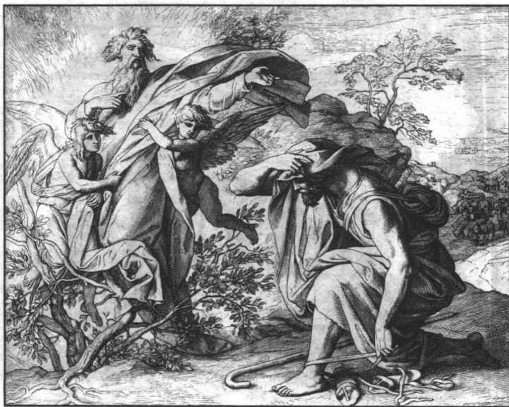
摩西接受上帝的命令，要把以色列人从埃及带出来