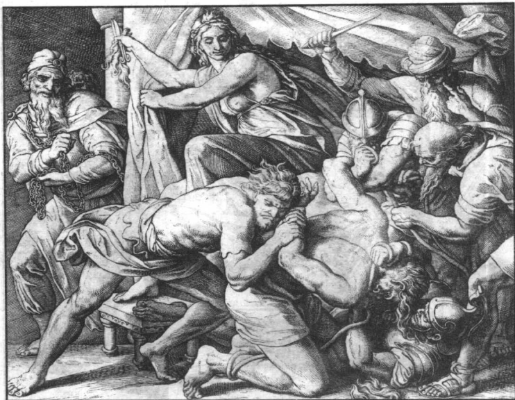
参孙被女子出卖，在睡觉时被剪掉了头发，失去了神力