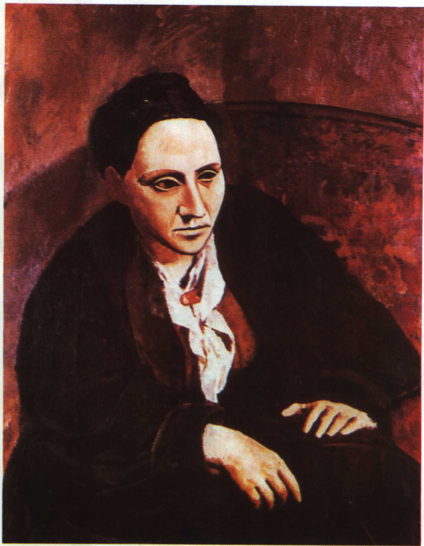
〔美〕格特魯德·斯泰因 (Gertrude Stein)