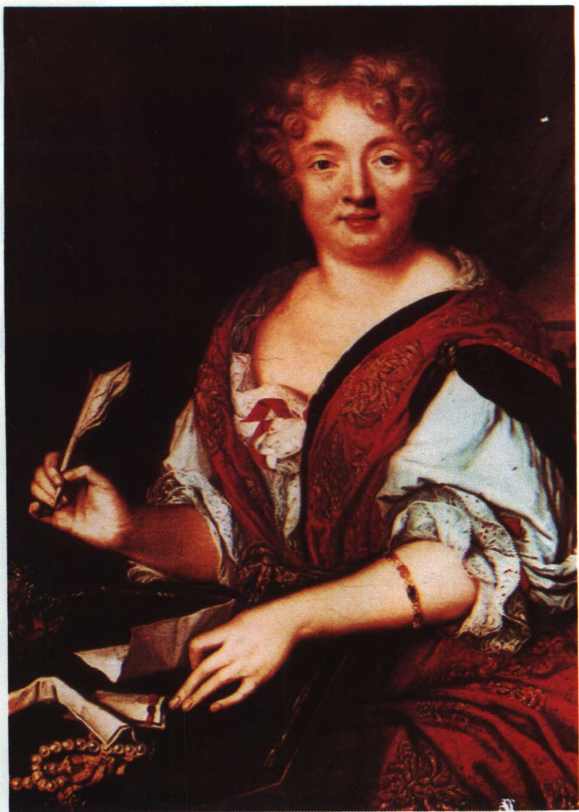
〔法〕塞維尼夫人 (Madame de Sevigné)