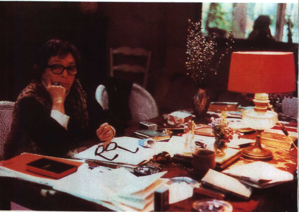
〔法〕瑪格麗特·迪拉斯 (Marguerite Duras)