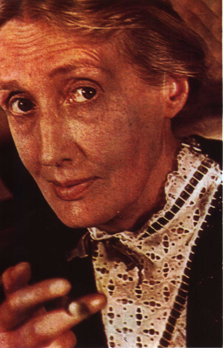
〔英〕吳爾夫 (Virginia Woolf)