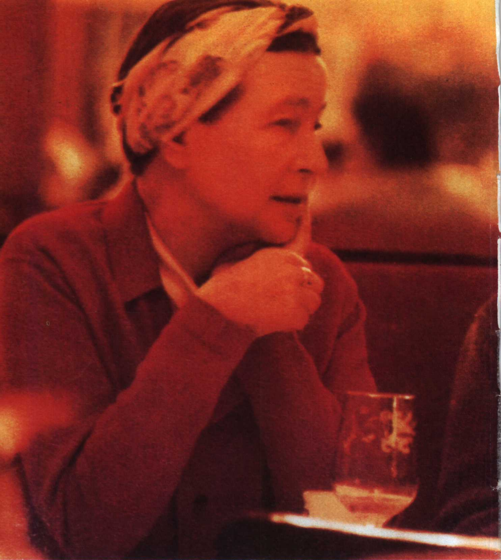
〔法〕西蒙娜·德·波伏瓦 (Simone de Beauvoir)