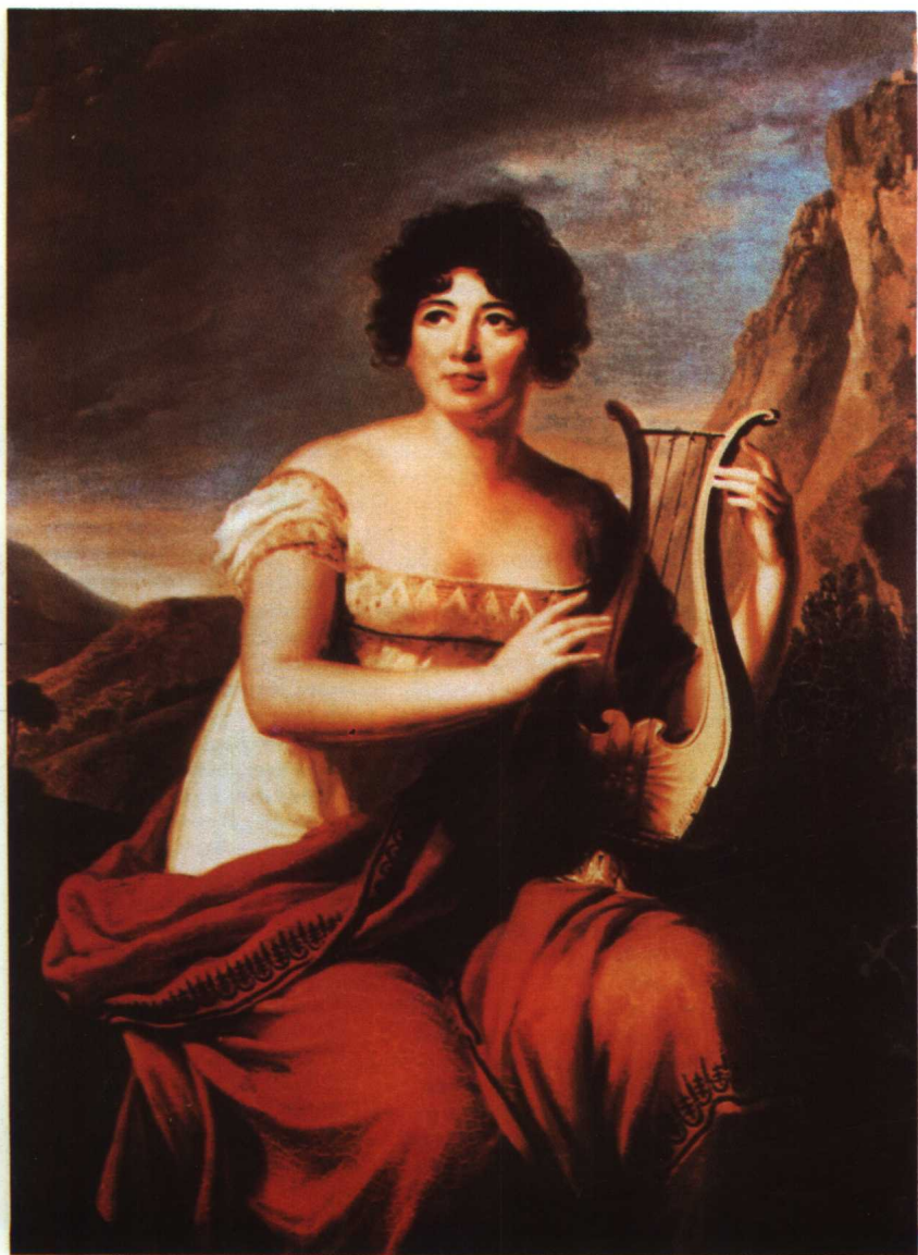
〔法〕斯達爾夫人 (Madame de Staël)