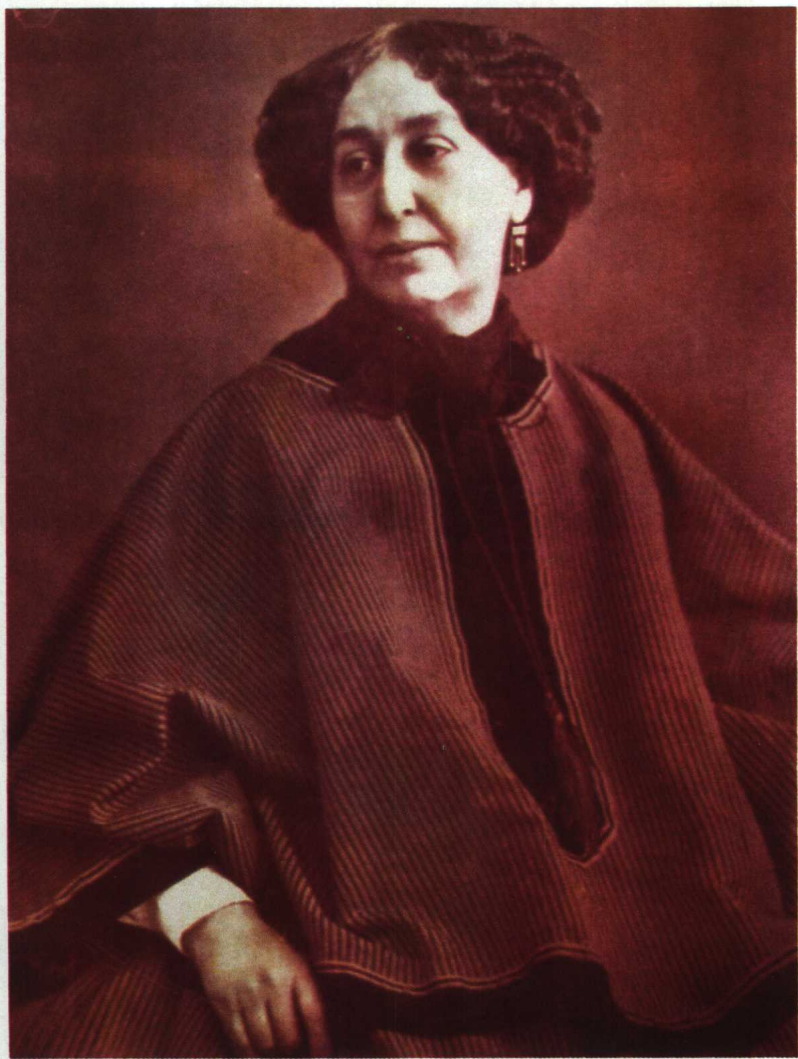
〔法〕 喬治·桑 (George Sand)