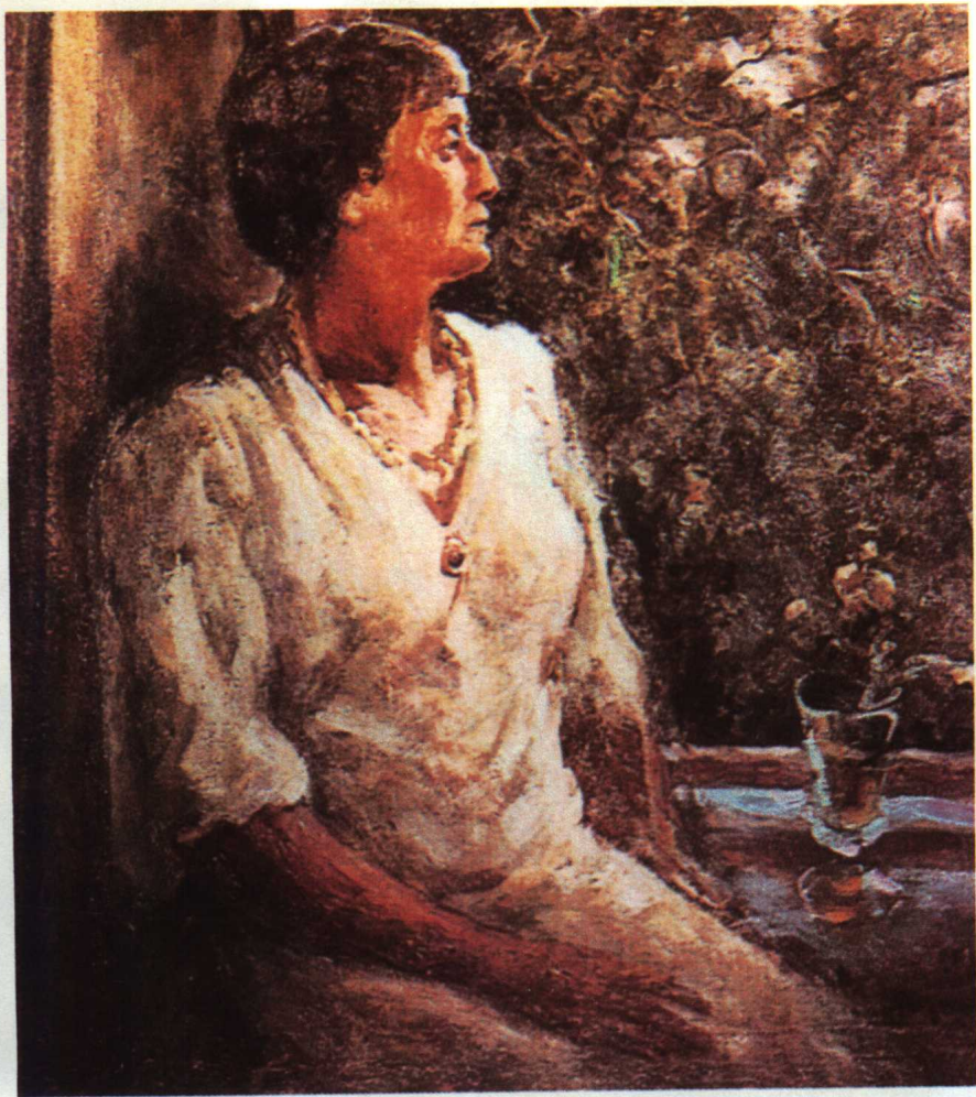
〔俄〕安娜·阿赫瑪托娃 ( Анна Андреевна АХМАТОВА )