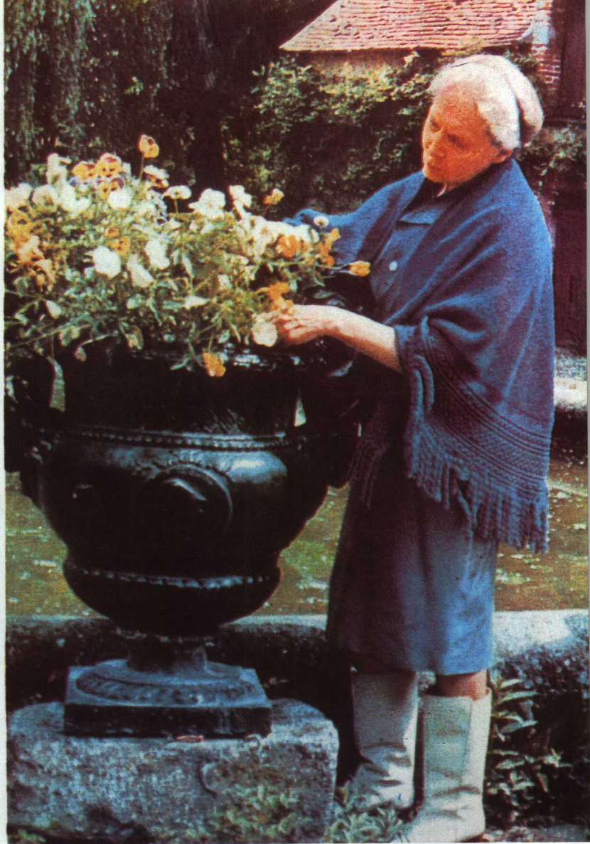
〔法〕埃爾莎·特里奧萊 (Elsa Triolet)